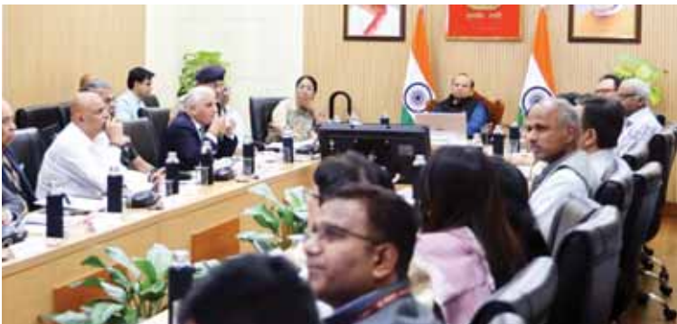
दिल्ली आपदा प्रबंधन प्राधिकरण की बैठक में अधिकारियों संग उपराज्यपाल विनय सक्सेना।

इस बैठक में शहरी बाढ़, अत्यधिक गर्मी के घटनाएं और इससे संबंधित राज्य हीट एक्शन योजना पर चर्चा हुई। उपराज्यपाल डीडीएमए के अध्यक्ष और मुख्यमंत्री उपाध्यक्ष हैं। बैठक में इस बात पर जोर दिया गया कि डीडीएमए बुनियादी ढांचे, जनशक्ति और तकनीक के मामले में काफी कमजोर है। दिल्ली देश के उन कुछ राज्यों में से एक है, जिसके पास अपना खुद का राज्य आपदा प्रतिक्रिया बल नहीं है। यहां कमांड और कंट्रोल सेंटर का भी अभाव है, जिससे आपदा के समय एकीकृत और सटीक