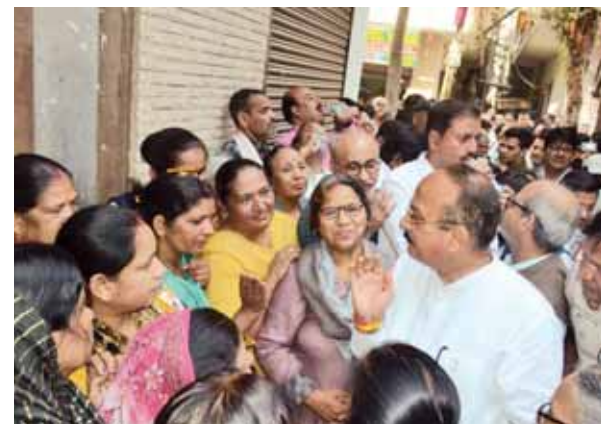
चाणक्य प्लेस पार्ट-2 में जनसमस्याओं को सुनते शहरी विकास मंत्री।

शहरी विकास मंत्री आशीष सूद बुधवार को जनकपुरी विधानसभा क्षेत्र के चाणक्य प्लेस पार्ट-2 में जाकर क्षेत्र को विभिन्न जनसमस्याओं का निरीक्षण किया। इस दौरान स्थानीय लोगों ने बिजली, पानी, सुरक्षा, वृद्धा पेंशन, सीवर, सड़कों की मरम्मत, साफ-सफाई जैसी कई समस्याओं से उन्हें अनगत कराया। मंत्री ने संबंधित विभागीय अधिकारियों को मौके पर ही त्वरित समाधान सुनिश्चित करने के निर्देश दिए और लापरवाह अधिकारियों को कड़ी चेतावनी दी। उन्होंने स्पष्ट किया कि हर पखवाड़े क्षेत्रीय कार्यों की समीक्षा होगी और जनता को परेशान करने वाले अधिकारी की जवाबदेही भी तय की जाएगी। उन्होंने कहा कि जन सुविधाओं के साथ-साथ स्वच्छता और सुरक्षा को बेहतर बनाने के लिए उनकी सरकार प्रतिबद्धता के साथ