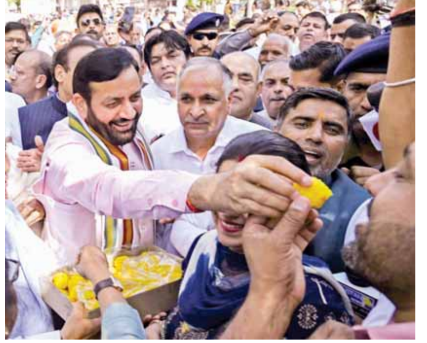
हरियाणा के मुख्यमंत्री नायब सिंह सैनी ने नगर निगमों के लिए हुए चुनाव में भाजपा के मेयर उम्मीदवारों की जोरदार जीत के बाद पार्टी कार्यकर्ताओं के बीच मिठाई बांटी।

सात नगर निगमों - गुरुग्राम, मानेसर, फरीदाबाद, हिसार, रोहतक, करनाल और यमुनानगर में महापौर और वार्ड सदस्यों के चुनाव के लिए मतदान 2 मार्च को हुआ था। अंबाला और सोनीपत में महापौर पदों के लिए उपचुनाव 21 नगर निगम समितियों में अध्यक्ष और वार्ड सदस्यों के चुनाव भी उसी दिन हुए थे। परिणामों में कांग्रेस को एक ओर झटका दिया है, जिसमें चुनावों से पहले जिलों में कार्यकर्ताओं और नेताओं ने भाजपा का दामन थाम लिया था। पार्टी की राज्य इकाई अतीत में अंरूनी कलह और गुटबाजी से ग्रस्त रही है, जबकि भाजपा के पास जमीनी स्तर पर एक सुव्यवस्थित और मजबूत संगठनात्मक ढांचा है। सैनी ने कहा कि लोगों ने भाजपा सरकार के कार्यों और नीतियों पर अपनी स्वीकृति की मुहर लगाई है। सैनी ने चल रहे राज्य विधानसभा सत्र के दौरान