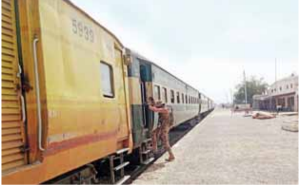
पाकिस्तान के दक्षिण-पश्चिमी बलूचिस्तान प्रांत के बोलन जिले के मुश्कफ में उग्रवादियों द्वारा यात्री ट्रेन पर किए गए हमले के स्थल के पास रेलवे स्टेशन पर अर्धसैनिक बल का एक जवान।

पाकिस्तान के बलूचिस्तान में विद्रोहियों ने एक ट्रेन पर कब्जा कर बंधक बनाए गए 21 यात्रियों और अर्धसैनिक बलों के चार जवानों की हत्या कर दी। सेना के एक जनरल ने बुधवार को यह जानकारी दी। सेना के प्रवक्ता लेफ्टिनेंट जनरल अहमद शरीफ ने टीवी चैनल दुनिया न्यूज को बताया कि सुरक्षा बलों ने घटनास्थल पर मौजूद सभी 33 विद्रोहियों को मार गिराया है। लेफ्टिनेंट जनरल शरीफ ने कहा, सशस्त्र बलों ने सभी आतंकवादियों को मार गिराया और सभी यात्रियों को सुरक्षित छुड़ाकर आज (बुधवार) शाम को अभियान सफलतापूर्वक पूरा कर लिया। बलूच उग्रवादियों ने मंगलवार को एक सुरंग में हमला कर इस रेलगाड़ी पर कब्जा कर लिया था। अधिकारियों ने बताया कि सुरक्षा बलों एवं उग्रवादियों के बीच मुठभेड़ लगातार दूसरे दिन बुधवार को भी जारी रही। अधिकारियों ने बताया कि नौ डिब्बों में लगभग 400 यात्रियों को लेकर जाफर एक्सप्रेस ट्रेन क्रेटा से खैबर पखूनख्वा के पेशावर जा रही थी तभी उग्रवादियों ने विस्फोटकों का इस्तेमाल कर ट्रेन को बेअरती कर दिया और उस पर कब्जा कर लिया। बलूचिस्तान लिबरेशन आर्मी (बीएलए) ने मंगलवार को इस हमले की जिम्मेदारी ली। उग्रवादियों ने छह सैनिकों की हत्या कर दी हालांकि पाकिस्तानी अधिकारियों ने अब तक मारे गए लोगों की पुष्टि नहीं की है। सेना और फ्रंटियर कोर सहित सुरक्षा बल क्रेटा से 160 किलोमीटर दूर एक सुरंग में गुड्डवार और पीरू कुनरी के पहाड़ी इलाकों के पास ट्रेन पर नियंत्रण करने वाले उग्रवादियों का मुकाबला कर रहे हैं।