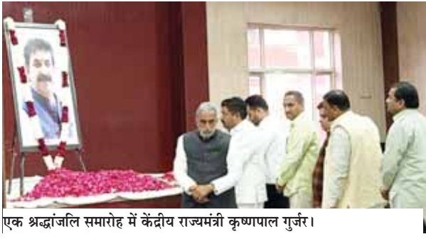
एक श्रद्धांजलि समारोह में केंद्रीय राज्यमंत्री कृष्णापाल गुर्जर।

इंसान थे, जिन्होंने अपना संपूर्ण जीवन समाजसेवा और लोगों के सुख-दुख में बीता दिया। गुर्जर सेक्टर-16 स्थित पंजाबी भवन में तिगांव विधानसभा क्षेत्र के