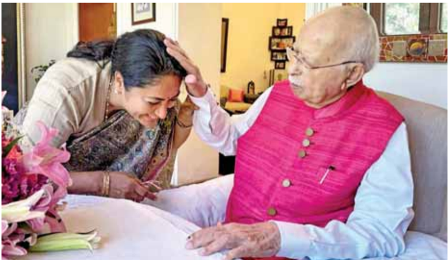
नई दिल्ली में दिल्ली की मुख्यमंत्री रेखा गुप्ता ने भाग्या के वरिष्ठ नेता लालकृष्ण आडवाणी से मुलाकात की।