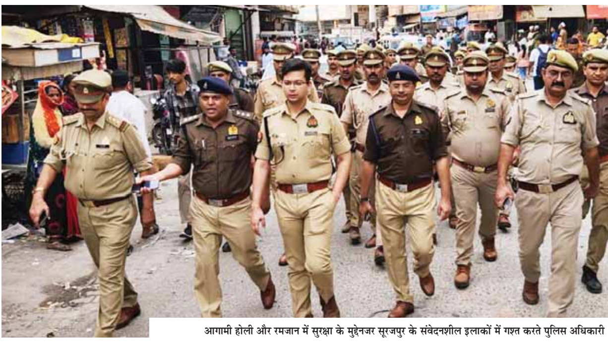
आगामी होली और रमजान में सुरक्षा के मुद्देनजर सूरजपुर के संवेदनशील इलाकों में गश्त करते पुलिस अधिकारी