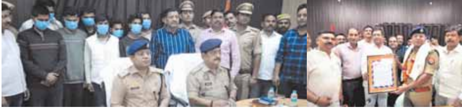
गिरफ्तार कर लिया। सभी के खिलाफ सुसंगत धाराओं में कार्रवाई कर न्यायालय भेज दिया।

● त्यापारियों ने पुलिस टीम को किया सम्मानित