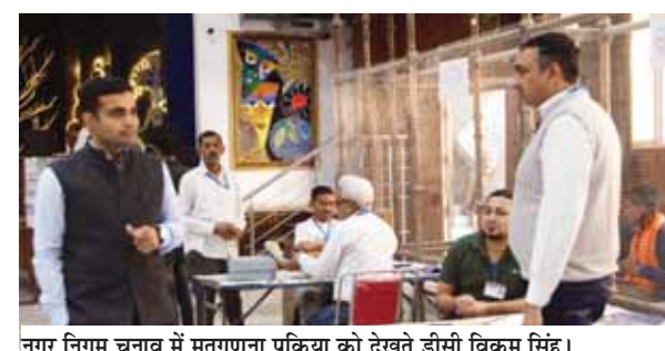
नगर निगम चुनाव में मतगणना प्रक्रिया को देखते डीसी विक्रम सिंह।

नगर निगम चुनाव के मद्देनजर बुधवार को फरीदाबाद जिला में व्यवस्था पूर्ण तरीके से सभी मतगणना केंद्रों पर मतगणना प्रक्रिया विधिवत रूप से संपन्न हुई। बेहतर सुरक्षात्मक ढंग से मतगणना का कार्य किया गया। मतगणना के दौरान जिला निर्वाचन अधिकारी एवं डीसी विक्रम सिंह ने मतगणना केंद्रों का दौरा कर मतगणना प्रक्रिया का जायज लिया।