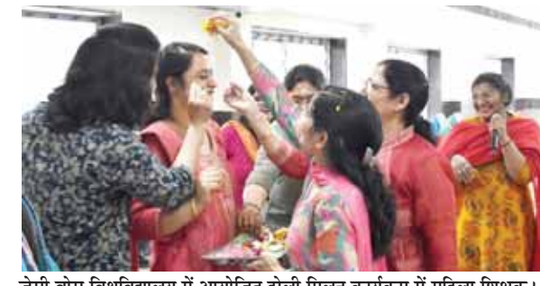
जेसी बोस विश्वविद्यालय में आयोजित होली मिलन कार्यक्रम में महिला शिक्षक।

होली के उपलक्ष्य में जेसी बोस विज्ञान एवं प्रौद्योगिकी विश्वविद्यालय, वाईएमसीए, फरीदाबाद के स्टाफ क्लब द्वारा 'होली मिलन' कार्यक्रम आयोजित किया गया। इस अवसर पर विश्वविद्यालय के शिक्षकों और कर्मचारियों द्वारा फूलों और रंगों से होली खेली गई।