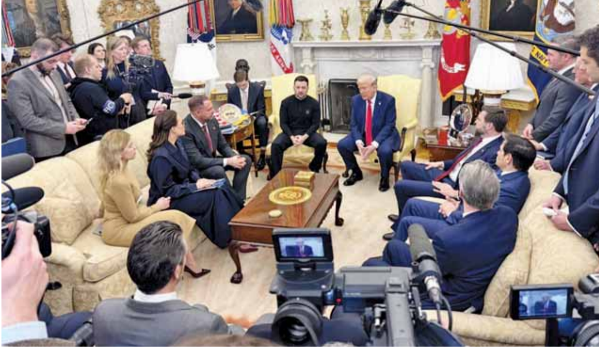
अमेरिका राष्ट्रपति डोनाल्ड ट्रंप ने वॉशिंगटन में व्हाइट हाउस स्थित ओवल कार्यालय में यूक्रेन के राष्ट्रपति वोलोदिमिर जेलैस्की से मुलाकात की

यूरोपीय आयोग की अध्यक्ष उर्सुला वोन डेर लेएन ने एक्स पर लिखा, आपने जो गरिमा दिखाई, उसने यूक्रेन के लोगों की बहादुरी को दर्शाया है। मजबूत, बहादुर और निडर बने रहें, प्रिय वोलोदिमिर जेलैस्की। हम न्यायपूर्ण और स्थायी शांति के लिए आपके साथ काम करते रहेंगे। फ्रांस के राष्ट्रपति इमन्युएल मैक्रॉन ने एक्स पर लिखा, एक हमलावर है: रूस। एक पीड़ित है: यूक्रेन। हमारा तीन साल पहले यूक्रेन को मदद करना और रूस पर प्रतिबंध लगाना सही था - और ऐसा करते रहना सही भी है। मैक्रॉन ने कहा, हमारे से मेरा तात्पर्य अमेरिकी, यूरोपीय, कनाडाई, जापानी और कई अन्य से है। उन्होंने कहा, उन सभी का आभार जिन्होंने मदद की और कर रहे हैं। उन लोगों के प्रति सम्मान