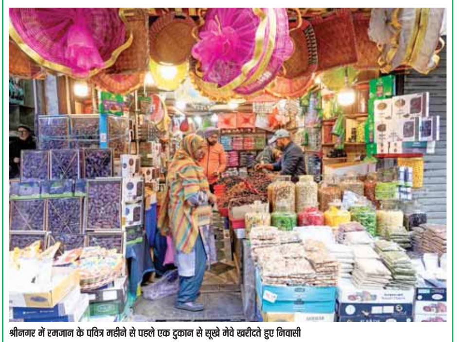
श्रीशैलम में रजाना के पतिव्रत महीने से पहले एक दुकान से सूखे मेवे खरीदते हुए गिटासी

चर्चाएं सतही ही रहेंगी। अदालत ने कहा कि इस मामले ने एक 'दुर्लभ उदाहरण' दिखाया जहां बस कंडक्टर और एक अन्य सह-यात्री जैसे अजनबियों ने 'सराहनीय साहस' का प्रदर्शन किया, क्योंकि उन्होंने अभियोजन पक्ष के समर्थन में पुलिस के साथ-साथ ट्रायल कोर्ट के सामने स्वतंत्र रूप से गवाही दी। इसमें कहा गया है कि ऐसे उदाहरण महिलाओं की सुरक्षा सुनिश्चित करने में सामूहिक जिम्मेदारी के महत्व को सुदृढ़ करते हैं और समाज में प्रत्येक व्यक्ति को उत्पीड़न के खिलाफ खड़ा होना होगा। अदालत ने कहा, इस मामले में, शिकायतकर्ता के साथ खड़े रहने वाले, हस्तक्षेप करने वाले और आरोपी को पकड़ने वाले सतर्क यात्रियों की उपस्थिति महत्वपूर्ण थी। (शेष पृष्ठ 9)