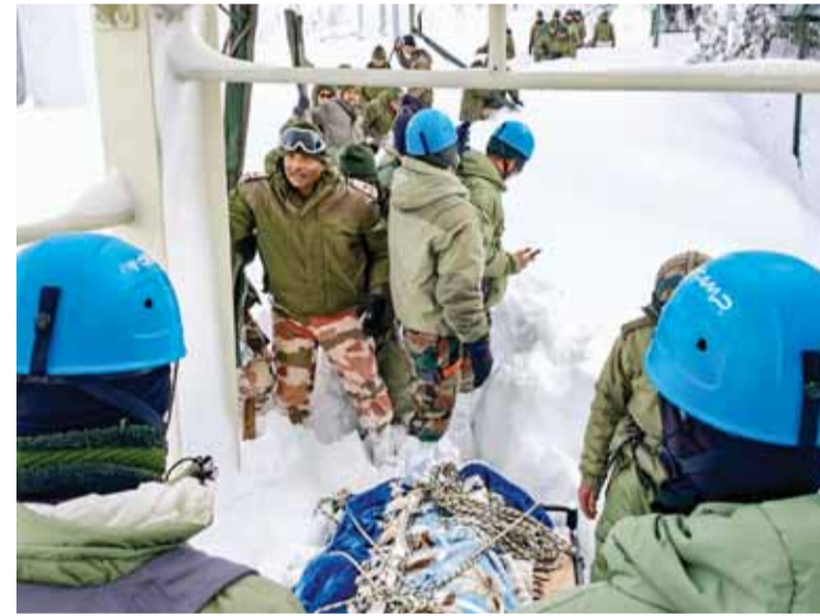
उत्तराखंड के चमोली जिले के माणा इलाके में हिमस्खलन के बाद कई मजदूरों के बर्फ में फंस जाने के पश्चात जारी बचाव अभियान

सेना के अनुसार, शुक्रवार सुबह 5.30 से 6 बजे के बीच माणा और बदीनाथ के बीच बीआरओ शिविर में हिमस्खलन हुआ, जिसमें 55 श्रमिक आठ कंटेनरों और एक शेड के अंदर दब गए। सेना के प्रवक्ता ने कहा, 'पचास मजदूरों को बचा लिया गया है, जिनमें से दुर्भाग्य से चार घायलों की मौत की पुष्टि की गई है, जबकि शेष पांच की तलाश जारी है।' उन्होंने कहा कि घायलों को निकालने में प्राथमिकता दी जा रही है। उत्तराखंड के मुख्यमंत्री पुष्कर सिंह धामी ने प्रभावित क्षेत्र का हवाई सर्वेक्षण किया और अधिकारियों को बचाव अभियान तेज करने का निर्देश दिया। दूसरी ओर प्रधानमंत्री नरेंद्र