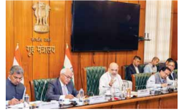
केंद्रीय गृह मंत्री अमित शाह ने नई दिल्ली में मणिपुर में सुरक्षा स्थिति की समीक्षा के लिए बैठक की अध्यक्षता की