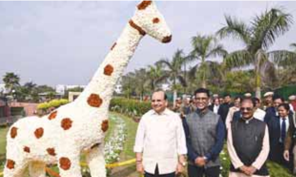
एनडीएमसी के पुष्प महोत्सव का उद्घाटन करते उपराज्यपाल बीके सक्सेना।

है। आवेदन के अनुसार, उपराज्यपाल का आदेश जांच समिति की सिफारिश पर आया है। उपराज्यपाल ने 23 दिसंबर, 2024 को मंजूरी दे दी। जेएनयूएचयू की पूर्व नेता पर अपने ट्वीट के जरिए अभियोजन पक्ष के बीच दुश्मनी को बढ़ावा देने और सद्भावना को नुकसान पहुंचाने वाले कृत्यों में संलिप्त होने का आरोप था। शशीद के ट्वीट में सेना पर कश्मीर में घरो में घुसने और यातना देने का आरोप लगाया गया था।