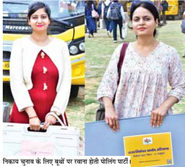
निकाय चुनाव के लिए बूथों पर रवाना होती पोलिंग पार्टी।