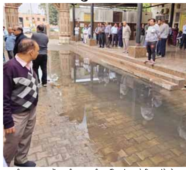
मदनपुरी शमशान घाट में भरा सीवर का पानी व अंतिम संस्कार के लिए पहुंचे लोग।