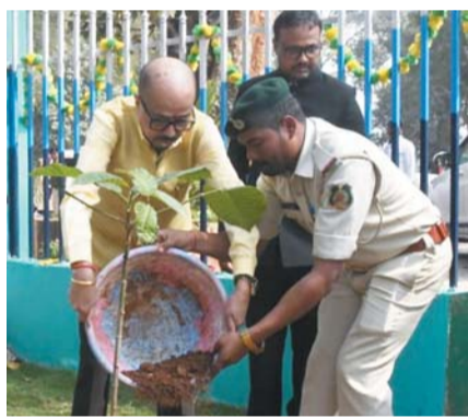
दत्तेवाड़ा। राज्यपाल ने वन मंदिर वाटिका में 'एक पेड़ माँ के नाम' के तहत कदम का पौधा रोपा, वन मंदिर