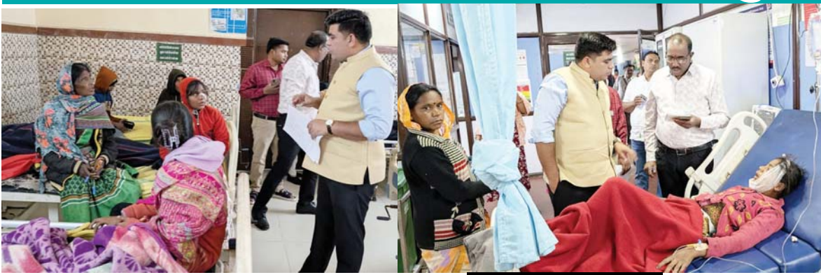
पायनियर संवाददाता कोण्डगांव www.dailypioneer.com

कोण्डगांव नगर के चिखलपुट्टी मार्ग के नया बस्टेण्ड पास एक दर्दनाक सड़क हादसा हुआ है। जिसमें बस चालक और एक शिक्षक की मौत हो गई और 30 छात्र घायल हो गए। यह बस एजुकेशनल टूर से लौट रही स्कूली बच्चों से भरी बस और टुक की नगर भीषण टकराव हो गई। हादसा नेशनल हाइवे 30 पर कोण्डगांव सिटी कोतवाली क्षेत्र के ग्राम चिखलपुटी में नया बस स्टैंड के सामने सोमवार सुबह