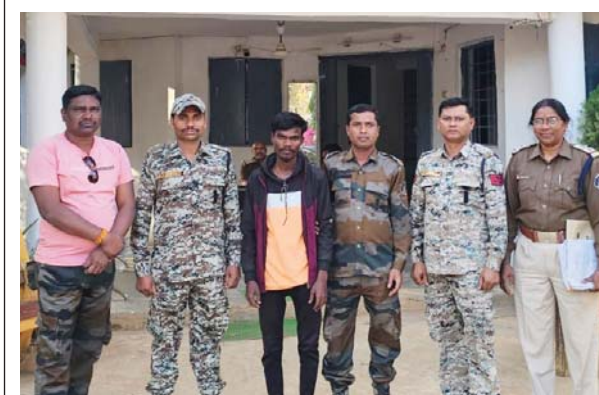
पायनियर संवाददाता भद्रप्रतापपुर www.dailypioneer.com