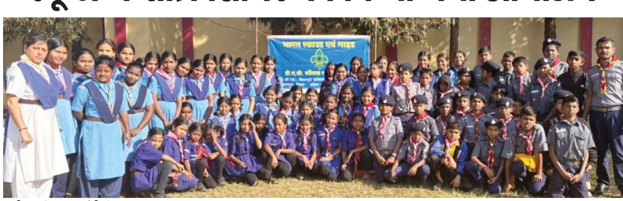
पायनियर संवाददाता किरंदुल www.dailypioneer.com

किरंदुल स्थित डीएवी पब्लिक स्कूल में स्काउट - गाइड व रेंजर इकाई द्वारा एक रात्रि शिविर का आयोजन दिनांक 18 जनवरी से 19 जनवरी तक किया