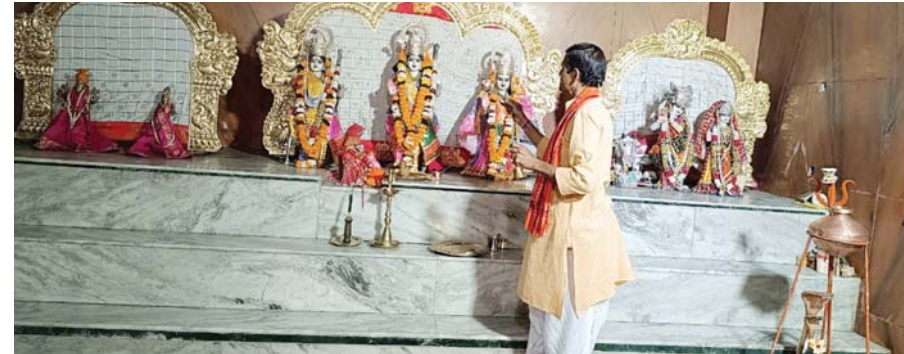
पायनियर संवाददाता किरंदुल www.dailypioneer.com

नगर की सुख शांति समृद्धि एवं मंगलकामनाओं के उद्देश्य से विगत वर्ष से लगातार प्रत्येक मंगलवार को श्री रामचरितमानस सूर्यरकांड का सामूहिक पाठ, श्री राघव मंदिर