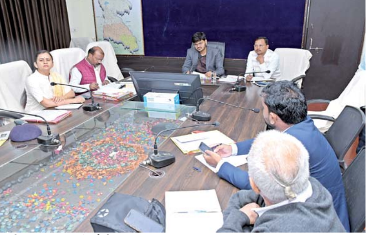
पायनियर संवाददाता < सुगेली www.dailypioneer.com