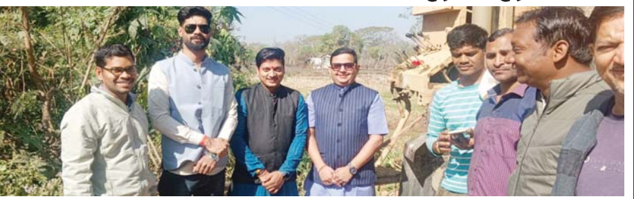
पायनियर संवादकर्ता < बसना www.dailypioneer.com