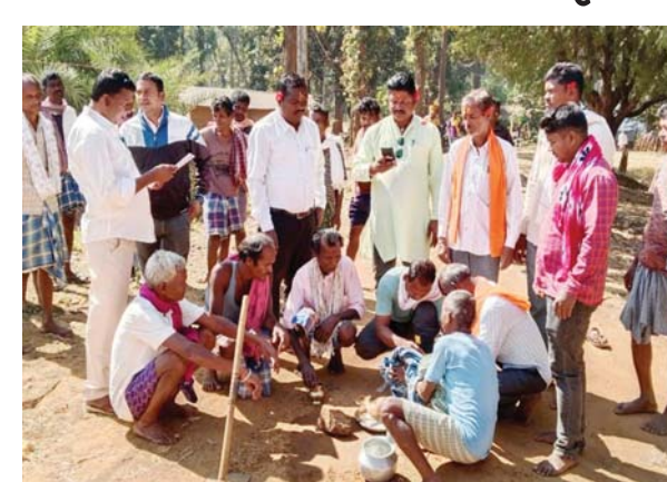
पायनियर संवाददाता कोण्डगांव www.dailypioneer.com