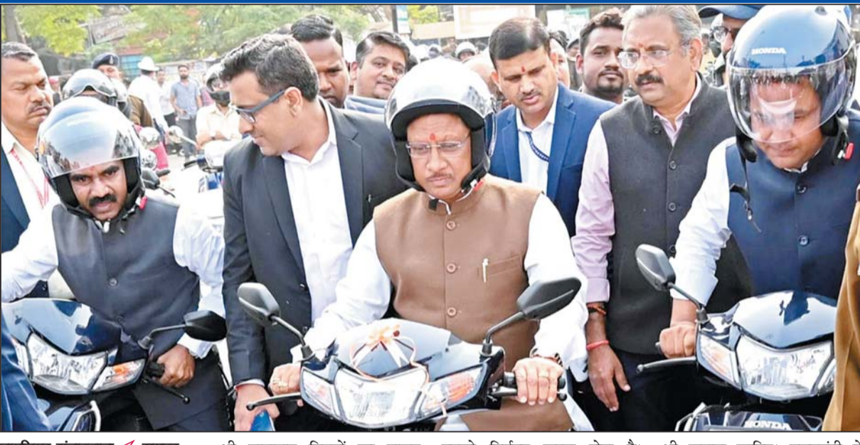
पायनियर संवाददाता < रायपुर