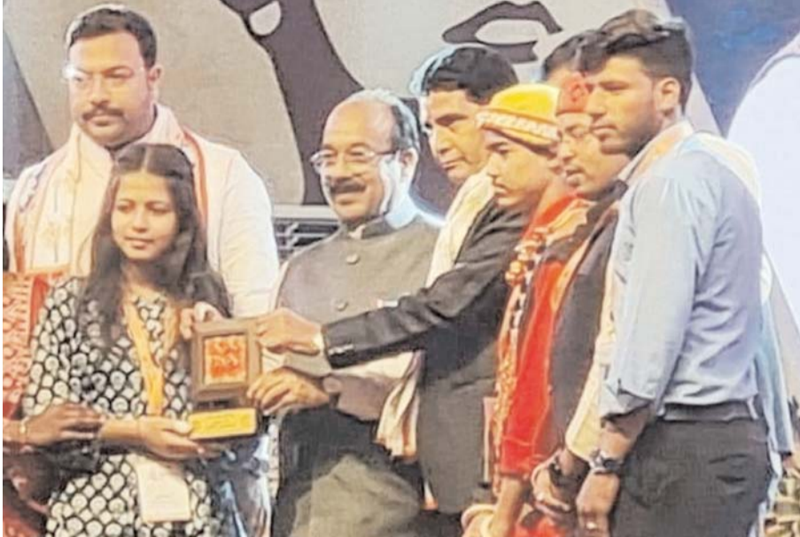
पटेल एवं गुप ब्लॉक पलारी को विषय कृषि उत्पाद पर मिला। प्राची

पायनियर संवाददाता < बलौदाबाजार www.dailypioneer.com