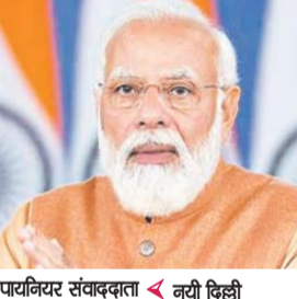
पायनियर संवाददाता < नयी दिल्ली