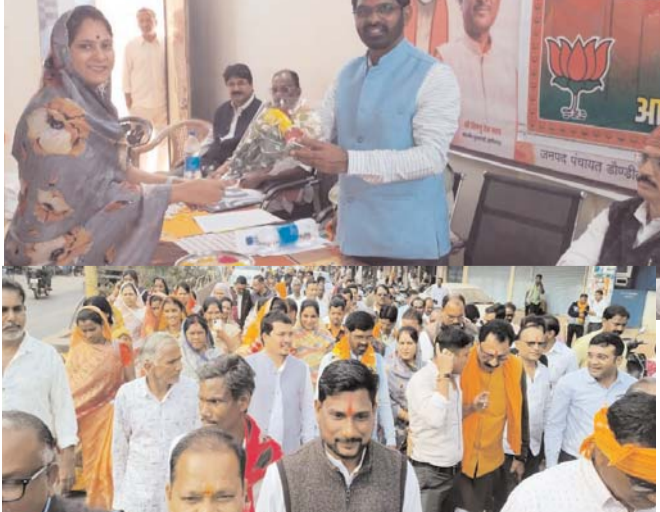
पायनियर संवाददाता < बालोद www.dailypioneer.com

नगरीय निकाय चुनावों को लेकर भाजपा संगठन के द्वारा बालोद जिले के 2 नगर पालिका व सभी नगर पंचायतों में चुनाव के दृष्टिकोण से कार्यकर्ताओं के लिए कार्यशाला का आयोजन किया जा रहा है। इसी क्रम में बुधवार को जिले के डौंडीलोहारा नगर के पुराने जनपद कार्यालय भवन में भाजपा जिला अध्यक्ष