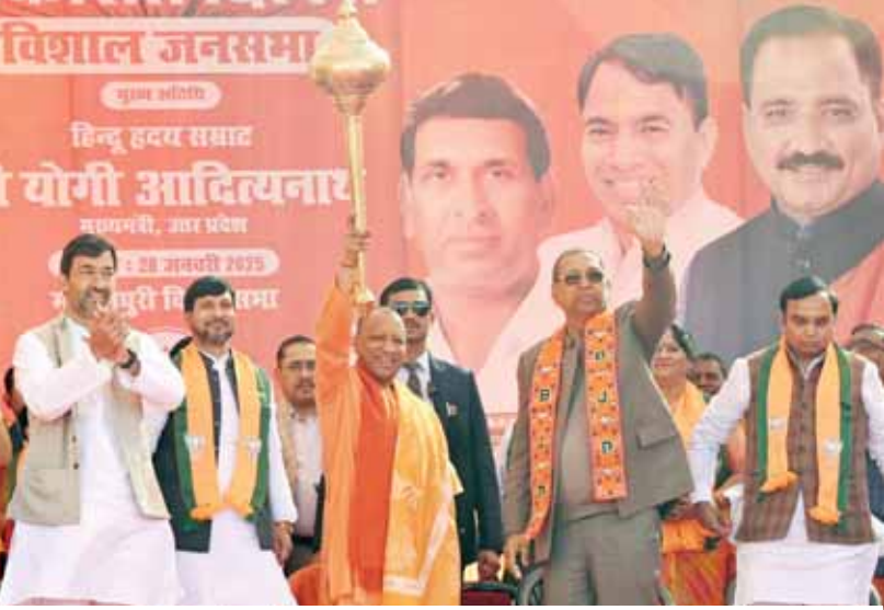
मंगोलपुरी में एक चुनावी सभा के दौरान योगी के मुख्यमंत्री योगी आदित्यनाथ गदा उठाते हुए।