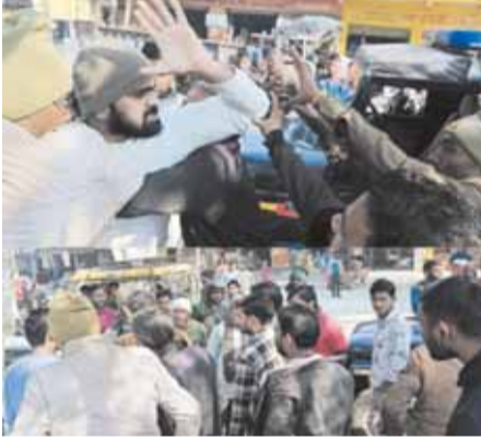
दीवान के साथ अमद्रता करता लिपिक एवं मौके पर मौजूद गौड़

गुरुसहायगंज, कन्नौज। बैंकों की सुरक्षा में पुलिस के जवान नियमित दौरा कर न सिर्फचोर उचकों से रक्षा करते हैं बल्कि समाज के सुरक्षा की जिम्मेदारी भी उन्हीं के कंधों पर है। लेकिन कितना अजीब लगता है जब कोई बैंक कर्मी उनसे ही अभद्रता करने से भी नहीं चूकता है। ऐसा ही एक मामला बैंक ऑफ बड़ौदा की स्थानीय शाखा के बाहर उस समय देखने को मिला जब बैंक के एक बाबू ने पुलिस एक्सट्रा मोबाईल की गाड़ी पर तैनात सुरक्षा कर्मियों से अभद्रता कर दी। नगर व क्षेत्र में बैंकों की सुरक्षा में तैनात पुलिस एक्सट्रा मोबाईल की गाड़ी के जवानों के साथ बैंक ऑफ बड़ौदा के एक बाबू ने मंगलवार को किसी बात को लेकर गाली गलौज कर हाथापाई शुरू कर दी। जिससे बैंक कर्मियों सहित आसपास के नागरिकों के बीच हड़कंध मच गया। भारी संख्या में मौके पर भीड़ एकत्र हो गई। लोगों के बीच बचाव के दौरान उस दवंग बाबू द्वारा एक दो बार नहीं बल्कि तीन बार पुलिस एक्सट्रा मोबाईल के दीवान एवं सुरक्षा कर्मियों से अभद्रता की गई। मामला बढ़ता देख बैंक के कर्मचारियों के साथ शाखा प्रबंधक भी मौके पर