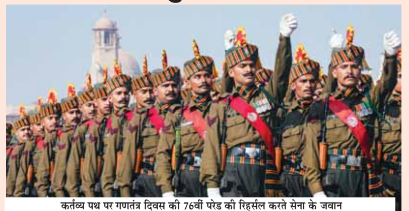
कर्तव्य पथ पर गणतंत्र दिवस की 76वीं परेड की रिहर्सल करते सेना के जवान

आईएनएस नीलगिरि परियोजना 17ए स्टील्थ फ्रिगेट श्रेणी का शीर्ष जहाज है जो शिवालिक श्रेणी के युद्धपोतों में महत्वपूर्ण उन्नयन को दर्शाता है। भारतीय नौसेना के वारिंगियर डिजाइन ब्यूरो द्वारा डिजाइन किए गए और मद्रास में डॉक शिपबिल्डर्स लिमिटेड (एमडीएल) में निर्मित आईएनएस नीलगिरि में उन्नत विशेषताएं हैं। यह आधुनिक विमानन सुविधाओं से परिपूर्ण है तथा एमएच-60 आर समेत विभिन्न प्रकार के हेलीकॉप्टर का परिवहन कर सकता है। परियोजना 15 वीं स्टील्थ विध्वंसक श्रेणी का चौथा और