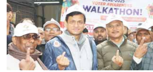
सादतपुर, दयालपुर मौजपुर एवं भजनपुरा के मुख्य मार्ग से होते हुए पदयात्रा का बाजार के मेन चौक पर समाप्त हुई। इस दौरान डीएम ने कहा, लोकतंत्र को मजबूत बनाने के लिए हर नागरिक का कर्तव्य है कि वह अपने मतदाधिकार का प्रयोग करें।