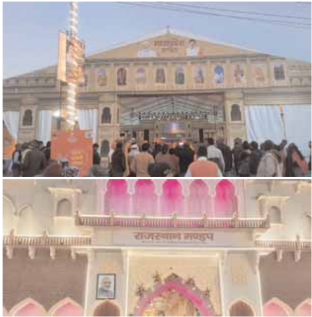
कला, साहित्य और सांस्कृतिक समृद्धि का संगम

दादरनागर हवेली नागालैंड, लेह, छत्तीसगढ़, गुजरात, एमपी, आंध्र प्रदेश, उत्तराखंड और राजस्थान की संस्कृति का यूपी में हो रहा संगम महाकुंभ नगर। महाकुंभ के कैनवास पर देश भर की सांस्कृतिक विविधता का रंग चढ़ चुका है। संगम की रेत पर विभिन्न राज्यों के 12 शासदार पवेलियन सजकर तैयार हो गए हैं। उत्तर प्रदेश का महाकुंभ नगर देश का केंद्र बन गया है। मुख्यमंत्री योगी आदित्यनाथ की ओर से देश विदेश में जाकर मंत्रियों ने खुद निमंत्रण बांटे हैं। जिसका बड़ा व्यापक असर देखने को मिल रहा है। योगी सरकार के ऐतिहासिक प्रयास से एक जगह पर ही एक साथ सभी राज्यों की सांस्कृतिक समृद्धि साफ देखी जा सकती है। सेक्टर सात यहां नागालैंड का चांगलो लेह का शॉडोल लोक नृत्य समेत दादरा नगर हवेली छत्तीसगढ़ गुजरात एमपी आंध्र प्रदेश उत्तराखंड और राजस्थान की संस्कृति का संगम देखने को मिलेगा। मध्य प्रदेश का पवेलियन इस बार जनजातीय भोगोरिया नृत्य की आकर्षक प्रस्तुतियों के साथ दर्शकों को मंत्रमुग्ध कर रहा है। यह नृत्य आदिवासी समुदायों की होली से पूर्व मनाए जाने वाले भोगोरिया उत्सव का हिस्सा है। जिसमें रंग बिरंगे परिधान ढोल मजोरों की गूंज और युवाओं का