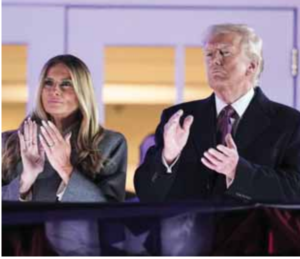
वर्जीनिया के स्टर्लिंग में 60वें राष्ट्रपति पद के शपथ ग्रहण समारोह से पहले डोनाल्ड ट्रंप और मेलानिया ट्रंप।

ट्रंप द्वारा चार साल तक देश की राजधानी को अपमानित करने और अपने उत्तराधिकारी के शपथ ग्रहण समारोह में शामिल नहीं होने के बाद यह एक उल्लेखनीय बदलाव है। ट्रंप ने चर्च 2024 के जीओपी राष्ट्रपति पद के प्राथमिक चुनाव में धमाकेदार जीत हासिल की और नवंबर के चुनाव में जीत हासिल की, जो वर्ष 2012 में डेमोक्रेट बराक ओबामा के फिर से चुने जाने के बाद से नहीं देखा गया था। फिर भी उस आरामदायक जीत और कांग्रेस पर उनकी पार्टी के पूर्ण