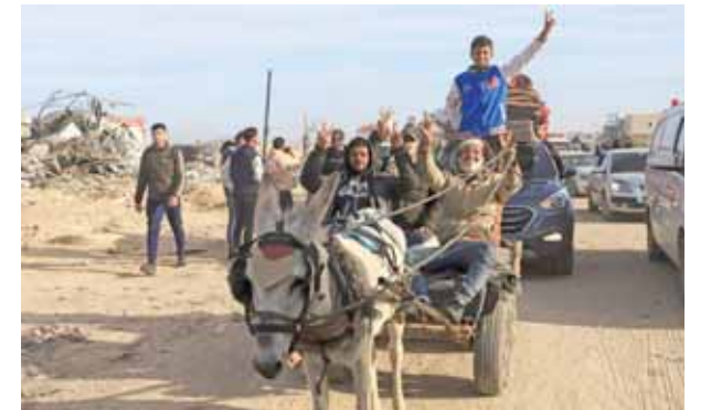
राफा, गाजा पट्टी में इजराइल और हमास के बीच युद्ध विराम समझौते के प्रगामी होने के दौरान विस्थापित फिलिस्तीनी राफा लौटते सनय जीत की खुशी दिखाते हुए।

सबसे पहले रेड क्रॉस काफिले ने गाजा में तीन महिला इजराइली बंधकों को अपने सुरक्षा में लिया। युद्ध विराम के प्रभाव होने से पहले ही पूरे क्षेत्र में जश्न मनाया जाने लगा और कुछ फिलिस्तीनी अपने घरों को लौटने लगे। इस बीच, इजराइल ने 90 फिलिस्तीनी कैदियों को योजनाबद्ध रिहाई के बदले में रिविवा को बाद में घर लौटने वाले पहले तीन बंधकों के नामों की घोषणा की। स्थानीय समाचारपत्र सुबह 11.15 बजे शुरू हुआ यह युद्ध विराम को समाप्त करने और 7 अक्टूबर, 2023 को हमास के हमले में अपहृत लगभग 100 बंधकों को वापस लाने की दिशा में पहला कदम है। एक इजराइली अधिकारी ने पुष्टि की कि रोमी गौनेन, एमिली दमारी, और डोरोन स्टीनब्रेचर को रिविवा को बाद में रिहा किया जाना था। गौनेन को नौवा सगिता समारोह से अगवा किया गया था,