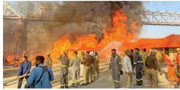
महाकुंभ के दौरान एक शिविर में आग लगने के बाद निकलता हुआ धुआं।