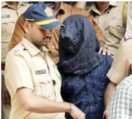
बॉलीवुड अभिनेता सैफ अली खान पर कथित हमले के सिलसिले में गिरफ्तार किए गए आरोपी को मुंबई में अदालत में पेश करने से पहले गैरकानूनी जांच के लिए अस्पताल ले जाते पुलिस कर्मी।