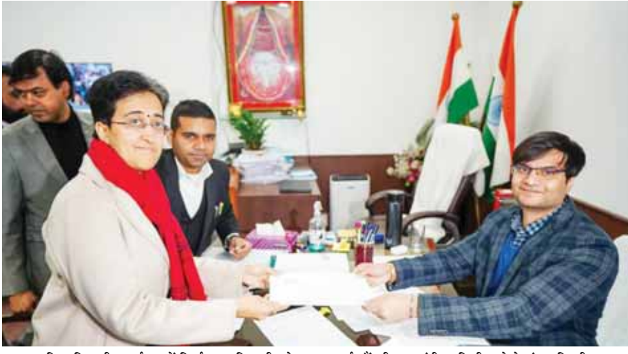
जिलाधिकारी कार्यालय में निर्वाचन अधिकारी को अपना पर्चा सौंपती मुख्यमंत्री आतिशी।

नामांकन पत्र दाखिल करने के बाद मीडिया से बातचीत में आतिशी ने कहा कि वह आप प्रमुख अरविंद केजरीवाल की ईमानदारी की राजनीति को आगे बढ़ाने के संकल्प के साथ कालकाजी से अपना नामांकन दाखिल किया। पिछले पांच वर्षों में कालकाजी के बुजुर्गों, महिलाओं और बच्चों से बहुत स्नेह और समर्थन मिला है। उसी विस चुनाव में भी यहां के लोगों का आशीर्वाद मिलेगा। कांग्रेस नेता राहुल गांधी द्वारा अरविंद केजरीवाल पर दिए गए बयान को लेकर आतिशी ने कहा, यह सोचने वाली बात है कि ऐसा कैसे होता है कि जब कांग्रेस के प्रत्याशी संदीप दीक्षित केजरीवाल के खिलाफ शिकायत करने के लिए एलजी के पास जाते हैं, तो उन्हें तुरंत समय दे दिया जाता है। उनकी शिकायत स्वीकार कर ली जाती है। तुरंत कार्रवाई होती है और उस पर एफआईआर दर्ज होती है। जबकि विधायकों को अपने इलाके के काम के लिए एलजी से मिलने के लिए कई दिनों तक इंतजार करना पड़ता है। आतिशी का मुकामला भाजपा के