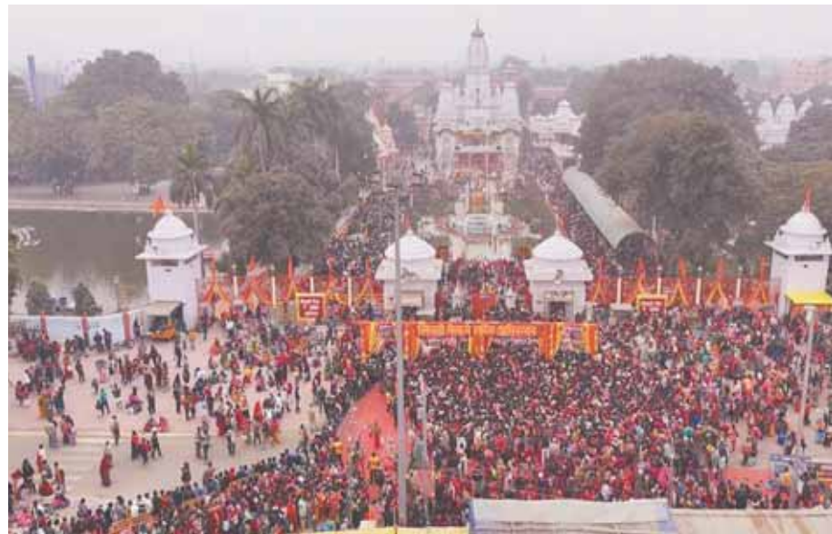
पायनियर समाचार सेवा। लखनऊ/गोरखपुर