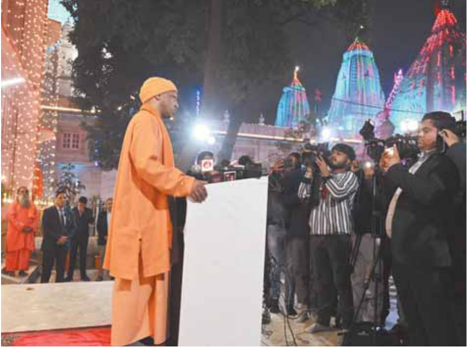
पायनियर समाचार सेवा। लखनऊ/गोरखपुर