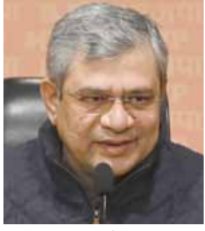
(बाएं से दाएं) अश्विनी वैष्णव; जून 2024 में शाय बहाना करते प्रधानमंत्री नरेंद्र मोदी तथा मार्क जुकरबर्ग