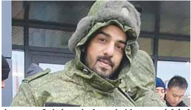
मोहनगढ़ असाफल पिछले वर्ष रूस-यूक्रेन सीमा पर गांठें गांठें। वह सुरक्षा गार्ड की नौकरी के लिए रूस गए थे लेकिन उन्हें युद्ध क्षेत्र में भेज दिया गया था। (फाइल फोटो)