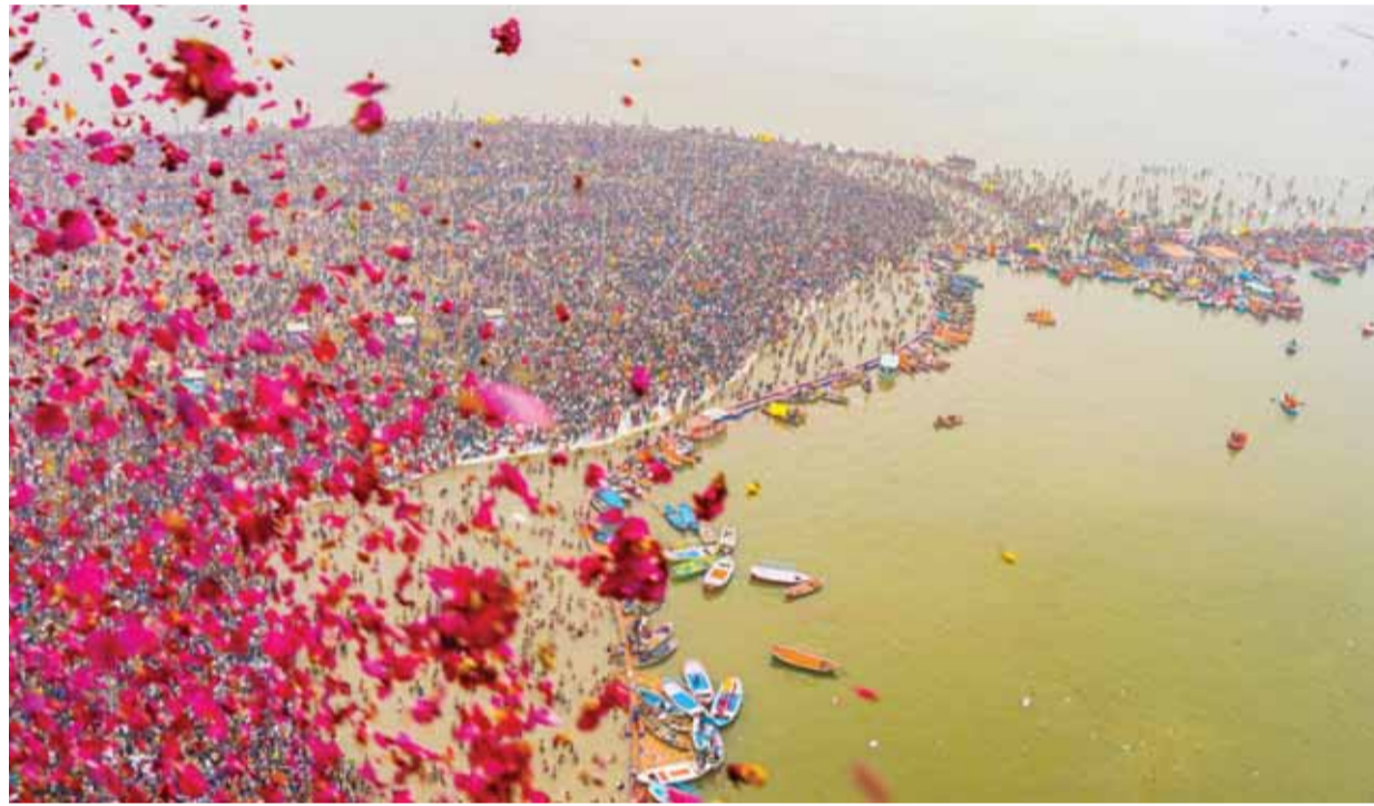
महाकुंभ मेला 2025 के दौरान 'मकर संक्रांति' के अवसर पर संगम में पवित्र स्नान करने के लिए एकत्रित हुए श्रद्धालुओं पर पुष्प वर्षा की गई।