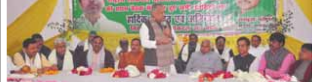
पायनियर समाचार सेवा। लखनऊ

राष्ट्रीय लोकदल के प्रदेश कार्यालय में 'प्रोफेशनल मंच की बैठक मंगलवार को प्रदेश कार्यालय में आयोजित की गयी। बैठक में मुख्य अतिथि राष्ट्रीय लोकदल के राष्ट्रीय महासचिव संगठन त्रिलोक त्यागी तथा विशिष्ट अतिथि प्रदेश अध्यक्ष रामाशीष राय मौजूद रहे। बैठक की सम्बोधित करते हुये राष्ट्रीय लोकदल के राष्ट्रीय महासचिव संगठन त्रिलोक त्यागी ने कहा कि किसी भी पार्टी की राजनीतिक ताकत तभी मजबूत होती है जब उसका संगठन मजबूत होता है। इसी क्रम में उन्होंने पार्टी के संगठन में अधिक से अधिक लोगों को जोड़ने