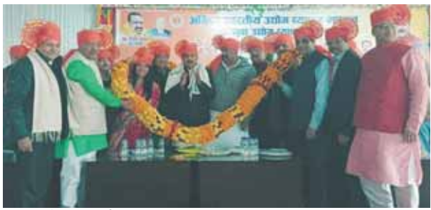
प्रदेश कार्यसमिति की बैठक में उपस्थित अतिथि एवं अधिकारी।

● अ.भा. उद्योग व्यापार मंडल की बैठक में राष्ट्रीय अध्यक्ष संदीप बंसल व प्रदेश अध्यक्ष रिपन कंसल की हुई घोषणा