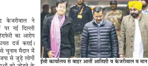
ईसी कार्यालय से बाहर आती अतिथि व केजरीवाल व मान

दिल्ली के पूर्व मुख्यमंत्री इन कथित गड़बड़ियों के खिलाफ शिकायत दर्ज कराने के लिए बृहस्पतिवार को निर्वाचन आयोग पहुंचे। केजरीवाल ने आयोग के अधिकारियों से मिलने के बाद मीडिया से कहा कि पिछले 22 दिनों में नई दिल्ली निर्वाचन क्षेत्र में मतदाताओं के नाम