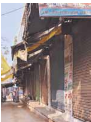
समथन में बंद पड़ी दुकानें।