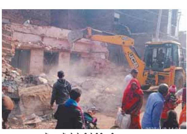
जगममनपुर बाजार में मकानों को तोड़ती जेलीबी मशीन।

● एट से भीखेपुर तक सात मीटर चौड़ा स्टेट हाइवे का चल रहा निर्माण ● सात मीटर चौड़ी बनेगी सड़क और दो-दो मीटर सड़क के किनारे रखी जायेगी जमीन ● वर्ष 1952 में जगममनपुर रियासत का भारत देश में हुआ था विलय ● नवीन दुकानों के निर्माण से जगममनपुर बाजार की खोई हुई रौनक वापस आ जाएगी