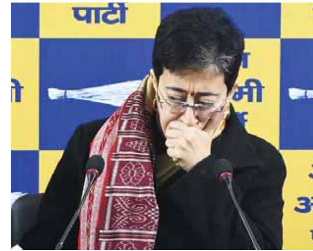
प्रेसवार्ता के दौरान सीएम आतिशी भाजपा के नेता रमेश बिधूड़ी द्वारा उनके खिलाफ की गई टिप्पणी से आहत हो गईं और उनकी आंखें नम हो गईं।