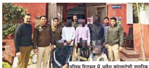
पुलिस हिरासत में अवैध बांग्लादेशी नागरिक।