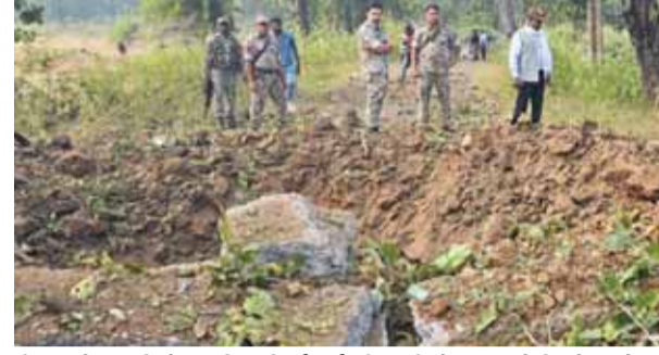
बीजापुर में नक्सलियों द्वारा गिला रिजर्व गार्ड (डीआरजी) के वाहन को विस्फोटक से उड़ा देने के कारण आठ जवानों और एक नागरिक चालक की मौत की मौत हो गई।

जिले के जिला रिजर्व गार्ड (डीआरजी) के जवान नक्सल विरोधी अभियान के बाद अपनी एसयूवी कार से लौट रहे थे। अधिकारी ने बताया कि सभी आठ डीआरजी जवानों और वाहन चालक की मौके पर ही मौत हो गई। डीआरजी राज्य पुलिस की एक इकाई है और इसमें ज्यादातर स्थानीय आदिवासियों और आत्मसमर्पण करने वाले नक्सलियों को भर्ती किया जाता है। आईजी ने बताया कि घटनास्थल पर अतिरिक्त बल भेजा गया है और शवों को बाहर निकाला जा रहा है। सुंदरराज ने बताया कि सुरक्षा बलों ने इलाके में तलाशी अभियान शुरू किया है। आईजी ने कहा कि ए डीआरजी जवान नागयणपुर, दंतेवाड़ा और