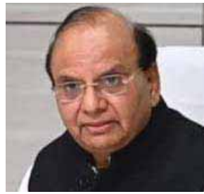
पायनियर समाचार सेवा। नई दिल्ली

● आप सरकार के 6 वर्षों के विलंब से बनाए गए इन नियमों से, असहाय लोगों को धोखाड़ी वाली योजनाओं से बचाया जा सकेगा