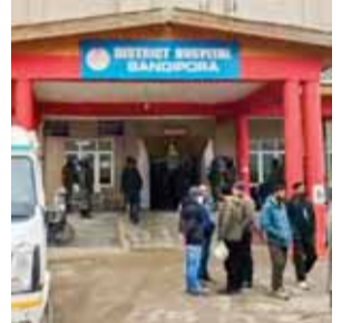
बादीपोरा जिले में सेना के एक वाहन के खाई में गिरने के बाद घायल सेना के जवानों का शिला अस्पताल में भर्ती कराया गया।

हस्ताक्षर करने के बाद से एनएससीएन-आईएम के साथ राजनीतिक वार्ता कर रहा है और 2015 में 'फेमवर्क' समझौते पर भी हस्ताक्षर किए। इसने नगा राष्ट्रीय राजनीतिक समूहों (डब्ल्यूसी एनएनपीजी) की कार्य समिति के साथ समानांतर वार्ता में भी प्रवेश किया। 2017 में कम से कम सात नगा गुटों से बना। उन्होंने नवंबर 2017 में सहमत स्थिति पर हस्ताक्षर किए। तत्कालीन वार्ताकार और नगालैंड के राज्यपाल आरएन रवि द्वारा केंद्र और नगा (शेष पृष्ठ 9)