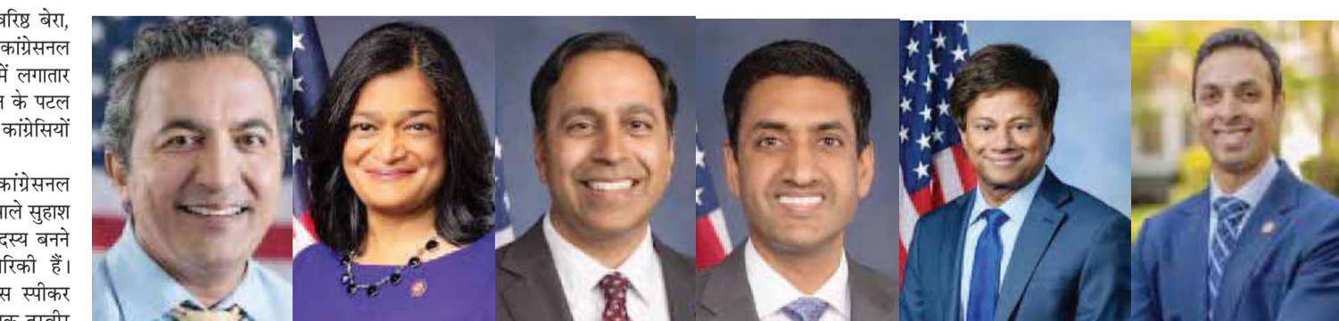
(बाएं से दाएं) अमी बेरा, प्रमिला जयपाल, राजा कृष्णमूर्ति, रो खन्ना, श्रीयानेदार और सुहास सुब्रमण्यम।

उत्साहित हूँ!' इनमें से सबसे वरिष्ठ बेरा, जिन्होंने कैलिफोर्निया के सातवें कांग्रेसनल डिस्ट्रिक्ट के प्रतिनिधि के रूप में लगातार सातवां बार शपथ ली है, ने सदन के पटल से सभी छह भारतीय अमेरिकी कांग्रेसियों की एक तस्वीर भी पोस्ट की। वर्जीनिया के 10वें कांग्रेसनल डिस्ट्रिक्ट का प्रतिनिधित्व करने वाले सुहाश सुब्रमण्यम प्रतिनिधि सभा के सदस्य बनने पर एक पोस्ट में कहा, 'भारतीय अमेरिकी हैं। उन्होंने अपने परिवार और हाउस स्पीकर माइक जोर्जानस के साथ अपनी एक तस्वीर पोस्ट करते हुए कहा, काम का पहला दिन! 119वीं कांग्रेस में शपथ लेने पर सम्मानित महसूस कर रहा हूँ, और वीए10 के लिए परिणाम देने के लिए काम करने के लिए उत्साहित हूँ।' मिशिगन के 13वें