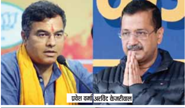
प्रवेश वर्मा अरविंद केजरीवाल

दिल्ली विधानसभा चुनाव की घोषणा होने में एक सप्ताह से भी कम समय बचा है, भाजपा ने 29 उम्मीदवारों की अपनी पहली सूची जारी की है, जिसमें चार मौजूदा विधायकों, दो पूर्व सांसदों और आठ पूर्व विधायकों को टिकट दिया गया है। भाजपा की पहली सूची में आठ प्रमुख नेताओं के नाम शामिल हैं जो हाल के महीनों में कांग्रेस और आप से अलग हो गए हैं। पश्चिमी दिल्ली के पूर्व सांसद प्रवेश साहिब सिंह वर्मा नई दिल्ली विधानसभा क्षेत्र में आप प्रमुख अरविंद केजरीवाल के खिलाफ चुनाव लड़ेंगे। नई दिल्ली सीट, जो 2013 से केजरीवाल के कब्जे में है, पूर्व मुख्यमंत्री को दो अन्य पूर्व मुख्यमंत्रियों के बेटों से मुकाबला करते हुए देखेंगे। वर्मा साहिब सिंह वर्मा के बेटे हैं, जिनका 1990 के दशक में मुख्यमंत्री के रूप में दो साल का कार्यकाल था। पश्चिमी दिल्ली के पूर्व सांसद वर्मा ने आधिकारिक उम्मीदवार घोषित होने से पहले ही इस सीट से चुनाव लड़ने की तैयारी शुरू कर दी थी और कहा था कि उन्हें राष्ट्रीय नेताओं ने हरी झंडी दे दी है। इस सीट से कांग्रेस उम्मीदवार तीन बार मुख्यमंत्री रही शीला दीक्षित के