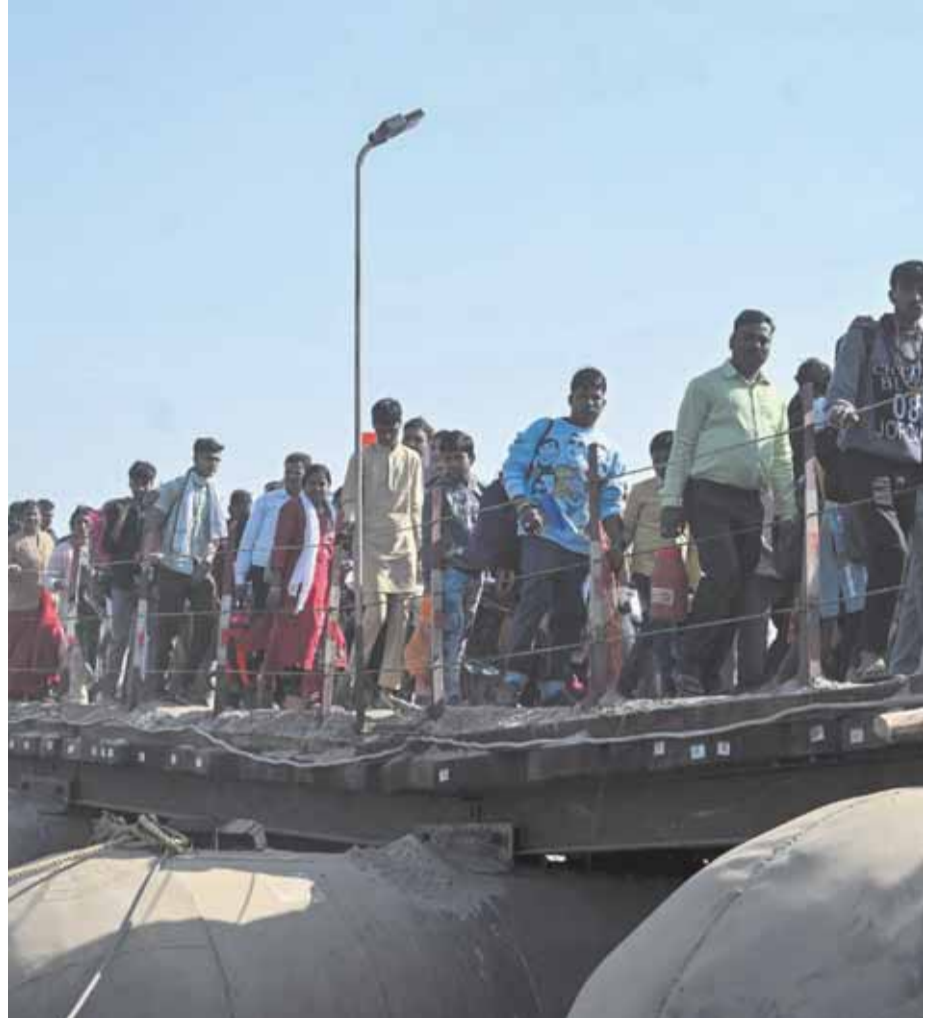
प्रयागराज। महाकुंभ में स्नान के लिए जाते श्रद्धालु