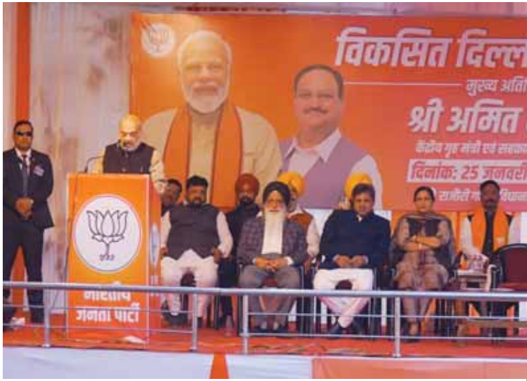
राजौरी गार्डन विधानसभा सीट से भाजपा प्रत्याशी के लिए चुनाव प्रचार करते गृहमंत्री अमित शाह।

शाह पांच फरवरी को होने वाले दिल्ली विधानसभा चुनाव के लिए शहर में भाजपा की एक जनसभा को संबोधित कर रहे थे। उन्होंने आप के इस दावे को लेकर भी उस पर हमला