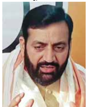
मुख्यमंत्री ने बताया कि हरियाणा को 2030 तक प्रदूषण मुक्त बनाने का लक्ष्य तय किया गया है। जिसके लिए यह योजना बनाई गई है। इस योजना को लागू करने के लिए विश्व बैंक से दो हजार 498 करोड़ का लोन लिया जाएगा। एक हजार 66 करोड़ रुपये को सरकार द्वारा दिए जाएंगे। पहले चरण में आज 83 करोड़ रुपये की धनराशि जारी करने का निर्णय लिया गया है। उन्होंने बताया कि छह साल में कई चरणों में इस योजना को लागू करने के लिए 11 विभागों की एक संयुक्त कमेटी का गठन किया जाएगा। जिसमें हवा प्रबंधन, प्रदूषण नियंत्रण, पराली प्रबंधन जैसे कई मामलों को शामिल किया गया है।

मुख्यमंत्री ने बैठक के बाद बताया कि बृहस्पतिवार की बैठक में हरियाणा को प्रदूषण मुक्त करने के लिए हरियाणा क्लीन एयर प्रोजेक्ट की डीपीआर को मंजूरी प्रदान की गई है। इस योजना पर चरणबद्ध तरीके से तीन हजार 647 करोड़ रुपये खर्च होंगे। यह योजना प्रदेश में वर्ल्ड बैंक की मदद से चलाई जाएगी। यह परियोजना राज्य में वायु गुणवत्ता प्रबंधन प्रणालियों को मजबूत करने में सहायता करेगी, साथ ही भारत