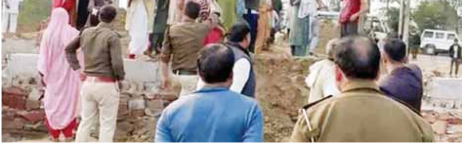
जिला के खंड पुनहाना में अवैध निर्माण गिराने गई टीम के साथ हाथापाई करती महिलाएं।

जिला के खंड पुनहाना में अवैध कालोनियों में निर्माणों को गिराने गई डीटीपी की टीम पर महिलाओं ने पथराव कर दिया। इस पथराव में जेसीबी मशीनों में भी तोड़फोड़ की गई। साथ ही मौके पर ड्यूटी मजिस्ट्रेट के साथ महिलाओं ने हाथापाई की। पुलिस ने इस उपद्रव में एक महिला को गिरफ्तार किया।