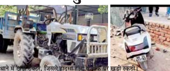
शाने में खड़े ट्रैक्टर, जिससे हादसा हुआ, सड़क पर खड़ी स्कूटी