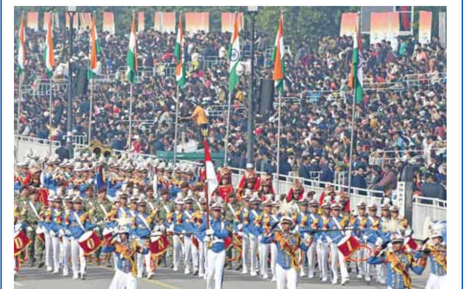
इंडोनेशियाई दल का बैड नई दिल्ली में कर्तव्य पथ पर गणतंत्र दिवस परेड के लिए हिरसल के दौरान मार्च करते हुए।