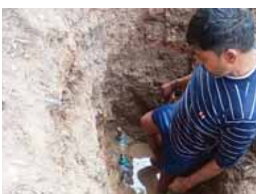
पाइप में लीकेज सही करता हुआ कर्मचारी

फरीदाबाद। बल्लभगढ़ के अंबेडकर चौक के आसपास के क्षेत्र भीकम कालोनी और नाहर सिंह कालोनी में पिछले कुछ समय से गंदे पानी की आपूर्ति की समस्या लोग परेशान थे। पाइप में लीकेज होने और बड़ी सीवर लाइनों के सफाई कार्य की वजह से लगभग 100 परिवार इस समस्या से परेशान थे स्थानीय लोगों ने निगम के अधिकारियों से शिकायत की और शिकायत पर तुरंत सुनवाई करते हुए पानी की पाइपलाइन को चेक कर लीकेज को सही कराया।