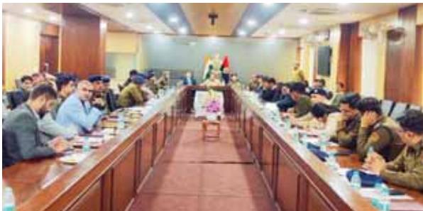
गुरुग्राम में जिला आपदा प्रबंधन कमेटी की बैठक में मौजूद अधिकारी।

पुलिस आयुक्त कार्यालय में गुरुवार को जिला आपदा प्रबंधन कमेटी की बैठक का आयोजन किया गया। इस बैठक की अध्यक्षता पुलिस आयुक्त विकास अरोड़ा ने की। इस दौरान उपायुक्त अजय कुमार सहित अन्य उच्च अधिकारी बैठक में उपस्थित रहे।