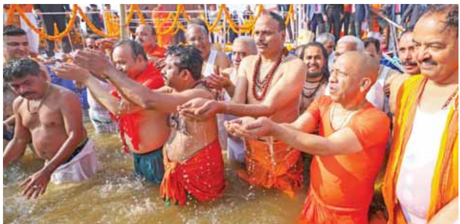
प्रयागराज में चल रहे महाकुंभ में पवित्र संगम में अपने वरिष्ठमंडल सहित उप के मुख्यमंत्री योगी आदित्यनाथ ने किया स्नान फरवरी को मेले का दौरा करने वाले हैं। आदित्यनाथ ने पहले राष्ट्रपति द्रौपदी मुर्मू, उपराष्ट्रपति जगदीप धनखड़, प्रधानमंत्री नरेंद्र मोदी और केंद्रीय गृह मंत्री अमित शाह सहित शीर्ष गणमान्य

प्रधानमंत्री नरेंद्र मोदी 5 फरवरी को प्रयागराज में चल रहे महाकुंभ मेले का दौरा करने वाले हैं। यह जानकारी सूत्रों से मिली है। इस भव्य आध्यात्मिक आयोजन में पहले ही लाखों श्रद्धालु शामिल हो चुके हैं और प्रधानमंत्री के दौरे से इस ऐतिहासिक समारोह की ओर और अधिक ध्यान आकर्षित होने को उम्मीद है। केंद्रीय गृह मंत्री अमित शाह 27 जनवरी को महाकुंभ मेले में भाग लेने वाले हैं। अपनी यात्रा के दौरान, शाह के संगम में पवित्र डुबकी लगाते, गंगा पूजा करते और आयोजन की देखरेख करने वाले अधिकारियों के साथ चर्चा करने की उम्मीद है। उपराष्ट्रपति जगदीप धनखड़ भी एक