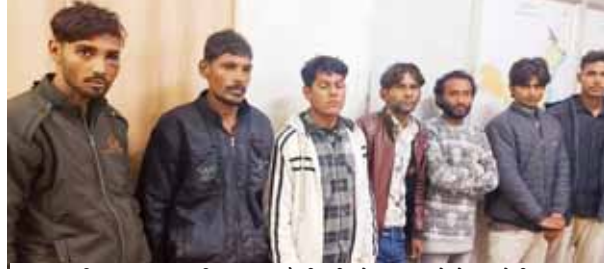
गुरुग्राम पुलिस द्वारा काबू किए गए डकैती की योजना बनाने के आरोपी।

स्थानीय पुलिस की सक्रियता ने एक कंपनी में अवैध हथियारबंद बदमाशों द्वारा की जाने वाली डकैती को योजना पर पानी फेर दिया। गुप्त सूचना के आधार पर पुलिस ने छापेमारी करके मौके से सात आरोपियों को काबू किया। पुलिस प्रवक्ता ने बुधवार को बताया कि आरोपियों के पास से अवैध हथियार भी बरामद किए गए हैं।