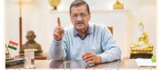
दिल्ली विधानसभा चुनाव से पहले घोषणाएं जारी करने के दौरान आप के राष्ट्रीय संयोजक अरविंद केजरीवाल ने भाषण दिया।