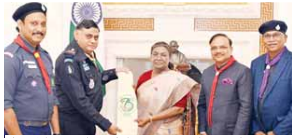
नई दिल्ली में राष्ट्रपति द्रौपदी मुर्मू को भारत स्काउट्स और गाइड्स के डायमंड जुबली जंबूरी के लिए दिया आमंत्रण देते डा. केके खंडेलवाल।

राष्ट्रपति द्रौपदी मुर्मू को डायमंड जुबली जंबूरी के लिए भारत स्काउट्स और गाइड्स एवं स्टेट चीफ कमिश्नर डा.केके खंडेलवाल ने मुख्य अतिथि के रूप में आमंत्रित किया। यह समारोह 28 जनवरी से 3 फरवरी 2025 तक तमिलनाडु के तिरुचिरापल्ली के मण्यपाराई स्थित एसआईपीसीओटी इंडस्ट्रियल पार्क में आयोजित किया जाएगा। डा. खंडेलवाल ने राष्ट्रपति से अनुरोध किया कि वे 28 जनवरी 2025 को शाम 4:00 बजे जंबूरी का उद्घाटन करें। या फिर 2 फरवरी, 2025 को शाम 4:00 बजे समापन समारोह में शामिल हों। उन्होंने कहा कि डायमंड जुबली जंबूरी भारत स्काउट्स और गाइड्स के 75