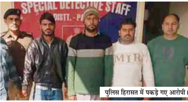
पुलिस हिरासत में पकड़े गए आरोपी।

जिला पुलिस की डिटेक्टिव टीम ने कंपनियों में दीवार तोड़कर चोरी करने वाले गिरोह का भंडाफोड़ कर तीन आरोपियों को गिरफ्तार किया है, जिन्होंने पलवल और फरीदाबाद में दस कंपनियों में चोरी की वारदातों को अंजाम दिया था। पुलिस ने आरोपियों से वारदात में इस्तेमाल की गई कार और चोरी के औजार भी बरामद किए हैं।