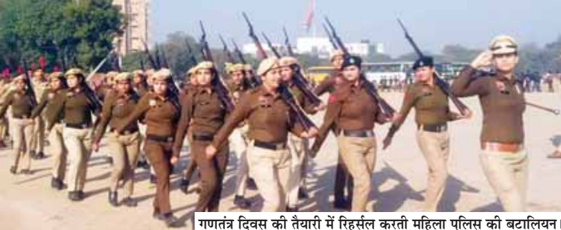
गणतंत्र दिवस की तैयारी में रिहर्सल करती महिला पुलिस की बटालियन।