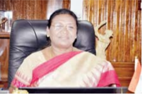
आंकड़ों का उपयोग करते थे। राष्ट्रपति ने कहा, सांख्यिकीय विशेषज्ञ शासन में पारदर्शिता और जवाबदेही लाने का एक उपकरण है। सांख्यिकी न केवल कुशल शासन की रीढ़ है, बल्कि सामाजिक-आर्थिक विकास का औजार भी है।

नई दिल्ली। राष्ट्रपति द्रौपदी मुर्मू ने मंगलवार को कहा कि सांख्यिकीय उपकरण और मात्रात्मक तकनीक नीतिगत निर्णयों के लिए अनुभवजन्य आधार प्रदान कर प्रभावी शासन में महत्वपूर्ण भूमिका निभाते हैं। भारतीय सांख्यिकी सेवा (आईएसएसए) के परिवीक्षाधीन अधिकारियों को संबोधित करते हुए कहा कि सरकारें स्वास्थ्य, शिक्षा, जनसंख्या आकार और रोजगार सहित अन्य क्षेत्र के आंकड़े एकत्र करने के लिए राष्ट्रीय सांख्यिकीय प्रणालियों पर निर्भर हैं। ए आंकड़े नीति-निर्माण का आधार होते हैं। आईएसएसए के 2024 बैच के परिवीक्षाधीन अधिकारियों ने मंगलवार को राष्ट्रपति भवन में राष्ट्रपति मुर्मू से मुलाकात की। मुर्मू ने कहा कि सांख्यिकी का उपयोग प्राचीन सभ्यताओं में भी किया जाता था, जब शासक करगणन उद्देश्यों के लिए बुनियादी जनगणना