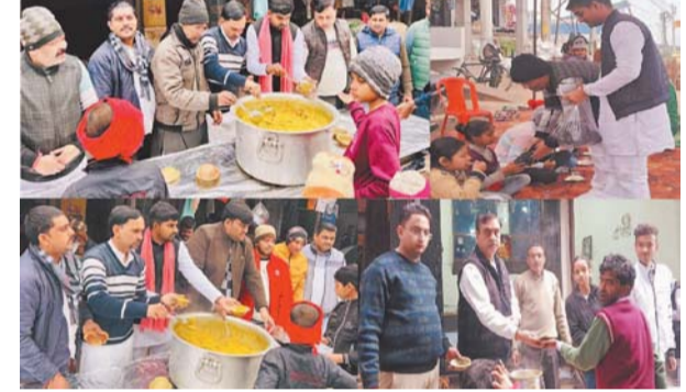
तिवांरोड, सखी गण्डी में खिचड़ी वितरित करते समाजसेवी व युवा।

गुरसहायगंज (कन्नौज)। दान के महापर्व मकर संक्रान्ति के अवसर पर नगर के विभिन्न धार्मिक व सार्वजनिक स्थलों पर श्रद्धालुओं व आयोजकों ने खिचड़ी भोज का आयोजन कर दान पुण्य किया। वही कई जगह विशाल खिचड़ी भोज के साथ-साथ घरों में कन्या भोज भी आयोजित किया गया। जिसमें सैकड़ों की संख्या में लोगों ने प्रसाद ग्रहण किया तो महिलाओं ने कन्याओं को दान कर पुण्य कमाया। मंगलवार को दान के पर्व मकर संक्रान्ति के उपलक्ष्य में जहां महिलाओं ने घरों में पूजा अर्चना कर कन्याओं, ब्राहमणों को खिचड़ी सहित अन्य समिधियों को दान किया। तो वही नगर के सर्विस रोड स्थित सती माता मंदिर, रेलवे रोड, चकोर गली, संतोषी माता मंदिर, तिवां रोड, जीटी रोड सहित