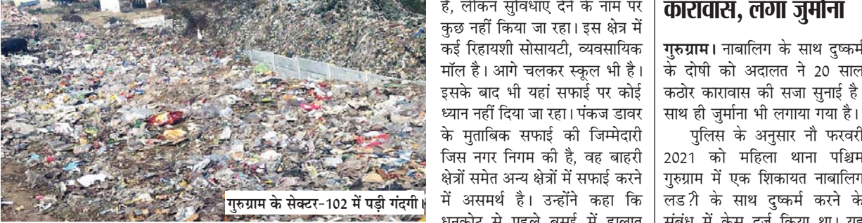
गुरुग्राम के सेक्टर-102 में पड़ी गंदगी।