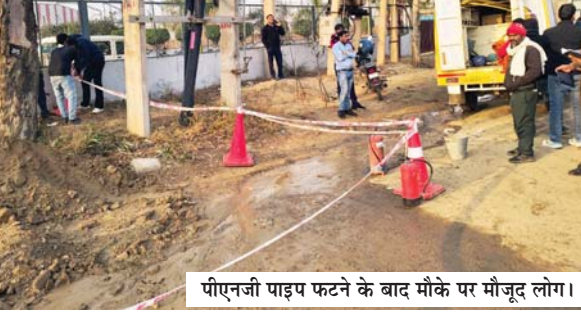
पीएनजी पाइप फटने के बाद मौके पर मौजूद लोग।

बघौला देवली मार्ग पर न्यू एलेनवरी कम्पनी के सामने जेसीबी से खुरदाई करते वक्त अचानक पीएनजी गैस पाइप लाइन फट गई। इससे तेज आवाज के साथ गैस का रिसाव शुरू हो गया। जिस स्थान पर गैस रिसाव शुरू हुआ, उसके समीप में ऊपर से हाईटेंशन लाइन गुजर रही थी, शुरु है गैस रिसाव की दिशा दूसरी ओर बदल जाने से बड़ा हादसा होने से टल गया। अन्यथा भारी तबाही मच सकती थी। सूचना मिलते ही पुलिस, फायरब्रिगेड व अदानी कम्पनी के अधिकारी भी मौके पर पहुंच गईं। खबर लिखे जाने तक टूटी लाइन को ठीक करने का काम चला हुआ है।