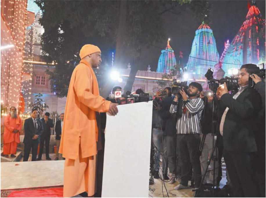
पायनियर समाचार सेवा। लखनऊ/गोरखपुर