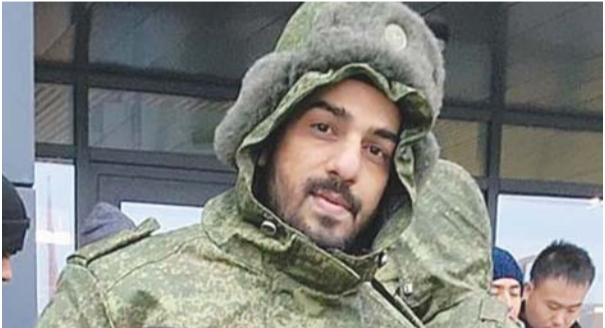
मोहनकंद असाफलन पिछले वर्ष रूस-यूक्रेन सीमा पर गाए गए थे। वह सुरक्षा गार्ड की नौकरी के लिए रूस गए थे लेकिन उन्हें युद्ध क्षेत्र में भेज दिया गया था। (फाइल फोटो)