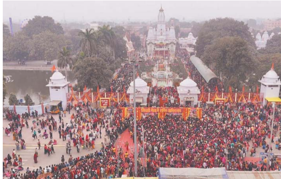
पायनियर समाचार सेवा। लखनऊ/गोरखपुर

मकर संक्राति के पुनीत पर्व पर 15 लाख से अधिक श्रद्धालुओं ने बाबा गोरखनाथ को खिचड़ी चढ़ाकर अपने और अपने प्रियजनों के लिए मंगलकामना की। मुख्यमंत्री योगी आदित्यनाथ ने सोशल मीडिया प्लेटफार्म एक्स पर एक पोस्ट लिखकर खिचड़ी पर्व के सफल आयोजन के लिए सबका आभार