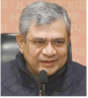
(बाएं से दाएं) अश्विनी वैष्णव; जून 2024 में शायब राहण करते प्रधानमंत्री नरेंद्र मोदी तथा मार्क जुकरबर्ग