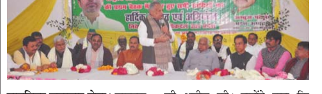
पायनियर समाचार सेवा। लखनऊ

राष्ट्रीय लोकदल के प्रदेश कार्यालय में 'प्रोफेशनल मंच की बैठक मंगलवार को प्रदेश कार्यालय में आयोजित की गयी। बैठक में मुख्य अतिथि राष्ट्रीय लोकदल के राष्ट्रीय महासचिव संगठन त्रिलोक त्यागी तथा विशिष्ट अतिथि प्रदेश अध्यक्ष रामाशीष राय मौजूद रहे। बैठक को सम्बोधित करते हुये राष्ट्रीय लोकदल के राष्ट्रीय महासचिव संगठन त्रिलोक त्यागी ने कहा कि किसी भी पार्टी को राजनैतिक ताकत तभी मजबूत होती है जब उसका संगठन मजबूत होता है। इसी क्रम में उन्होंने पार्टी के संगठन में अधिक से अधिक लोगों को जोड़ने