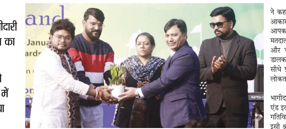
मतदान का दिन सप्ताह के मध्य में रखा है ताकि ज्यादा से ज्यादा लोग मतदान करें।

चुनाव आयोग चुनाव में कम मत प्रतिशत को लेकर चिंतित है। खासकर शहरी क्षेत्रों में मतदान के प्रति उदासीनता पर चिंता जाहिर की। इसके मद्देनजर आयोग ने राष्ट्रीय राजधानी में