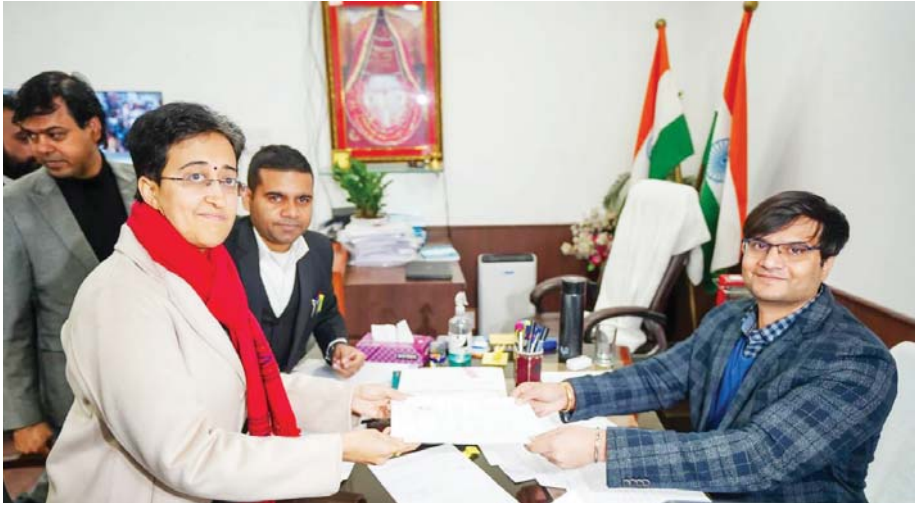
जिलाधिकारी कार्यालय में निर्वाचन अधिकारी को अपना पर्चा सौंपती मुख्यमंत्री आतिथी।

नामांकन पत्र दाखिल करने के बाद मीडिया से बातचीत में आतिथी ने कहा कि वह आप प्रमुख अरविंद केजरीवाल की ईमानदारी की राजनीति को आगे बढ़ाने के संकल्प के साथ कालकाजी से अपना नामांकन दाखिल किया। पिछले पांच वर्षों में कालकाजी के बुजुर्गों, महिलाओं और बच्चों से बहुत स्नेह और समर्थन मिला है। उसी विस चुनाव में भी यहां के लोगों का आशीर्वाद मिलेगा। कांग्रेस नेता राहुल गांधी द्वारा अरविंद केजरीवाल पर दिए गए बयान को लेकर आतिथी ने कहा, यह सोचने वाली बात है कि ऐसा कैसे होता है कि जब कांग्रेस के प्रत्याशी संदीप दीक्षित केजरीवाल के खिलाफ शिकायत करने के लिए एलजी के पास जाते हैं, तो उन्हें तुरंत समय दे दिया जाता है। उनकी शिकायत स्वीकार कर ली जाती है। तुरंत कार्रवाई होती है और उस पर एफआईआर दर्ज होती है। जबकि विधायकों को अपने इलाके के काम के लिए एलजी से मिलने के लिए कई दिनों तक इंतजार करना पड़ता है। आतिथी का मुकामबला भाजपा के