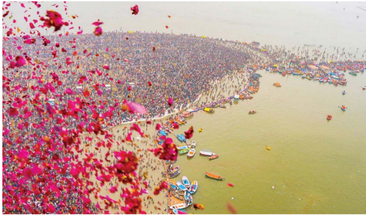
महाकुंभ मेला 2025 के दौरान 'मकर संक्रांति' के अवसर पर संगम में पवित्र स्नान करने के लिए एकत्रित हुए श्रद्धालुओं पर पुष्पा वर्षा की गई।

अत्यधिक एन्क्रिप्टेड ईमेल सेवाओं और जटिल डिजिटल मार्गों के माध्यम से भेजी गई थीं, जो स्पष्ट रूप से पहचान छिपाने और धमकी देने के इरादे को दर्शाती हैं। तिवारी ने कहा कि वे लोग पता लगाने से बचते हैं। हालांकि, उन्होंने कहा कि इस तरह के ईमेल भेजने में प्रयुक्त तकनीकी जटिलताओं और उन्नत तकनीकों को ध्यान में रखते हुए, पुलिस ने अन्य संस्थाओं/खिलाड़ियों/सहयोगियों की भूमिका की जांच शुरू कर दी है। पुलिस ने किशोर की पारिवारिक पृष्ठभूमि की जानकारी ली। उन्होंने कहा, हम देखना चाहते थे कि यह बच्चा यह सब अपने आप कैसे कर सकता है। (शेष पृष्ठ 9)