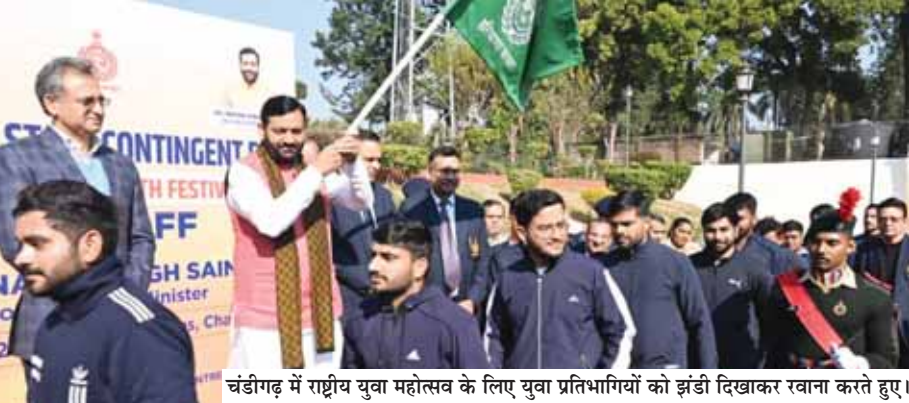
चंडीगढ़ में राष्ट्रीय युवा महोत्सव के लिए युवा प्रतिभागियों को झंडी दिखाकर रवाना करते हुए।