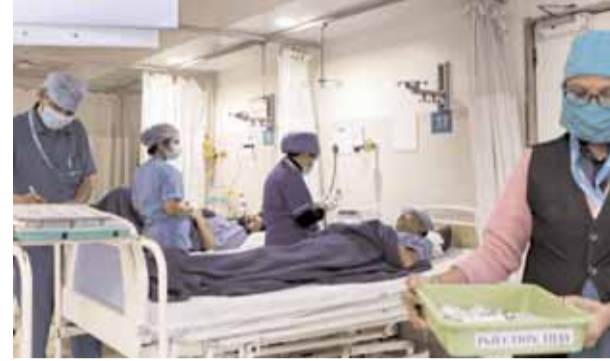
महाराष्ट्र के नागपुर में वायरस के दो सतिग्ध मामले सामने आने के एक दिन बाद एचएमपीवी के मरीजों के लिए मेडिटिना अस्पताल में तैयारियां बढ़ा दी गई हैं।

सूत्रों ने कहा कि भाजपा सांसदों ने इस आरोप का प्रतिवाद किया कि 'एक राष्ट्र एक चुनाव' प्रस्ताव ने कई राज्य विधानसभाओं को शीघ्र भंग करने और उनका कार्यकाल लोकसभा के साथ तय करने की