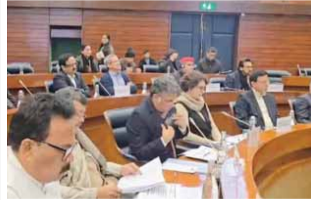
पायनियर समाचार सेवा। नई दिल्ली

आवश्यकता बताकर संवैधानिक मूल्यों को धुंधला कर दिया है। यह देखते हुए कि 1957 में सात राज्य विधानसभाओं को जल्दी ही भंग कर दिया गया था ताकि यह सुनिश्चित किया जा सके कि सभी राज्यों के चुनाव राष्ट्रीय चुनावों के साथ हों, संजय जयसवाल ने पूछा कि क्या तत्कालीन राष्ट्रपति राजेंद्र प्रसाद, जो संविधान सभा के अध्यक्ष भी थे, और उन सहित अन्य प्रतिष्ठित विधायकों को पसंद किया गया था? नेहरू सरकार में संविधान का उल्लंघन कर कार्य किया।