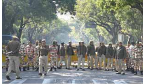
नई दिल्ली में लोक कल्याण मार्ग स्थित प्रधानमंत्री के आधिकारिक आवास के बाहर तैनात पुलिस और सुरक्षाकर्मी।