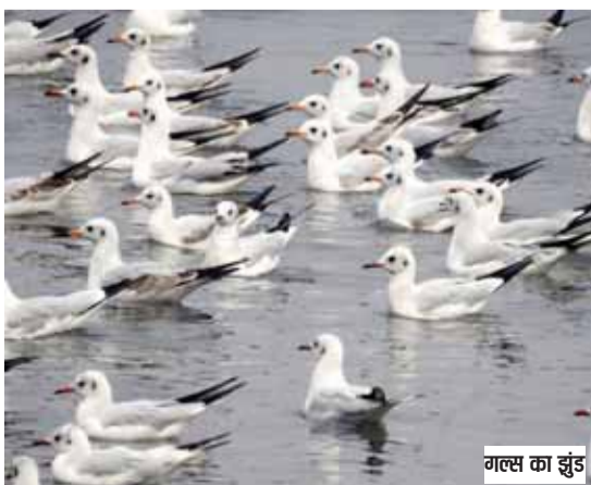
गलस का झुंड