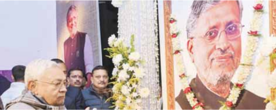
भाजपा के दिवंगत नेता सुशील मोदी को पुष्प अर्पित करते बिहार के सीएम नीतीश कुमार

बिहार के मुख्यमंत्री नीतीश कुमार ने रविवार को अपने कस्टर्ड प्रसिद्धिदात्री लालू प्रसाद की पार्टी राष्ट्रीय जनता दल (राजद) पर निशाना साधते हुए कहा कि उन्होंने विपक्षी पार्टी के साथ गलती से गठबंधन कर लिया था, जिसने सत्ता में रहते हुए कुछ नहीं किया। जनता दल यूनाइटेड (जदयू) सुप्रिमो ने यह टिप्पणी पूर्व मुख्यमंत्री लालू प्रसाद द्वारा कुछ दिनों पहले की गई पेशकश के बाद की है। लालू प्रसाद ने कहा था कि राजद ने पूर्व सहयोगी के लिए अपने दरवाजे खुले रखे हैं, जो अब भारतीय जनता पार्टी (भाजपा)नीत राष्ट्रीय जनतांत्रिक गठबंधन में लौट गए हैं। कुमार ने राज्यव्यापी प्रगति यात्रा के तहत उत्तर बिहार के मुजफ्फरपुर जिले में