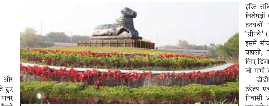
यमुना वाटिका में गीता कॉलोनी ब्रिज के प्रवेश द्वार के पास स्थापित 47.5 टन की नंदी की प्रतिमा।