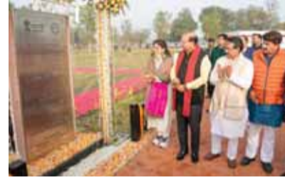
नई दिल्ली में 'यगुना वाटिका' का उद्घाटन करते दिल्ली के उपराज्यपाल विनय कुमार सक्सेना।

1984 के सिख विरोधी दंगों के पीड़ितों के लिए 16 जनवरी, 2006 को गृह मंत्रालय (एमएचए), भारत सरकार (जीओआई) द्वारा नौकरियों के प्रावधान सहित पुनर्वास पैकेज को