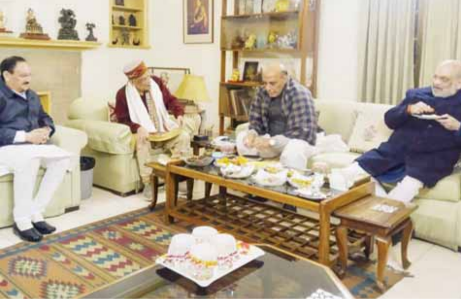
भाजपा के वरिष्ठ नेता मुगुली मनोहर जोशी को उनके जन्मदिन पर भाजपा के अध्यक्ष जेपी नड्डा, रक्षा मंत्री राजनाथ सिंह व गृहमंत्री अमित शाह ने उनके घर जाकर उनको बधाई दी

को कथित तौर पर बसाए जाने में पश्चिम बंगाल प्रशासन की भूमिका पर सवाल उठाए और पूछा कि राज्य सरकार ने बीएसएफ के अधिकार क्षेत्र को मजबूत करने की आवश्यकता का विरोध क्यों किया। भाजपा नेता ने पश्चिम बंगाल सरकार पर सीमा से जुड़े मुद्दों पर बीएसएफ के साथ सहयोग न करने का आरोप लगाया। उन्होंने कहा कि पश्चिम बंगाल सरकार पड़ोसी देशों में प्रताड़ित अल्पसंख्यकों को बसाने का विरोध कर रही है , लेकिन वह राज्य में घुसपैटियों का स्वागत कर रही है। अवैध प्रवासियों की घुसपैट से जुड़े मुद्दे से निपटने के बारे में शुभेंदु ने दावा किया, असम में प्रशासनिक मशीनरी सुरक्षा एजेंसियों का साथ दे रही है, जबकि दूसरी और पश्चिम बंगाल प्रशासन ने घुसपैटियों को वोट बैंक बनाने की दिशा में काम किया। भाजपा नेता ने सीमा पर सुरक्षा व्यवस्था मजबूत करने के केंद्र सरकार के प्रयासों को रेखांकित किया, जिसमें 591 किलोमीटर लंबी सीमा पर बाड़ लगाई जाना, प्लटलाइट की तैनाती और सीमा चौकियों एवं अवलोकन टावर का निर्माण शामिल है।