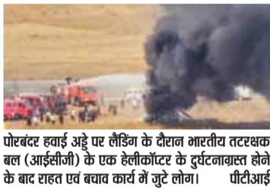
पोरबंदर हवाई अड्डे पर लैंडिंग के दौरान भारतीय तटरक्षक बल (आईसीजी) के एक हेलीकॉप्टर के दुर्घटनाग्रस्त होने के बाद राहत एवं बचाव कार्य में जुटे लोग।

इसके बाद, कुल 199 आवेदन प्राप्त हुए, जिनमें से 89 उम्मीदवार योग्य पाए गए, लेकिन ये सभी आयु सीमा से ऊपर थे और कुछ आवश्यक शैक्षणिक योग्यता से भी चूक गए थे। उन्होंने कहा कि छूट के लिए एलजी की मंजूरी से सरकारी सेवा में एमटीएस के रूप में उनकी नियुक्ति (शेष पृष्ठ 9)