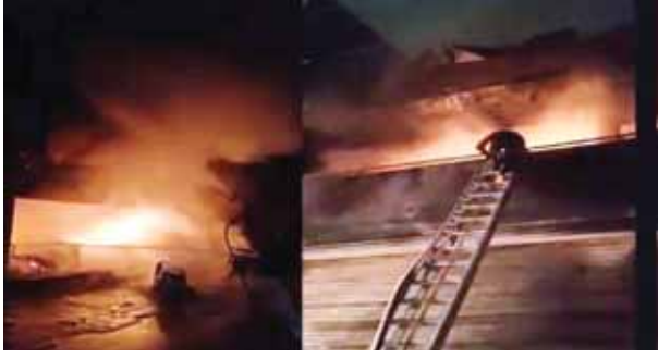
गुरुग्राम में ओल्ड रेलवे रोड पर रेवडी-गज्जक की दुकान में लगी भीषण आग बुझाने फायर ब्रिगेड के कर्मचारी।

शनिवार की आधी रात के बाद ओल्ड रेलवे रोड पर करीब दो बजे लगी भीषण आग से सारा सामान जलकर राख हो गया। आग लगने की सूचना पाकर दुकान संचालक पिता-पुत्र मॉके पर पहुंचे। दुकान की ऊपरी मंजिल पर करीब 10 कारीगर सो रहे थे। दोनों पिता-पुत्र उन्हें जगाने के लिए जब ऊपर जाने लगे तो आग की चपेट में आ गए। दोनों को अस्पताल पहुंचाया गया, जहां से उन्हें दिल्ली सफ़दरजंग अस्पताल रेफर कर दिया गया। बताया जा रहा है कि दुकान