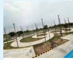
अधिकारियों ने जिले में और सेंटर खोलने का निर्णय लिया। जिले में चार ड्राइविंग ट्रेनिंग सेंटर के निर्माण का काम जल्द शुरू हो कर दिया

फिलहाल जिले में सिर्फ एक ड्राइविंग ट्रेनिंग सेंटर चल रहा है। यह सेंटर दादरी के बिसाहड़ा गांव इलाके में है। इस सेंटर पर कई बार धांधली के आरोप लग चुके हैं। जिसके बाद