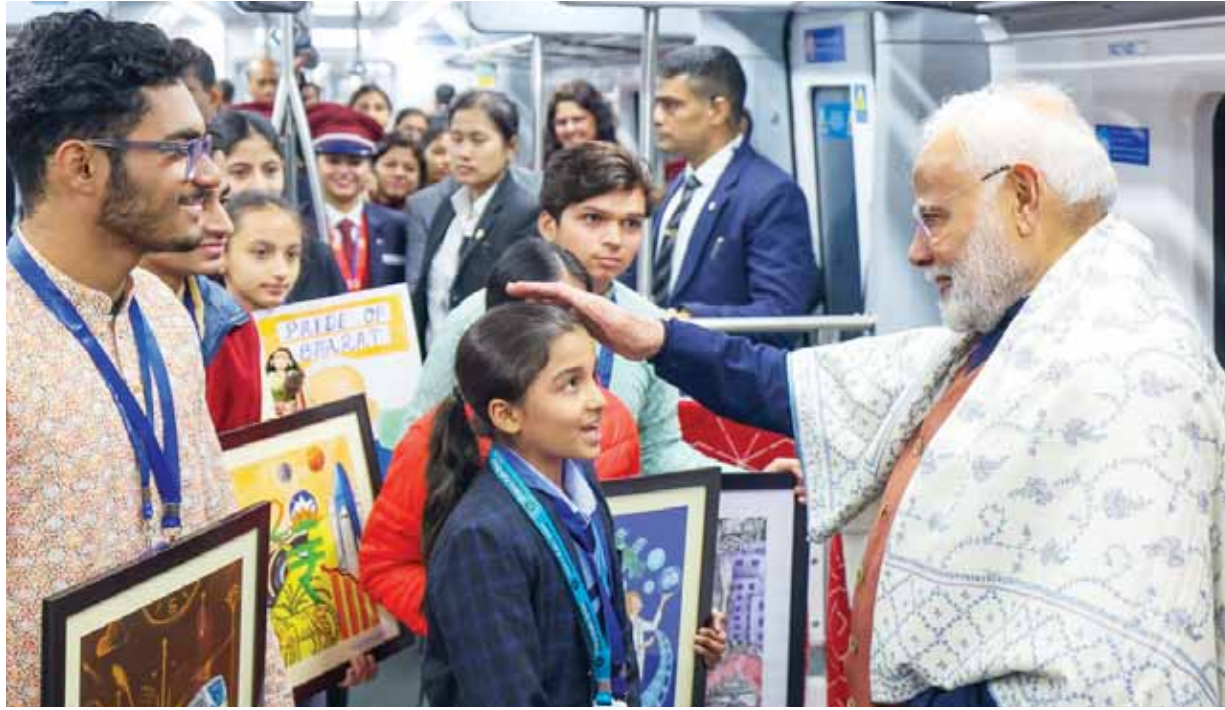
प्रधानमंत्री नरेंद्र मोदी ने राजधानी को नमो भारत ट्रेन की सौगात दी, सफर के दौरान पीएम ने बच्चों से हालचाल जाना।

दिल्ली खंड के चालू होने से नमो भारत कॉरिडोर का परिचालित का 55 किलोमीटर तक विस्तार हो गया है, जिसमें कुल 11 स्टेशन हैं। मेरठ शहर अब सीधे दिल्ली से जुड़ गया है। यात्री अब केवल 40 मिनट