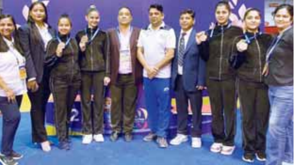
राष्ट्रीय जिम्नास्टिक चैंपियनशिप में विजेता हरियाणा की टीम कोच के साथ।

किया जाना बहुत ही सहायनीय कार्य है। एक महिला अपने जीवन में कई भूमिका निभाती है। शिक्षिका के रूप में वह राष्ट्र का निर्माण भी करती है। इसलिए यह भागीदारी अनुकरणीय है। उन्होंने कहा कि माता सावित्री बाई फुले का जीवन अभावों और कठिनाइयों के बीच कटता। उनके प्रयासों से आज महिलाएं शिक्षा ग्रहण करके खुद को साबित कर पा रही हैं। किलकारी चैरिटेबल सोसाइटी के चेयरमैन अशोक गोरे ने कहा कि हर समाज का यह कर्तव्य बनता है कि वे समाज की महिलाओं को बराबरी से आगे बढ़ाएं। किसी तरह का भेदभाव ना करें।