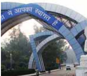
को मंजूरी मिल चुकी है। वर्ष 2025 के मध्य तक निर्माण कार्य शुरू होने की संभावना है। अगस्त 2025 में इसकी नींव रखे जाने की योजना है। हेरिटेज सिटी को 735 एकड़ क्षेत्र में विकसित किया जाएगा।

राया हेरिटेज सिटी के माध्यम से ब्रज और मथुरा क्षेत्र की समृद्ध सांस्कृतिक और धार्मिक विरासत का प्रदर्शन किया जाएगा। परियोजना की डिटेल प्रोजेक्ट रिपोर्ट (डीपीआर)