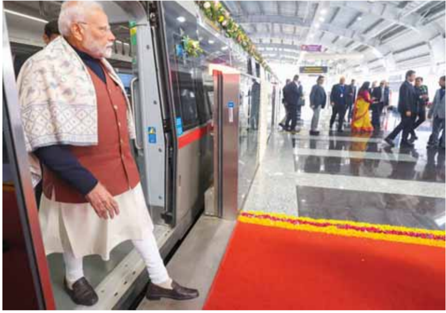
प्रधानमंत्री नरेंद्र मोदी साहिबाबाद और न्यू अशोक नगर के बीच दिल्ली-मेरठ क्षेत्रीय रैपिड ट्रांजिट सिस्टम (आरआरटीएस) कॉरिडोर के 13 किलोमीटर लंबे खंड के उद्घाटन के दौरान नमो भारत ट्रेन की सवारी करते हुए।