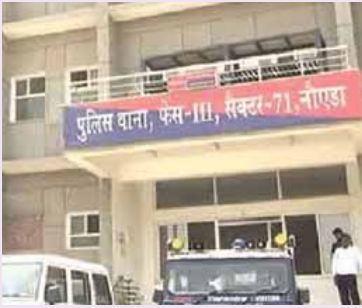
आवासीय सुविधाएं प्रदान करने की दिशा में एक महत्वपूर्ण कदम है। नोएडा के तेजी से बढ़ते औद्योगिक क्षेत्र में पुलिस बल की उपस्थिति को मजबूत करने के लिए यह

उत्तर प्रदेश के मुख्यमंत्री योगी आदित्यनाथ ने गौतमबुद्धनगर के थाना फेज-3 में पुलिस कर्मियों के लिए आवासीय भवनों के निर्माण को मंजूरी दे दी है। इस परियोजना के लिए 3 करोड़ 94 लाख 13 हजार रुपये की धनराशि स्वीकृत की गई है। यह निर्णय पुलिस कर्मियों को बेहतर