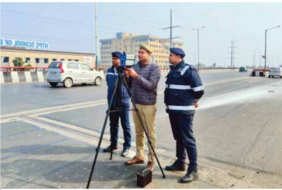
प्लिवेटेड रोड पर तेज गति से चल रही गाड़ियों पर ट्रैफिक पुलिस की नजर है। स्पीड रडार से वाहनों की गति जांचता जवान।

की जा रही है। साथ ही आवेदकों को जानबूझकर फेल किया जा रहा है। ऐसे में जानकारों का मानना है कि जब लोगों के पास विकल्प होंगे तो टेस्ट को लेकर कोई परेशानी नहीं होगी। वहीं बताया जा रहा है कि संभवतः इसी साल इनका संचालन भी शुरू हो जाएगा। खास बात यह है कि इन चारों सेंटरों के खुलने के बाद लोगों को काफी सुविधा मिलेगी। लोग आसानी से टेस्ट देकर अपना डीएल प्राप्त कर सकेंगे।