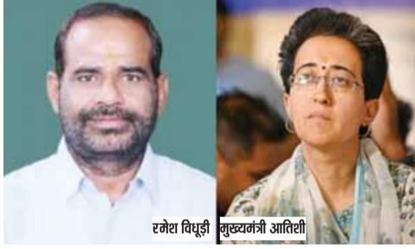
रमेश बिधुड़ी मुख्यमंत्री आतिथी