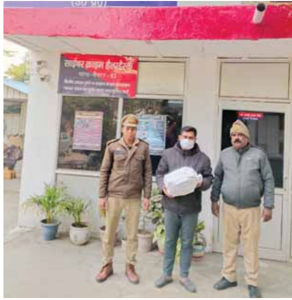
कंपनी में जीडीए के पद पर रहते हुए करीब 2 लाख रुपए की दवाइयां चोरी करने वाला अभियुक्त पुलिस गिरफ्त में।

नोएडा में 15 अगस्त को लड्डूओं के वितरण को लेकर एक मामला अदालत तक पहुंच गया। लड्डू खा लिए की तंज पर आरडब्ल्यू अध्यक्ष ने सेक्टर के 16 लोगों के खिलाफ एक करोड़ रुपए का नोटिस भेज दिया। बल्कि जवाब न मिलने पर अदालत में वाद भी दायर कर दिया। इस मामले में अब 27 जनवरी को सूरजपुर कोर्ट में सुनवाई की जाएगी। कोर्ट में मानहानि का वाद दायर करने वाले सेक्टर-20 ब्लाक