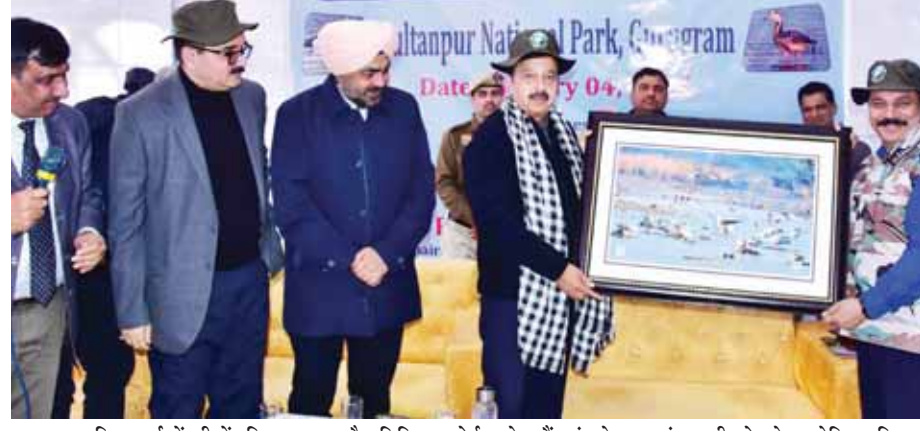
सुल्तानपुर स्थित बर्ड सेंचुरी में हरियाणा राज्य जैव विविधता बोर्ड व वेस्टलैंड इंटरनेशनल संस्था की ओर से आयोजित एशिया में बर्ड सेंसस-2025 में मुख्य अतिथि मंत्री राव नरबीर सिंह को स्मृति चिह्न देते आयोजक।