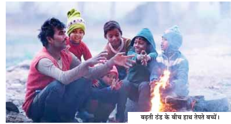
बढ़ती ठंड के बीच हाथ थपते बच्चों।

गौतमबुद्ध नगर की सड़कों पर शनिवार सुबह को कोहरे की चादर फैल गई। इससे दृश्यता शुन्य हो गई। यहां के विभिन्न एक्सप्रेस हाईवे पर छाप घने कोहरे के चलते राहगीरों की परेशानियों का सामना करना पड़ा। शुक्रवार की देर रात से शुरू हुआ कोहरा शनिवार को जारी रहा। आलम यह हुई की दृश्यता शुन्य से एक मीटर तक रह गई थी। कोहरे की वजह से होने वाले सड़क हादसों को रोकने के लिए यमुना एक्सप्रेसवे, ईस्टर्न पेरीफेरल हाईवे और नेशनल हाईवे- 91 पर पुलिस और टोल प्लाजा के लोग तैनात रहे। इन लोगों ने वहां से गुजरने वाले वाहन चालकों को नियमों का पालन करने तथा कोहरे में कैसे वाहन चलाया जाए इसके लिए जागरूक