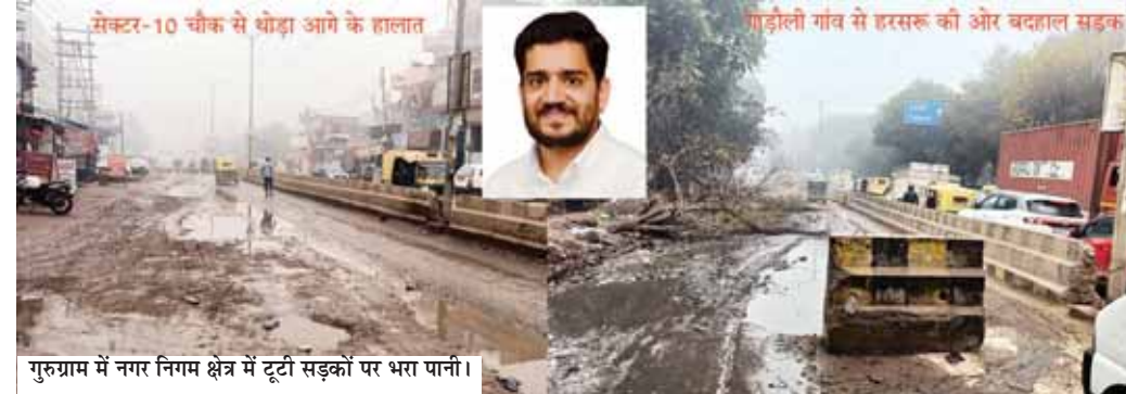
गुरुग्राम में नगर निगम क्षेत्र में टूटी सड़कों पर भरा पानी।