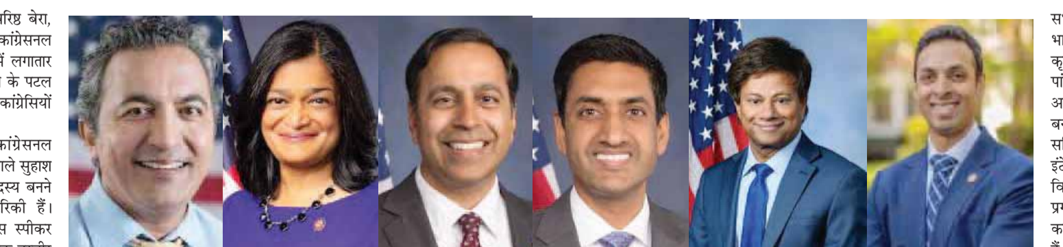
(बाएं से दाएं) अमी बेरा, प्रमिला जयपाल, राजा कृष्णमूर्ति, रो खन्ना, श्रीयानेदार और सुहास सुब्रमण्यम।

उत्साहित हूँ!' इनमें से सबसे वरिष्ठ बेरा, जिन्होंने कैलिफोर्निया के सातवें कांग्रेसनल डिस्ट्रिक्ट के प्रतिनिधि के रूप में लगातार सातवां बार शपथ ली है, ने सदन के पटल से सभी छह भारतीय अमेरिकी कांग्रेसियों की एक तस्वीर भी पोस्ट की। वर्जीनिया के 10वें कांग्रेसनल डिस्ट्रिक्ट का प्रतिनिधित्व करने वाले सुहाश सुब्रमण्यम प्रतिनिधि सभा के सदस्य बनने पर एक पोस्ट में कहा, 'भारतीय अमेरिकी हैं। उन्होंने अपने परिवार और हाउस स्पीकर माइक जॉर्नसन के साथ अपनी एक तस्वीर पोस्ट करते हुए कहा, काम का पहला दिन! 119वीं कांग्रेस में शपथ लेने पर सम्मानित महसूस कर रहा हूँ, और वीए10 के लिए परिणाम देने के लिए काम करने के लिए उत्साहित हूँ।' मिशिगन के 13वें