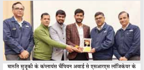
मारुति सुजुकी के कंप्लायंस चैंपियन अवार्ड से एसआरएस लॉजिकेयर के एमडी व निदेशक को सम्मानित करते कंपनी के अधिकारी।

एसआरएस लॉजिकेयर को मिला कंप्लायंस चैंपियन अवार्ड