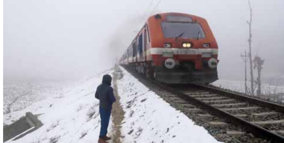
श्रीनगर के बाहरी इलाके में कोहरे भरी सर्दियों की दोपहर में बाढ़ के बीच श्रीनगर-बारगुला रेलवे ट्रैक पर दौड़ती एक ट्रेन।