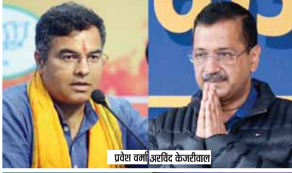
प्रवेश वर्मा अरविंद केजरीवाल