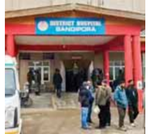
बांदीपोरा जिले में सेना के एक वाहन के खाई में गिरने के बाद घायल सेना के जवानों का शिला अस्पताल में भर्ती कराया गया।

हस्ताक्षर करने के बाद से एनएससीएन-आईएम के साथ राजनीतिक वार्ता कर रहा है और 2015 में 'फेमवर्क' समझौते पर भी हस्ताक्षर किए। इसने नगा राष्ट्रीय राजनीतिक समूहों (डब्ल्यूसी एनएनपीजी) की कार्य समिति के साथ समानांतर वार्ता में भी प्रवेश किया। 2017 में कम से कम सात नगा गुटों से बना। उन्होंने नवंबर 2017 में सहमत स्थिति पर हस्ताक्षर किए। तत्कालीन वार्ताकार और नगालैंड के राज्यपाल आरएन रवि द्वारा केंद्र और नगा (शेष पृष्ठ 9)