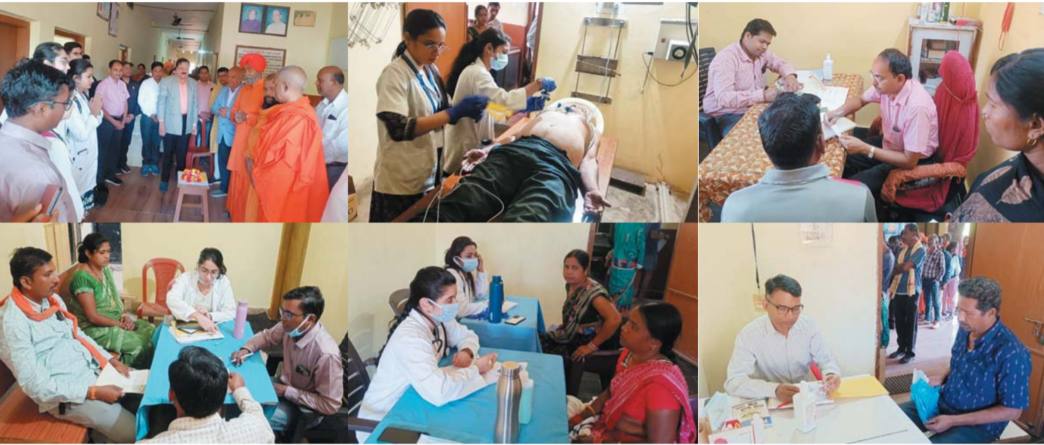
पायनियर संवादकर्ता < रायपुर www.dailypioneer.com

श्री बालाजी मेडिकल कॉलेज अस्पताल एवं रामदुलारी बृजकिशोर आयुर्वेदिक औषधालय आमसेना, (ओडिशा) के संयुक्त तत्वाधान में निःशुल्क स्वास्थ्य शिविर का आयोजन 9 फरवरी को प्रातः