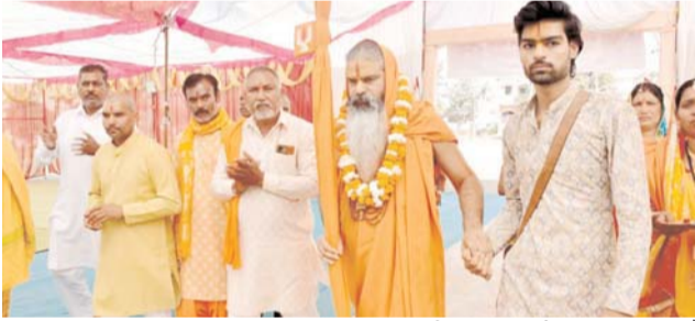
पायनियर संवाददाता < उदई www.dailypioneer.com

बाबा दरबार पावन धाम एवं समस्त ग्रामवासी धनोरा दुर्ग के विशेष सहयोग से 4 फरवरी से 12 फरवरी तक शत चंडी यज्ञ श्री हनुमंत कथा श्री रामकथा जारी है। बाबा दरबार के लक्ष्मण बाबा ने बताया कि हर रोज सुबह 7 बजे से यज्ञ हवन प्रारंभ एवं दोपहर 2 बजे से हरिद्वेषा तक श्री रामकथा एवं 10 फरवरी को शाम 7 बजे से श्री राम दरबार मानस परिवार चोतमखार गरियाबंद वाले मंडली के द्वारा मानस गान महावीर उद्यान कथा