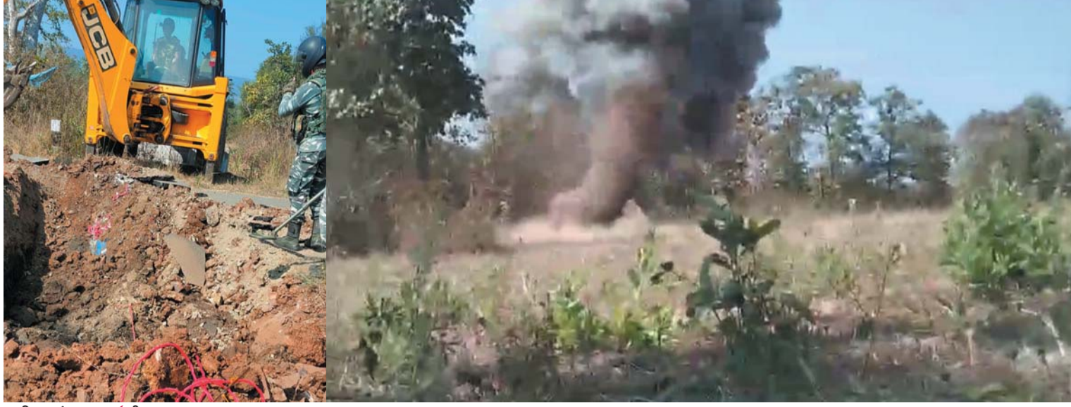
पायनियर संवाददाता < बीजापुर www.dailypioneer.com

उसूर-आवापल्ली मार्ग में बीडीएस टीम के द्वारा उसूर से 3 किमी की दूरी पर धान मंडी के पास मार्ग में माओवादियों के द्वारा लगाए लगभग 25 किग्रा का आईडी डिटेक्टर किया