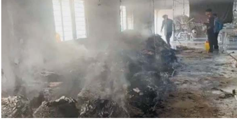
पायनियर संवाददाता < नरेवाड़ा www.dailypioneer.com

जिले के बारसूर स्थित डेनेक्स गारमेट फैक्ट्री में रविवार सुबह आग लग गई। आग इतनी तेज थी कि फैक्ट्री में रखी सिलाई मशीनें, कपड़े और अन्य महंगे उपकरण जलकर खाक हो गए। हादसे के तुरंत बाद मौके पर पहुंची एसडीआरएफ टीम ने कड़ी मशक्कत के बाद आग बुझाई। इस हादसे में करोड़ों के नुकसान की आशंका जताई जा रही है, प्रशासन द्वारा नुकसान का आकलन किया जा रहा है। बताया जा रहा है कि शॉर्ट सर्किट की वजह से