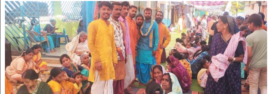
पायनियर संवाददाता < किरंदुल www.dailypioneer.com

नगरवासियों की सुख शांति समृद्धि एवं जनकल्याण की मंगल कामना को लेकर किरंदुल ब्लॉक कैम्प हनुमान मंदिर प्रांगण में संगीतमय