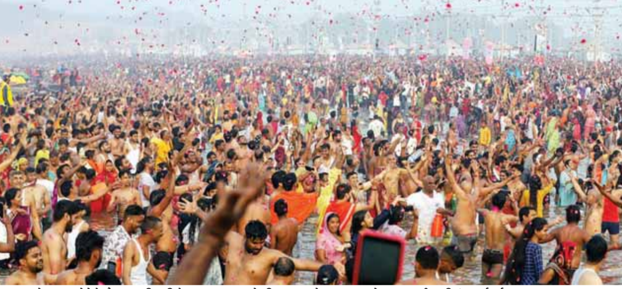
प्रयागराज में महाकुंभ मेले के दौरान मठा शिवरात्रि के अवसर पर सगन में पवित्र स्नान करने सतत श्रद्धालुओं पर गुलाब की पंखुड़ियां बरसाई गईं

रहा। भगदड़ में 30 लोगों की मृत्यु हो गई थी।