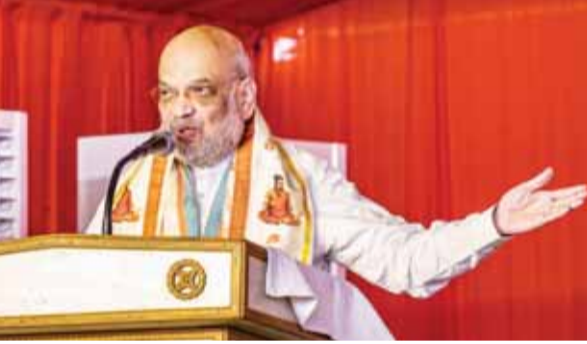
केंद्रीय गृह मंत्री अमित शाह बुधवार को तमिलनाडु के कोयंबटूर में भाजपा कार्यालय के उद्घाटन के दौरान सगन को संबोधित करते हुए।

स्टालिन के आरोपों का पुरजोर खंडन करते हुए अमित शाह ने कहा कि एनडीए सरकार ने हिंदी को बढ़ावा देने और लोकप्रिय बनाने के लिए काफी काम किया है। 'स्टालिन और उनके बेटे ने भ्रष्टाचार को संरक्षण बना दिया है।' गृह मंत्री ने कहा, 'डीएमके की सत्तारूढ़ सरकार में भ्रष्टाचार के आरोप बहुत हैं।'