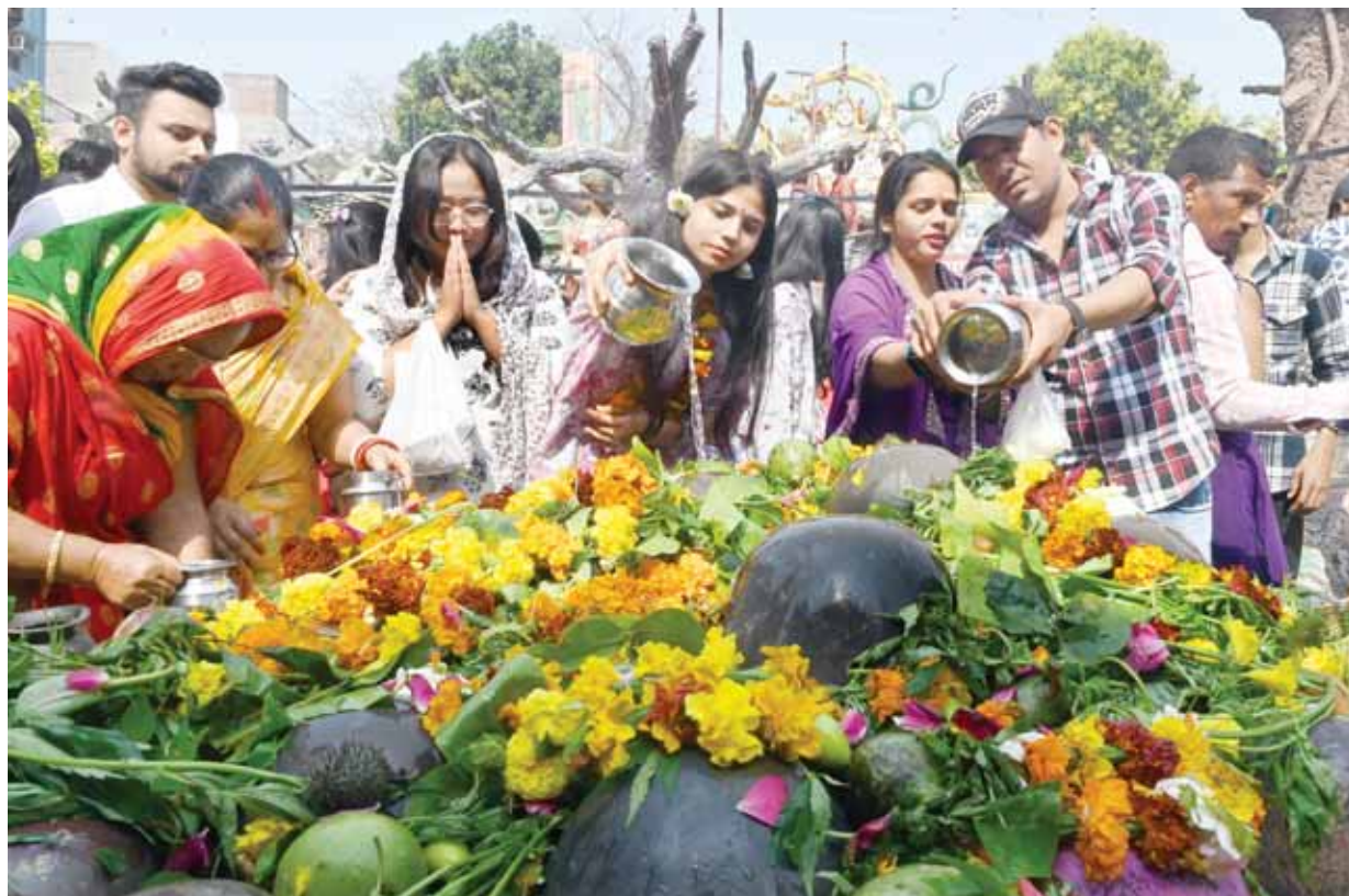
हर-हर महादेव की उद्घोष के साथ महाशिवरात्रि के पर्व पर प्रीत विहार स्थित मंदिर में भगवान शिव की पूजा अर्चना करते श्रद्धालु।