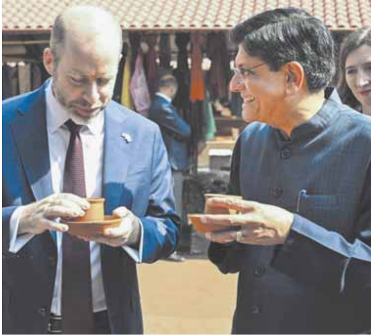
अंशदान कन्वेंशन समझौते पर सक्रिय रूप से बातचीत कर रहे हैं। उन्होंने कहा, ...और ए

यह पूछे जाने पर कि क्या द्विपक्षीय निवेश संधि (बीआईटी) के लिए बातचीत एफटीए के साथ ही पूरी हो जाएगी, गोयल ने कहा कि दोनों देश तीन अलग-अलग मोर्चों – एफटीए, द्विपक्षीय निवेश संधि (बीआईटी) और दोहरे