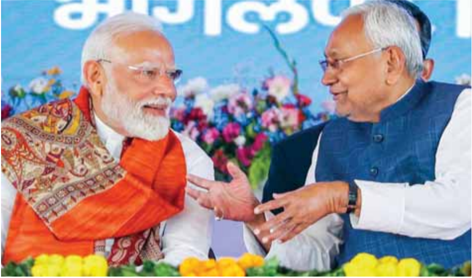
भागलपुर में सोमवार को प्रधानमंत्री नरेंद्र मोदी और बिहार के मुख्यमंत्री नीतीश कुमार प्रधानमंत्री किसान सम्मान निधि (पीएम-किसान) योजना की 19वीं किस्त जारी करते और विभिन्न विकास परियोजनाओं का शुभारंभ करने के दौरान।