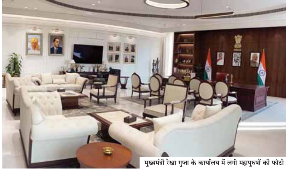
मुख्यमंत्री रेखा गुप्ता के कार्यालय में लगी महापुरुषों की फोटो।