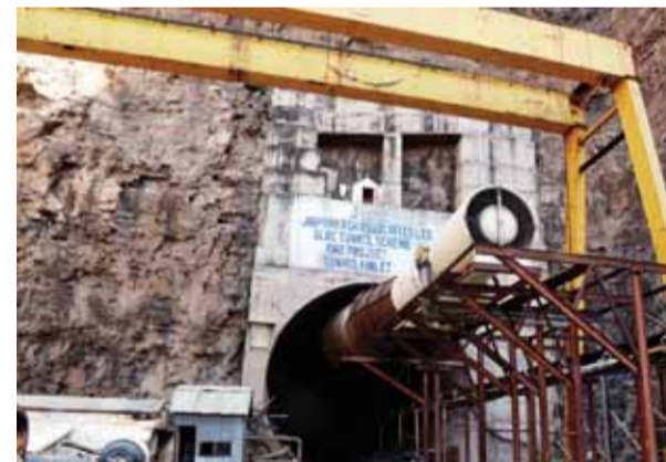
नागरकरुवल के श्रीश्रीलम लेफ्ट बैंक कैनाल (एसएलबीसी) परियोजना स्थल, जहां सुरंग का एक हिस्सा ढह गया है। सुरंग में आठ श्रमिकों के फंसे होने की आशंका है।