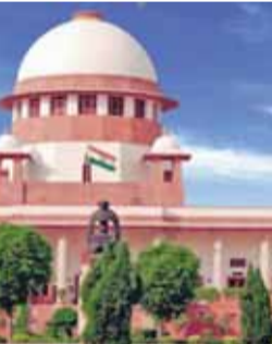
चले जाते हैं। पीठ ने कहा कि इस तरह के अपराध आम तौर पर घर के अंदर पूरी गोपनीयता के साथ किए जाते हैं और अभियोजन पक्ष के लिए साक्ष्य पेश करना बहुत मुश्किल हो जाता है।

पति द्वारा एक महिला की हत्या से जुड़े मौजूदा मामले में पीठ ने कहा कि रिकॉर्ड में ऐसा कुछ भी नहीं है जो यह दर्शाता हो कि पीठित की बेटी एक प्रतिष्ठित गवाह की अदालत ने कहा, अदालतों के सामने अक्सर ऐसे मामले आते हैं जहां पति, तनावपूर्ण वैवाहिक संबंधों और चरित्र के बारे में संदेह के कारण, पत्नी की हत्या करने की हद तक