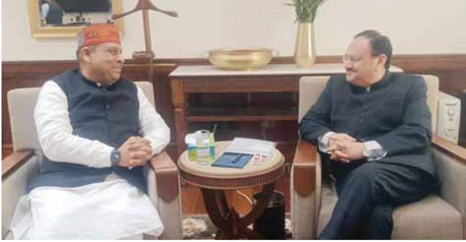
दिल्ली में भाजपा की शानदार जीत के बाद पूर्व नेता प्रतिपक्ष विजेंद्र गुप्ता ने जेपी नड्डा से मुलाकात की।

राष्ट्रीय राजधानी का नया मुख्यमंत्री कौन होगा, इस पर अभी