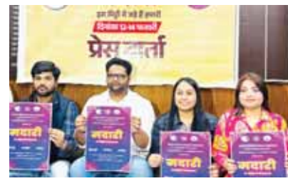
आयोजित होगा। इस कार्यक्रम में विभिन्न कलाओं, प्रदर्शनी और भारत की समृद्ध संस्कृति एवं विरासत की सजीव झलक देखने को मिलेगी। एबीवीपी के अनुसार, यह मंच, रंगमंच और नुककड़ नाटक

राष्ट्रीय कला मंच अखिल भारतीय विद्यार्थी परिषद नीत दिल्ली विश्वविद्यालय छात्र संघ के माध्यम से तीन दिवसीय वार्षिक सांस्कृतिक उत्सव मदारी के 6वें संस्करण का आयोजन कर रहा है। यह कार्यक्रम 12 से 14 फरवरी तक नॉर्थ कैम्पस में