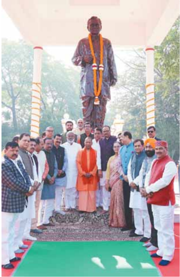
डबल इंजन सरकार पंडित उपाध्याय के सपनों को पूरा कर रही है। सीएम योगी ने कहा कि पंडित दीनदयाल

पंडित दीनदयाल उपाध्याय की पुण्यतिथि पर मुख्यमंत्री उनकी प्रतिमा पर माल्यार्पण कर दी श्रद्धांजलि