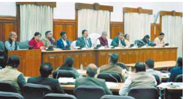
पर होने वाले वृक्षारोपण से संबंधित सभी व्यवस्थाएं समय से पूर्ण कर ली जायें। उन्होंने कहा कि वृक्षारोपण के लिए पौधशालाओं में उपयुक्त ऊंचाई के स्वस्थ एवं गुणवत्तापूर्ण पौध की उपलब्धता सुनिश्चित की जाय। अवैध कटान व अवैध शिकार में लिप्त असामाजिक, अवांछित, अपराधिक प्रवृत्ति के व्यक्तियों के विरुद्ध कठोर कार्यवाही करते हुए तथा अवैध कटान व अवैध शिकार के प्रकरणों की संख्या शून्य की जाये।

वन मंत्री ने कहा कि वर्ष 2015 से वर्ष 2024 तक 40718 हेक्टेअर भूमि पर वृक्षारोपण किया जा चुका है। इस वर्ष वन विभाग के लिए 80 हजार हेक्टेअर भूमि पर 12.60 करोड़ वृक्षारोपण का लक्ष्य है। अन्य विभागों के लिए भी अलग-अलग लक्ष्य निर्धारित किये गये हैं। व्यापक स्तर