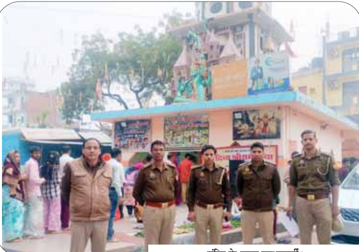
मंदिर के बाहर सुरक्षाकर्मी। रुद्राभिषेक और भगवान भोलेनाथ के दर्शन करने के लिए भारी भीड़ जुटी रही। नोएडा में भूदा महादेव, मोरना और निठारी के शिवालयों में भी सुबह से ही श्रद्धालुओं का ताता लगा रहा। दूसरी ओर व्यवस्था बनाए रखने के लिए नोएडा पुलिस ने भी पुख्ता इंतजाम किए हैं। शहर के मंदिरों पर फोर्स तैनात किया गया है। पुलिसकर्मी बुजुर्गों और महिलाओं की मदद कर रहे हैं। इसके अलावा सेक्टर-