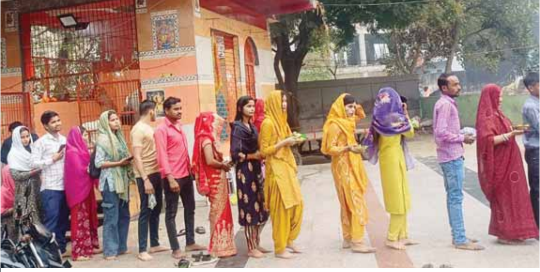
महाशिवरात्रि के अवसर पर नोएडा के मंदिर में भक्तों की लंबी कतारें दिखने को मिली। अपनी बारी का इंतजार करते महिलाएं और पुरुष।

सिद्ध पीठ साईं शनि मंदिर के महंत ने बताया कि महाशिवरात्रि भगवान शिव के पूजन का सबसे बड़ा पर्व है। यह फलगुन कृष्ण चतुर्दशी को मनाया जाता है। इस मौके पर मंदिर में जलाभिषेक करने के लिए अलग से व्यवस्था की गई है। छालेरा गांव सेक्टर-44 में प्राचीन शिव मंदिर और बाबा बालक नाथ आश्रम है। यहां महाशिवरात्रि का पर्व बड़ी धूमधाम से मनाया गया। सुबह से अखंड कीर्तन का आयोजन किया गया। जलाभिषेक,