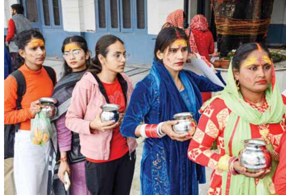
अमृतसर में बुधवार को महाशिवरात्रि के अवसर पर शिव मंदिर में प्रार्थना करने के लिए कतार में लगे हुए।

पंजाब, हरियाणा और चंडीगढ़ के मंदिरों में बुधवार को महाशिवरात्रि के अवसर पर पूजा-अर्चना करने के लिए बड़ी संख्या में श्रद्धालुओं की भीड़ उमड़ पड़ी। महाशिवरात्रि के मौके पर लोग सुबह-सुबह ही दूध और फल चढ़ाने के लिए मंदिरों में पहुंचने लगे। कई शिव मंदिरों के बाहर श्रद्धालुओं की लंबी कतारें नजर आईं। हरियाणा के मुख्यमंत्री नयब सिंह सैनी और पंजाब के मुख्यमंत्री भगतवंत मान ने लोगों को महाशिवरात्रि की हार्दिक शुभकामनाएं दीं। सैनी ने नई दिल्ली स्थित हरियाणा भवन के शिव मंदिर में सुबह