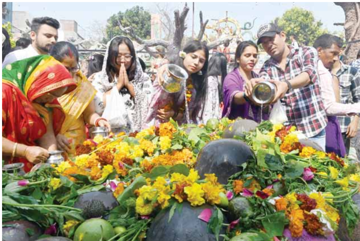
हर-हर महादेव की उद्घोष के साथ महाशिवरात्रि के पर्व पर प्रीत विहार स्थित मंदिर में भगवान शिव की पूजा अर्चना करते श्रद्धालु।