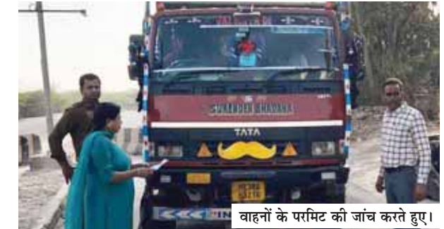
वाहनों के परमिट की जांच करते हुए।

निर्धारित नियमों के तहत ही करें खनिज परिवहन, अन्यथा होगी सख्त कार्रवाई