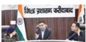
सतर्कता बरते। जहां भी अवैध खनन करने वालों की शिकायतों और सूचनाओं पर त्वरित कार्यवाही अमल में लाना सुनिश्चित करें। इसके साथ ही अवैध रूप से ओवरलोडिंग को लेकर भी सख्ती से पेशा आकर चालान करना सुनिश्चित करें।