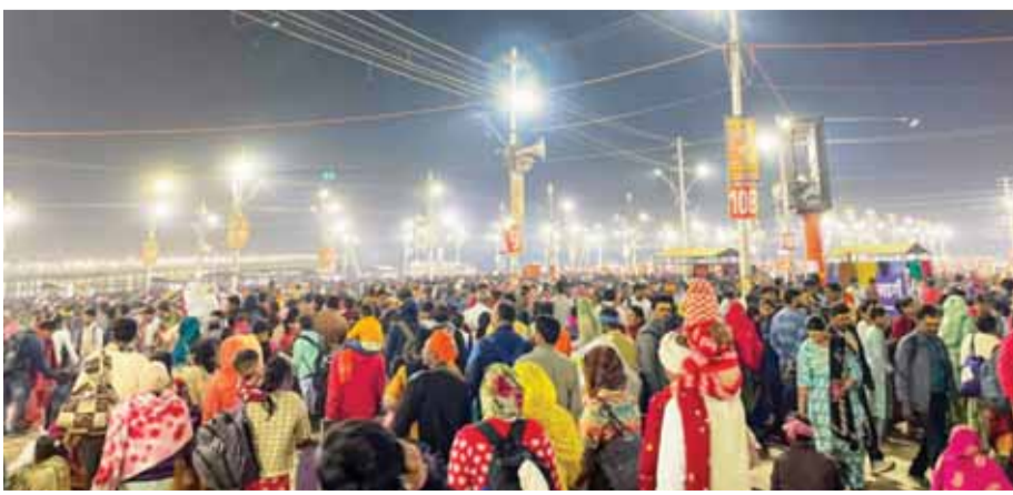
प्रयागराज में चल रहे महाकुंभ मेले 2025 के दौरान मंगलवार तड़के त्रिवेणी संगम पर पवित्र डुबकी लगाने के लिए श्रद्धालु एकत्रित हुए।

प्रयागराज में गंगा नदी के तटों पर चौबीसों घंटे तीर्थयात्रियों की भीड़ लगी रहती है, पूजा सामग्री बेचने वाले तथा संगम स्थल पर उमड़ने वाली भीड़ को नियंत्रित करने के लिए हर जगह सुरक्षा कर्मचारी तैनात रहते हैं - त्रिवेणी संगम वह स्थान है जहां दिन और रात का अंतर नजर नहीं आता। सुबह से शाम तक और आधी रात से भोर तक, इस पवित्र नगरी में मानवता के विशाल समामग में आध्यात्मिक स्नान का चक्र बिना स्के चलता रहता है। दुनिया के सबसे बड़े धार्मिक उत्सव महाकुंभ का बुधवार को महाशिवरात्रि के दिन अंतिम स्नान के साथ समाप्त हो जाएगा। अब हर समय महाकुंभ मेला क्षेत्र में लोगों के सैलाब को आता-जाता देखा जा सकता है। कई लोग पवित्र डुबकी के