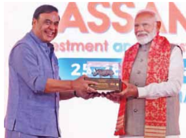
प्रधानमंत्री नरेन्द्र मोदी गुवाहाटी में एडवांटेज असम 2.0 निवेश और बुनियादी ढांचा शिखर सम्मेलन 2025 में शिरकत करते हुए। साथ में मुख्यमंत्री हितान विश्व सरमा

प्रधानमंत्री नरेन्द्र मोदी ने मंगलवार को कहा कि यह पूर्वोत्तर की पवित्र भूमि में नए युग की शुरुआत है और एडवांटेज असम 2.0 निवेश शिखर सम्मेलन पूरी दुनिया को राज्य की संभावनाओं तथा प्रगति से जोड़ने का एक महान अभियान है। यह असम की करीब छह लाख करोड़ रुपये की अर्थव्यवस्था को रेखांकित करेगा। प्रधानमंत्री ने यहां एडवांटेज असम 2.0 निवेश एक अवसरचक्र शिखर सम्मेलन का उद्घाटन करते हुए कहा, इतिहास गवाह है कि भारत की समृद्धि में पूर्वी भारत ने प्रमुख भूमिका निभाई है। आज, विकसित भारत के लक्ष्य की ओर बढ़ते हुए ये क्षेत्र अपनी वास्तविक क्षमता का प्रदर्शन करेंगे। उन्होंने कहा, वैश्विक अस्थिरता के बावजूद, विशेषज्ञ एक बात पर पूरी तरह से सहमत हैं कि भारत तेजी से वृद्धि कर रहा है। मोदी ने इस बात पर जोर दिया कि आज का भारत इस सदी के अगले 25 साल के लिए दीर्घकालिक दृष्टिकोण के साथ काम कर रहा है। उन्होंने कहा, दुनिया को भारत के युवाओं पर बहुत भरोसा है, जो तेजी से कुशल व नवोन्मेषी बन रहे हैं। प्रधानमंत्री ने भारत के नए मध्यम वर्ग में बढ़ते आत्मविश्वास पर जोर दिया, जो नई आकांक्षाओं के साथ गरीबी से उबर रहा है। मोदी ने कहा, भारत अपनी