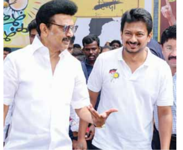
तमिलनाडु के मुख्यमंत्री स्टालिन, उपमुख्यमंत्री उदयनिधि स्टालिन और अन्य लोगों के साथ चेन्नई में 'कलईगलर शताब्दी मुक्केबाजी अकादमी' के उद्घाटन के अवसर पर।

डीएमके अध्यक्ष और तमिलनाडु के मुख्यमंत्री एमके स्टालिन ने मंगलवार को केंद्र पर राज्य पर हिंदी थोपकर 'भाषा युद्ध के बीज बोने' का आरोप लगाया और कहा कि उस भाषा के वचस्व की इजाजत नहीं दी जाएगी। मीडिया को संबोधित करते हुए स्टालिन ने कहा कि डीएमके एक और भाषा युद्ध के लिए तैयार है। उन्होंने कहा कि हालांकि राज्य किसी विशेष भाषा के खिलाफ नहीं है और किसी भी भाषा को सीखने की इच्छा रखने वाले किसी भी व्यक्ति के रास्ते में नहीं आएगा, लेकिन वह किसी भी अन्य भाषा को हावी होने और मातृभाषा तमिल को नष्ट करने की अनुमति नहीं देने के लिए कृतसंकल्प है। स्टालिन ने अपने पार्टी कार्यकर्ताओं को संबोधित