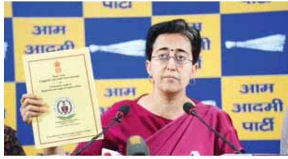
निति से सरकारी खजाने को नुकसान हो रहा था और इसमें बदलाव की बहुत जरूरत थी। साथ ही, कैग रिपोर्ट ने इस पर भी मोहर लगाती है कि आम आदमी पार्टी की सरकार द्वारा पुरानी एक्ससाइज पॉलिसी को बदलने का

दिल्ली विधानसभा के सदन में मंगलवार को दिल्ली शराब नीति पर पेश की गई कैग रिपोर्ट ने आम आदमी पार्टी के उस दावे पर अपनी मोहर लगा दी है कि पुरानी शराब नीति में भारी गड़बड़ी थी, डीलर कालाबाजारी करते थे और बड़े पैमाने पर भ्रष्टाचार हो रहा था। सीएजी रिपोर्ट से पता चलता है कि पुरानी शराब