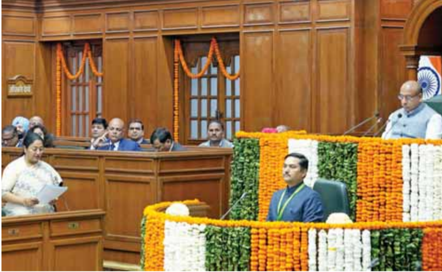
दिल्ली विधानसभा में कैग रिपोर्ट पेश करती मुख्यमंत्री रेखा गुप्ता।

विधानसभा चुनाव से पहले चर्चा का विषय बने कथित शराब घोटाले पर रिपोर्ट में 941.53 करोड़ रुपये के राजस्व के नुकसान का दावा किया गया है। रिपोर्ट में कहा गया है कि गैर