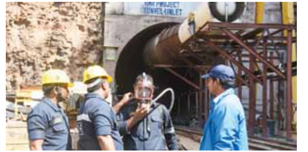
नागरकुल्लू, श्रीशैलम लेफ्ट बैंक केनाल (एसएलबीसी) परियोजना स्थल पर बचाव दल, जहां सुरंग का एक हिस्सा ढह गया है।

तेलंगाना के सिंचाई मंत्री उत्तम कुमार रेड्डी ने मंगलवार को कहा कि श्रीशैलम लेफ्ट बैंक केनाल (एसएलबीसी) सुरंग के निर्माणधीन खंड के आंशिक रूप से ढह जाने के बाद उसमें फंसे लोगों को बचाने में लगे दलों का जीवन भी कीचड़ और पानी के निरंतर प्रवाह के कारण खतरे में पड़ सकता है। रेड्डी ने मीडियाकर्मीयों के सामने विशेषज्ञों का हवाला दिया जिन्होंने कहा है कि यह बचाव अभियान दुनिया में या कम से कम भारत में सबसे जटिल और कठिन है क्योंकि सुरंग में