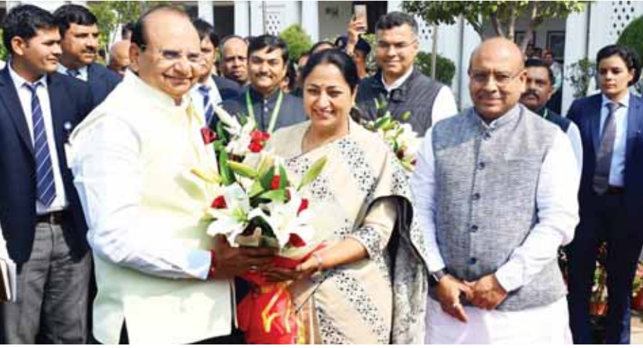
उपराज्यपाल को गुलदस्ता भेंट करती मुख्यमंत्री रेखा गुप्ता, साथ में विधानसभा अध्यक्ष विजेंद्र गुप्ता।

अभिभाषण में आप पर छोड़े तीखे बाण, भ्रष्ट व्यवस्था, विज्ञापन के मायाजाल से मुक्त कर सुदृढ़ व्यवस्था बनाएंगे