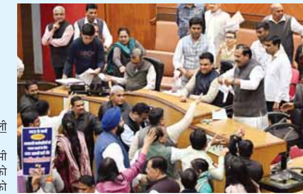
दिल्ली नगर निगम के सदन में मेयर के मंच पर नारेबाजी करते भाजपा पार्षद