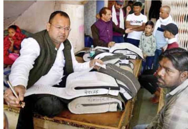
विवरण और आंकड़े भी साझा किए, जिसके तहत पिछले साल शुरू हुई परियोजना के तहत दो वर्षों की अर्धवर्ष में 300 मिलियन पृष्ठों का डिजिटलीकरण किया जाना है। भारतीय