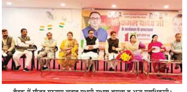
बैठक में मौजूद गुरुग्राम चुनाव प्रभारी सुभाष बराला व अन्य पदाधिकारी।

राज्यसभा सांसद एवं गुरुग्राम के चुनाव प्रभारी सुभाष बराला ने भाजपा कार्यालय गुरुग्राम में गुरुग्राम और मानेसर नगर निगम चुनाव को लेकर गुरुवार को वार्ड संयोजकों, महिला मोर्चा पदाधिकारियों के साथ बैठक