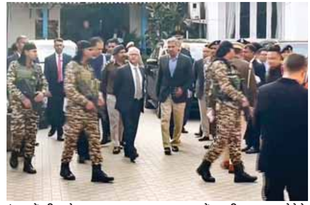
इंफाल में मणिपुर के राज्यपाल अजय कुमार भल्ला राज्य में राष्ट्रपति शासन लागू होने के बाद शीर्ष अधिकारियों के साथ बैठक के बाद।