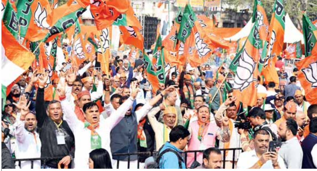
शपथ ग्रहण समारोह को देखने के लिए बृहस्पतिवार को हजारों भाजपा समर्थक रामलीला मैदान पहुंचे।