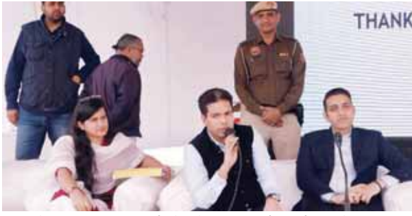
राजकीय कन्या महाविद्यालय में पीठासीन अधिकारियों को दो दिवसीय प्रशिक्षण सत्र में बोलते अधिकारी।