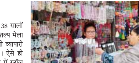
थाईलैंड की स्टाल पर खरीददारी करती हुई महिलाएं।

सूरजकुंड कोऐतिहासिक धरा पर विगत 38 सालों से आयोजित किए जा रहे अंतरराष्ट्रीय शिल्प मेला में देश के ही नहीं, अपितु विदेश के भी व्यापारी आकर खुद को भाग्यशाली समझते हैं। ऐसे ही थाईलैंड से आए थाई डीडी ग्रुप ने मेले में स्टॉल लगाए जाने से लेकर फ्री आवासीय सुविधाएं देने पर हरियाणा सरकार के प्रति कृतज्ञता प्रकट की है। हरियाणवी चौपाल के समीप एफसी-34 नंबर स्टाल पर थाईलैंड का श्रृंगार सामान खरीदने के लिए महिलाओं की भीड़ उमड़ रही है। यहां सुंदर-सुंदर ईयररिंग, हेयर क्लिप, रंग-बिरंगे हेयर बैंड, ब्रासलेट, लेडिज बैग, पर्स, हैट, फोन चार्ज, चैन, टी-शर्ट, खिलौने, मोबाइल कवर, अंगूठी आदि उत्पाद बेचे जा रहे हैं। बैंकाक व थाईलैंड के