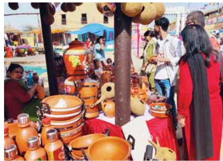
मिट्टी के बर्तनों की स्टाल पर खरीददारी करते लोग।

वाले कारीगरों के रोजगार में बढ़ोतरी हुई है। सरकार को यह मुहिम इस बार के मेले में सफलता की सीढ़ियां चढ़ती नजर आ रही है। फरीदाबाद व आस-पास के राज्यों से अनेक कारीगर इस बार सूरजकुंड मेले में मिट्टी से तैयार बर्तनों की स्टाल लगाए हुए हैं। शिल्प मेला में मिट्टी से तैयार यह बर्तन