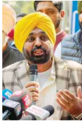
पंजाब के मुख्यमंत्री भगवंत मान मंगलवार को नई दिल्ली के काफ़ेथाला हाउस में पार्टी के राष्ट्रीय संयोजक अरविंद केजरीवाल के साथ बैठक के बाद संवाददाता सम्मेलन को संबोधित करते हुए

विधायकों के पलायन की खबरों के बीच आम आदमी पार्टी (आप) ने मंगलवार को दिल्ली में पंजाब के मुख्यमंत्री भगवंत मान और 91 विधायकों के साथ अरविंद केजरीवाल से मुलाकात की और पार्टी के भीतर आंतरिक कलह को अटकलों को खारिज करते हुए कहा कि पार्टी में 'सब ठीक है'। करीब एक घंटे तक चली बैठक के बाद मान और अन्य नेताओं ने केजरीवाल के पंजाब के मुख्यमंत्री बनने और पंजाब में करीब 35 विधायकों के टूटकर कांग्रेस में शामिल होने की संभावना को सिरे से खारिज कर दिया। मुख्यमंत्री ने कहा, 'हमारे विधायक पार्टी के राष्ट्रीय संयोजक अरविंद