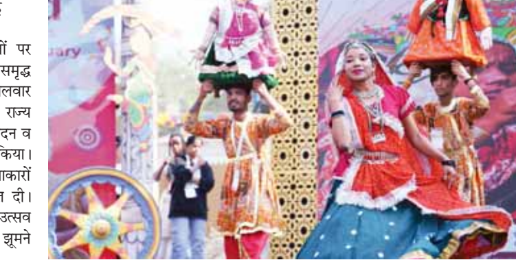
मेले की मुख्य व छोटी चौपाल पर सांस्कृतिक प्रस्तुतियां देते हुए कलाकार।

सूरजकुंड मेले की विभिन्न चौपालों पर देश-विदेश से आए कलाकार अपनी समृद्ध संस्कृति की छटा बिखेर रहे हैं। मंगलवार को छोटी-बड़ी चौपाल पर विभिन्न राज्य और देशों के कलाकारों ने गायन, वादन व नृत्य कला से पर्यटकों का मनोरंजन किया। मुख्य चौपाल पर मध्यप्रदेश के कलाकारों ने घनधोर नृत्य की शानदार प्रस्तुति दी। वहीं कोमोरोस से आए कलाकारों ने उत्सव नृत्य कर चौपाल में बैठे पर्यटकों को झूमने पर मजबूर कर दिया। थीम स्टेट ओडिशा के कलाकारों ने छऊ नृत्य की प्रस्तुति दी। यह नृत्य भारत का एक लोकप्रिय जनजातीय नृत्य है। यह नृत्य मार्शल आर्ट और लोक परंपराओं से प्रेरित है। वहीं असम से आए कलाकारों ने