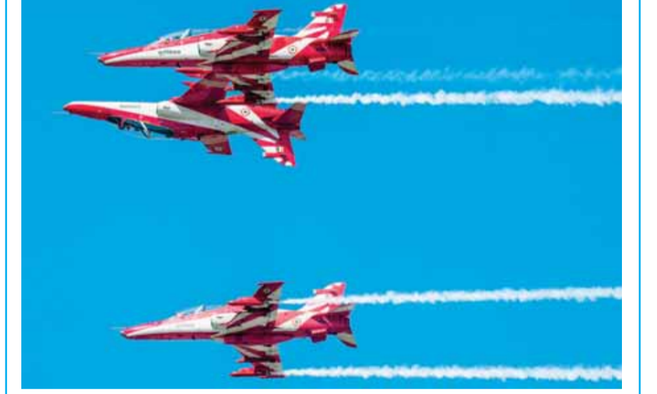
बैंगलुरु में भारतीय वायुसेना की एयरोबैटिक टीम सूर्य किरण ने मंगलवार को वेलहका एयरबेस पर एयरो इंडिया 2025 के 15वें संस्करण के दूसरे दिन प्रदर्शन किया।