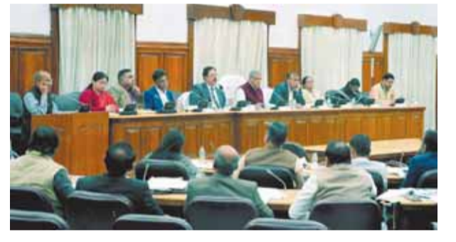
पर होने वाले वृक्षारोपण से संबंधित सभी व्यवस्थाएं समय से पूर्ण कर ली जायें। उन्होंने कहा कि वृक्षारोपण के लिए पौधशालाओं में उपयुक्त ऊंचाई के स्वस्थ एवं गुणवत्तापूर्ण पौध की उपलब्धता सुनिश्चित की जाय। अवैध कटान व अवैध शिकार में लिप्त असामाजिक, अवांछित, अपराधिक प्रवृत्ति के व्यक्तियों के विरुद्ध कठोर कार्यवाही करते हुए तथा अवैध कटान व अवैध शिकार के प्रकरणों की संख्या शून्य की जाये।

वन मंत्री ने कहा कि वर्ष 2015 से वर्ष 2024 तक 407186 हेक्टेअर भूमि पर वृक्षारोपण किया जा चुका है। इस वर्ष वन विभाग के लिए 80 हजार हेक्टेअर भूमि पर 12.60 करोड़ वृक्षारोपण का लक्ष्य है। अन्य विभागों के लिए भी अलग-अलग लक्ष्य निर्धारित किये गये हैं। व्यापक स्तर