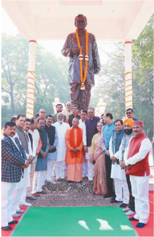
डबल इंजन सरकार पंडित उपाध्याय के सपनों को पूरा कर रही है। सीएम योगी ने कहा कि पंडित दीनदयाल

पंडित दीनदयाल उपाध्याय की पुण्यतिथि पर मुख्यमंत्री उनकी प्रतिमा पर माल्यार्पण कर दी श्रद्धांजलि