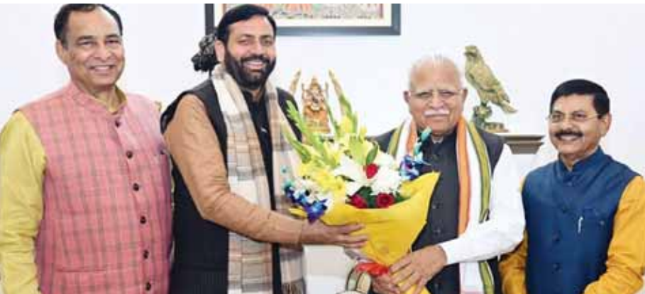
चंडीगढ़ में एक बैठक के दौरान केंद्रीय मंत्री मनोहर लाल का स्वागत करते मुख्यमंत्री नयब सिंह सैनी व अन्य।