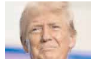
शेप बंधकों को रिहा नहीं किया गया तो तबाही आ जाएगी। ट्रंप ने कहा कि उन्हें

वाशिंगटन (पीटीआई) । अमेरिका के राष्ट्रपति डोनाल्ड ट्रंप ने कहा कि अगर हमास सभी बंधकों को शनिवार दोपहर तक रिहा नहीं करता है तो इजराइल और हमास के बीच हुआ संघर्षपराम समझौता रद्द कर दिया जाना चाहिए। ट्रंप ने पत्रकारों से बातचीत में कहा कि यह अंततः इजराइल पर निर्भर करता है। लेकिन उन्होंने चेतावनी दी कि अगर