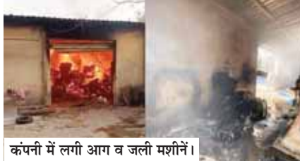
कंपनी में लगी आग व जली मशीनों।