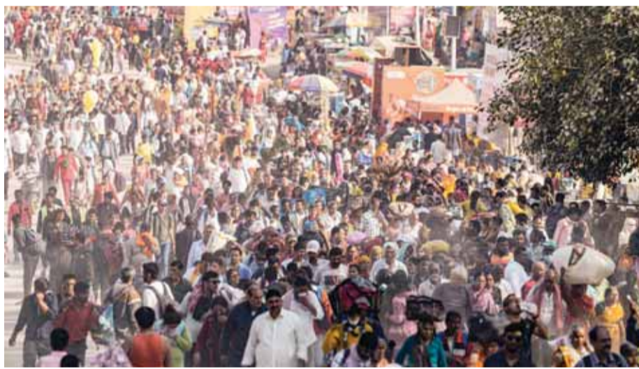
माघी पूर्णिमा की पूर्व संख्या पर प्रयागराज में श्रद्धालुओं की भीड़।