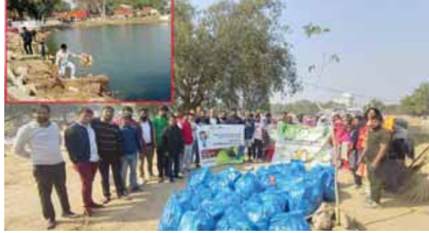
गांव बसई के तालाब से निकाली गई गंदगी व इनसेट में गंदगी निकालते स्वयंसेवक।