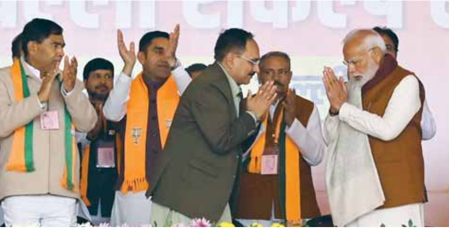
द्वारका स्थित डीडीए मैदान में रैली के दौरान प्रधानमंत्री नरेंद्र मोदी का स्वागत करते विरेंद्र सचदेवा।