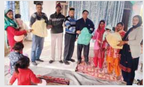
जरूरतमंदों को राशन व कंबल वितरित करते डेरा सच्चा सौदा के सेवादारा।