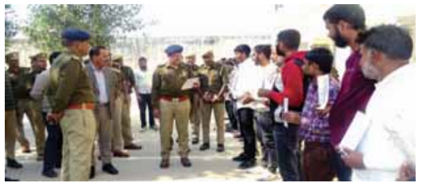
जिला कारागार में कैदियों से पूछताछ करते डीएम व एसपी।