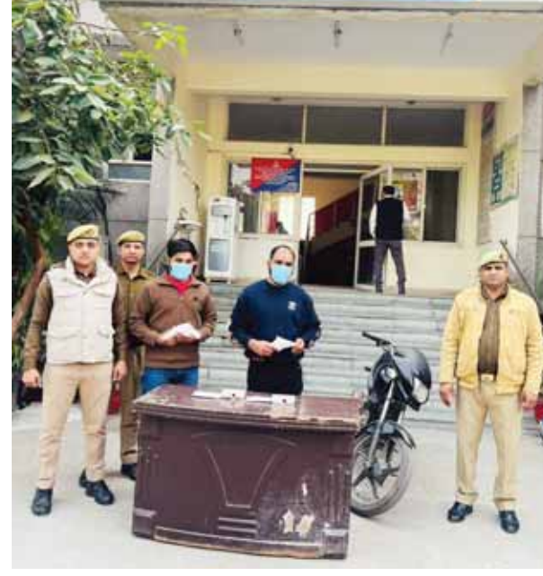
अवैध हथियार, मोटरसाइकिल के साथ दो आरोपी पुलिस गिरफ्त में।