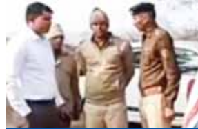
नहीं हो पाई शिनाख्त

घसीट कर फेंके जाने के मिले सबूत सुबह को घूमने निकले लोगों ने देखा पायनियर समाचार सेवा। फरीदाबाद ताजपुर गांव के जंगल में करीब एक 25 वर्षीय अज्ञात युवक का शव मिलने से सनसनी फैल गई। सुबह सैर के लिए एक ग्रामीणों को जंगल में शव दिखाई दिया, जिसके बाद पूरे इलाके में हड़कंप मच गया। मामले की सूचना मिलने पर पुलिस ने शव को अपने कब्जे में लेकर पोस्टमार्टम के लिए सिविल अस्पताल में भिजवा दिया है। वहीं मामले की जांच शुरू कर दी है।