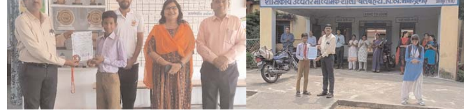
पायनियर संवाददाता < मनेन्द्रगढ़ www.dailypioneer.com

नित नए मुकाम हासिल कर रहा उच्चतर माध्यमिक विद्यालय बेलबहरा