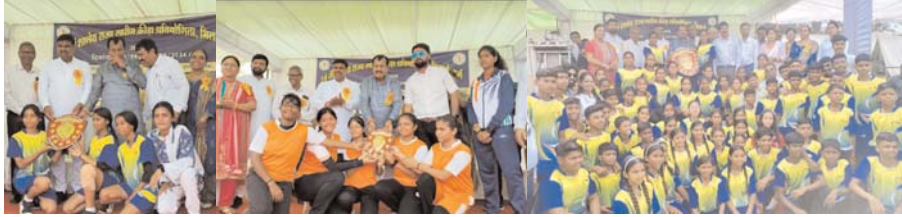
पायनियर संवाददाता < दुर्गा www.dailypioneer.com

पढ़ाई के साथ-साथ खेल का भी है महत्व : विधायक यादव