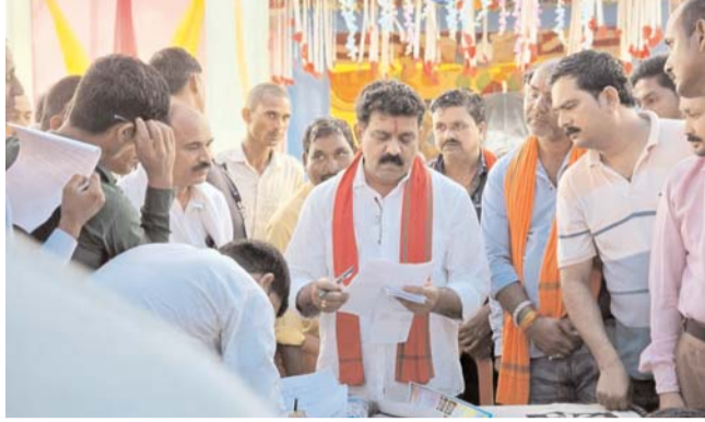
पायनियर संवाददाता < कवर्था www.dailypioneer.com

उपमुख्यमंत्री ने वनांचल क्षेत्रों का किया सघन दौरा, क्षेत्र विकास के लिए सौगातों की लगाई झड़ी