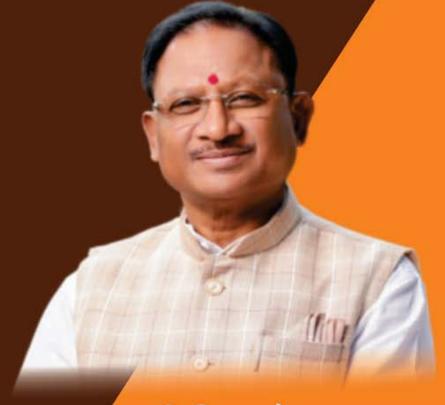
श्री विष्णु देव साय मुख्यमंत्री, छत्तीसगढ़