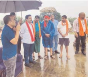
पायनियर संवाददाता < कवर्था www.dailypioneer.com