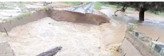
पायनियर संवाददाता राजनांदगांव/मानपुर www.dailypioneer.com

कोराचा-बुकमरका मार्ग स्थित गट्टेगहन नदी में बना पुल जमीदोज़ हो गया। लगातार बारिश से निर्मित बाढ़ के हालात के बीच पुल ध्वस्त हो जाने से मुश्किल हालात पैदा हो गए हैं। सड़क संपर्क टूटने से महाराष्ट्र सीमा पर धुर नक्सल प्रभावित बीहड़ इलाके संबलपुर गांव में स्थित पुलिस कैंप मुख्यालय से कट गया है। पुल के ध्वस्त हो जाने के बाद दो गांव समेत पुलिस कैंप से आवागमन पूर्णतः बंद हो गया है। नदी के उसपार पुलिस जवानों समेत ग्रामीण फंसे हुए हैं। जरूरतमंद ग्रामीण बाढ़ के हालात के बीच जान जोखिम में