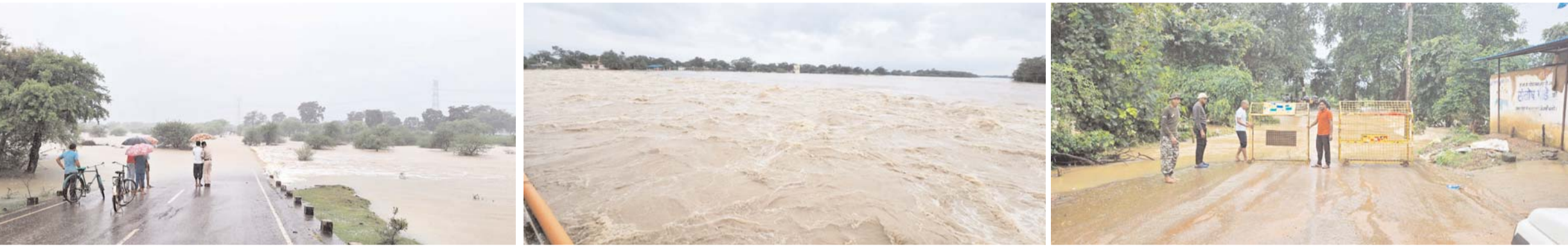
पायनियर संवाददाता राजनांदगांव www.dailypioneer.com

0 खैरागढ़ का संपर्क टूटा, मोहला-मानपुर जिले में भी ऐसे ही हालातए लगातार बारिश से बाढ़ की स्थिति दर्जनों गांव प्रभावित