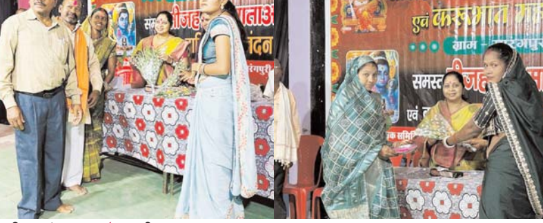
पायनियर संवाददाता < धमतरी www.dailypioneer.com

सारंगपुरी में करुभात व महिला सम्मान समारोह का आयोजन किया गया