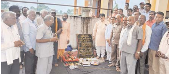
पायनियर संवाददाता < धमतरी www.dailypioneer.com