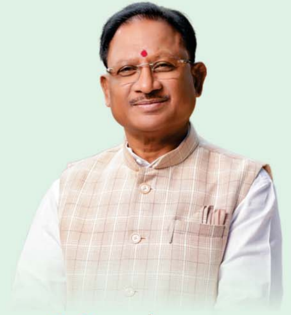
श्री विष्णु देव साय मुख्यमंत्री, छत्तीसगढ़