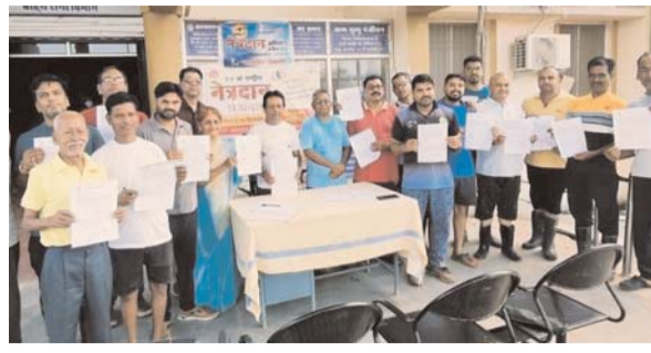
पायनियर संवाददाता < बेमेतरा www.dailypioneer.com

तक मोबाइल में व्यस्त रहें। लेकिन किसी भी पीडित किसानों के खेत में मौके पर उपस्थित होकर नुकसान का आकलन नहीं किया और यहां की रिपोर्ट निरंक बताई गई। जिस कारण से किसी भी किसान को बीमा का लाभ नहीं मिला है। किसानों में आगे बताया कि जबकि ग्राम के लगभग शत प्रतिशत किसानों ने रबी सीजन के बीमा कराया है। वहीं किसानों ने आगे अधिकारियों की बीमा कंपनी से साठगांठ का आरोप लगाया है। उक्त किसानों का कहना है कि बालोद जिले में बीमा प्रीमियम की राशि लगभग 11 करोड़ से अधिक जमा हुई है।