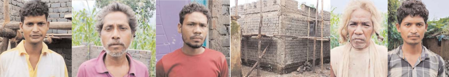
पायनियर संवाददाता < कवर्धा www.dailypioneer.com

पंडरिया विकासखंड के बीहड़ वनांचल ग्राम पंचायत कांदावानी में आवास निर्माण करना शासन प्रशासन के सामने बड़ी चुनौती था क्योंकि पूर्व में बहुत से लोगो ने आवास निर्माण करने के लिए हितग्राहियों को ठगा कर राशि लेकर गायब हो जाते थे लेकिन प्रधानमंत्री जनमन योजना के अंतर्गत स्वीकृत आवास को संपन्न सचिव और रोजगार सहायक ने व्यक्तिगत रुचि लेकर हितग्राहियों का सहयोग कर रहे हैं जिसके अंतर्गत जनजाति समुदाय के लोगो का पक्का बन रहा है। प्रधानमंत्री ने जनजाति समुदाय के लोगो को जनमन योजना के स्वीकृत किया जा चुका है। परिवारों के लिए को विभिन्न प्रकार की शासकीय योजनाओं से