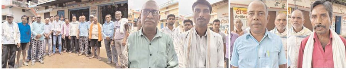
पायनियर संवाददाता < बालोद www.dailypioneer.com

बीमा कंपनियों से अधिकारियों की साठगांठ का किसानों ने लगाया आरोप