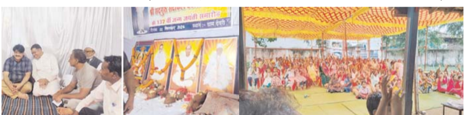
ही है। आप सब लोग भाग्यशाली हैं की अध्यात्म के रास्ते में चलकर भजन सत्संग जध्यान साधना करते हुए जीवन जी रहे हैं। इस दुनिया में जो अशांति फैली हुई है उसको शांति करने का उसको समाप्त करने का सिर्फ और सिर्फ भारत का आध्यात्मिक ज्ञान है। जिसको हम