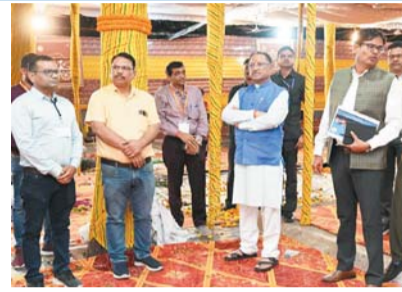
मुख्यमंत्री निवास में मुख्यमंत्री साय की पत्नी कौशल्या साय सजावट के साथ-साथ परंपरागत छत्तीसगढ़ी व्यंजनों के साथ ठेठ-खुर्मी बनाने की तैयारी भी करवा रही हैं। तीजा-पोरा तिहार से पहले मुख्यमंत्री साय अपने निवास से ही बटन दबाकर 70 लाख महिलाओं के खाते में महतारी

विष्णु भैया संग तीजा-पोरा महतारी वंदन तिहार के लिए मुख्यमंत्री विष्णु देव साय का रायपुर निवास सज-धज कर तैयार है। मुख्यमंत्री निवास में आज सुबह 11 बजे से 1 बजे तक तीजा-पोरा महतारी वंदन तिहार का आयोजन किया गया है। मुख्यमंत्री विष्णु देव साय ने अपने निवास पर तिहार की तैयारियों का जायजा लिया। उन्होंने अतिथियों की बैठक व्यवस्था, पूजा स्थल, मंच आदि व्यवस्थाएं देखीं। छत्तीसगढ़ की गौरवशाली परंपरा हरेली पर्व मनाने के बाद अब विष्णु भैया का घर यानी मुख्यमंत्री विष्णु देव साय का मुख्यमंत्री निवास तीजा-पोरा के पारंपरिक गौरव की झंकी तरह सज रहा है। मुख्यमंत्री निवास को मिट्टी के खूबसूरत नंदिया बड़ला और रंगीन खिलौनों से सजाया जा रही है। परंपरागत वंदनवार के रंग बिखरने लगे हैं।