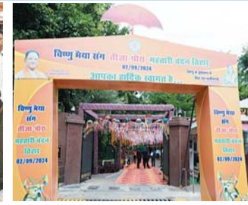
वंदन के एक-एक हजार रूपए भी भेजने वाले हैं। हरेली की तरह मुख्यमंत्री विष्णु देव साय के रायपुर स्थित निवास में तीजा-पोरा का तिहार आज सुबह 11 बजे से उत्साह के साथ मनाया जाएगा। इसके लिए मुख्यमंत्री निवास परिसर में छत्तीसगढ़ की परम्परा और रीति-रिवाज के अनुसार सज-सज्जा

की गई हैं। इस मौके पर नंदिया-बैला की पूजा की जाएगी। तीजा महोत्सव का आयोजन होगा। तीजा-पोरा तिहार के लिए कार्यक्रम में बहनों को आमंत्रित किया गया है। इस तरह महिलाओं के लिए मुख्यमंत्री निवास एक दिन के लिए मायका बन जाएगा। कार्यक्रम में विशेष रूप से महतारी वंदन योजना से लाभान्वित महिलाएं, महिला स्वसहायता समूहों की महिलाएं और मितानियों सहित लगभग 3 हजार महिलाओं को आमंत्रित किया गया है। इस अवसर पर महिलाओं के कल्याण के लिए किए जा रहे कार्यक्रम, योजनाओं से अवगत कराने हेतु प्रदर्शनी एवं स्टॉल भी लगाया गया है। महिलाओं के कल्याण की प्रचलित योजना एवं कार्यक्रम हेतु संस्कृति विभाग के माध्यम से सांस्कृतिक कार्यक्रम का आयोजन भी किया जाएगा।