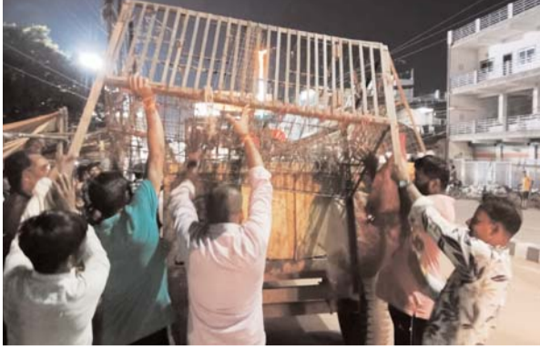
की टीम शहर के सभी पशु वध गृह एवं मांस मटन विक्रेता को दुकान बंद करने के लिए समझा दी गई थी। इसके

शुष्क दिवस के अवसर पर मास की बिक्री करने वालों पर धमतरी निगम प्रशासन ने सख्त कार्रवाई की है। इस दौरान उपयुक्त पीसी सार्वानों ने अभियान चलाकर कई दुकानों और स्थानों पर छापेमारी की जो लोग अवैध रूप से बेचते हुए पाए गए उनके खिलाफ जपती कार्रवाई की गई। इन अभियानों का मुख्य उद्देश्य शुष्क दिवस के नियमों का पालन सुनिश्चित करना था। गौरतलब है की 31 अगस्त पर्युषण पर्व प्रथम दिवस पर शुष्क दिवस घोषित की गई थी जिसके परिपालन में सुबह से ही निगम