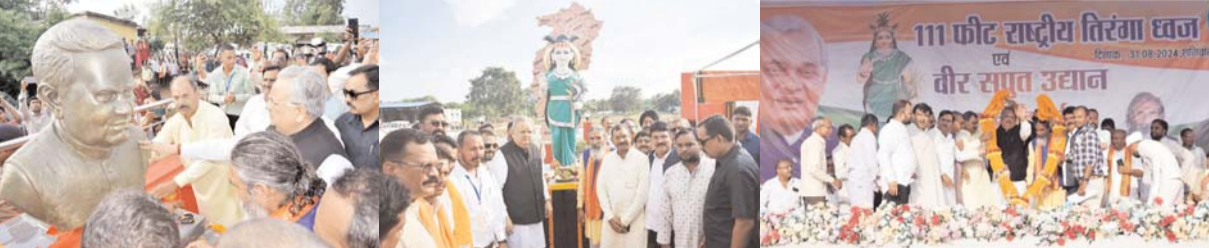
पायनियर संवाददाता < बालोद www.dailypioneer.com

ग्राम कुरदी में 111 फीट राष्ट्रीय ध्वज तिरंगा एवं वीर सपूत उद्यान सहित विभिन्न विकास कार्यों का किया लोकार्पण