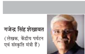
गजेन्द्र सिंह शेखावत (लेखक, केंद्रीय पर्यटन एवं संस्कृति मंत्री हैं)

इस देश के इतिहास में यह पहली बार हुआ है कि हमारे बीच एक ऐसे नेता हैं जो न केवल हमारे प्रधानमंत्री हैं बल्कि वे अतुल्य भारत के सबसे बड़े वैश्विक ब्रांड एम्बेसडर और हिमायती हैं।