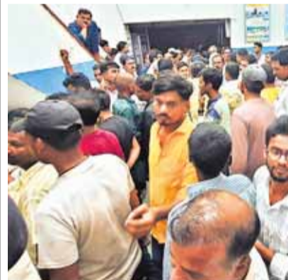
बिहार के औरंगाबाद जिले में जीवितपुत्रिका त्योहार के दौरान नदियों और तालाबों में पवित्र स्नान करते समय अपने परिवार के सदस्यों के डूबने के बाद सरकारी अस्पताल में इकट्ठा लोग।