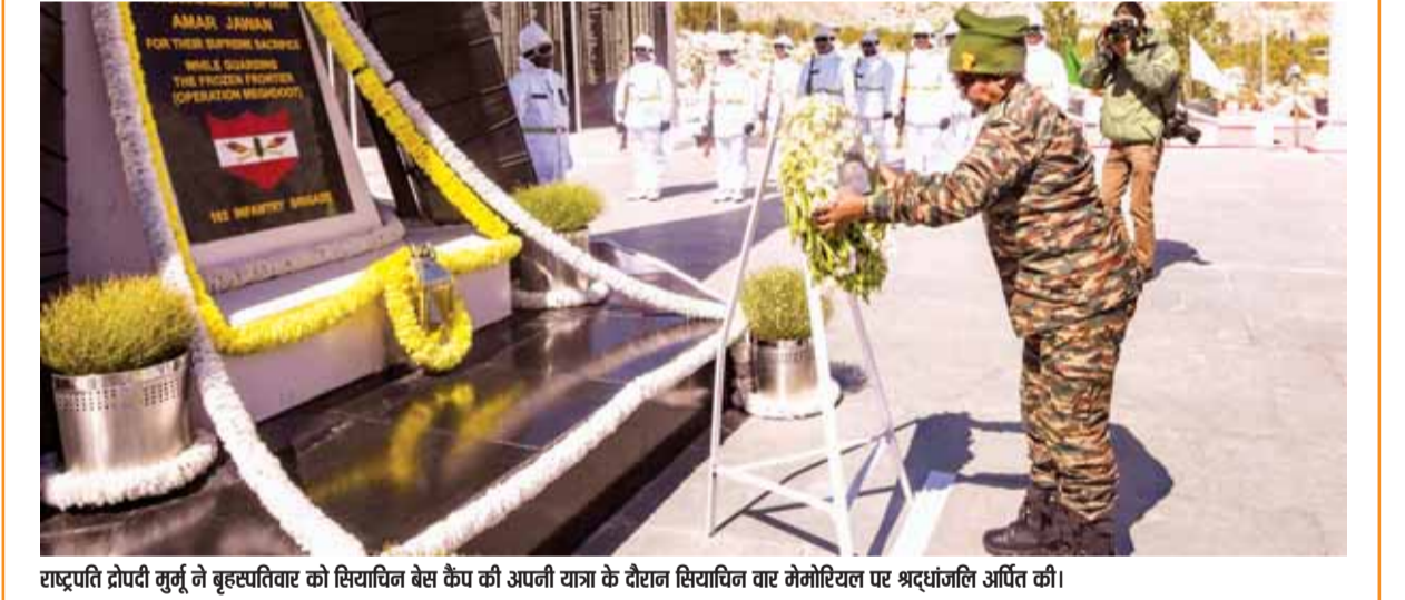
राष्ट्रपति द्रोपदी मुर्मु ने बृहस्पतिवार को सियाचिन बेस कैम्प की अपनी यात्रा के दौरान सियाचिन वार मेमोरियल पर श्रद्धांजलि अर्पित की।