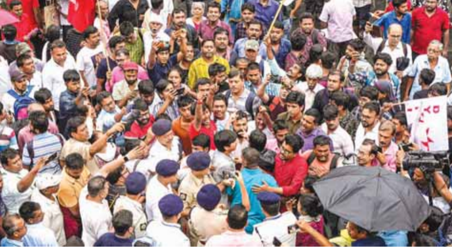
कोलकाता में बृहस्पतिवार को महिला डॉक्टर से रेप और हत्या के विरोध में प्रदर्शन के दौरान वामपंथी दलों के कार्यकर्ताओं और पुलिस कर्मियों में झड़प हुई।