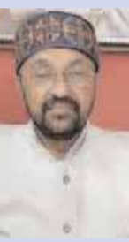
योगेन्द्र उपाध्याय उच्च शिक्षा मंत्री, उत्तर प्रदेश

शोध और अनुसंधान शिक्षा का आधार स्तंभ हैं और प्रदेश सरकार का यह कदम राज्य के विश्वविद्यालयों में शोध और नवाचार को गति प्रदान करने के लिए एक महत्वपूर्ण प्रयास है। इससे हमारे शिक्षण संस्थानों में न केवल शोध की दिशा में नई ऊर्जा का संचार होगा, बल्कि छात्रों को भी विश्वस्तरीय शोध वातावरण उपलब्ध कराने की दिशा में यह एक अहम कदम है। सरकार आगे भी प्रदेश के विश्वविद्यालयों को हरसंभव सहायता प्रदान करती रहेगी, ताकि वे शोध और नवाचार में सर्वोत्तम प्रदर्शन कर सकें।