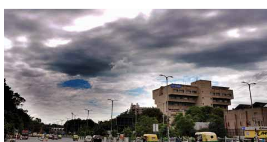
इस साल लगभग 20 प्रतिशत अधिक है। पिछले कुछ दिनों से दिल्ली में हो रही मूसलाधार बारिश ने राष्ट्रीय राजधानी में सितंबर में वार्षिक और मौसमी औसत बारिश को पार कर लिया है। भारतीय मौसम विज्ञान

मानसून के जाने में दो सप्ताह बाकी हैं। आंकड़ों पर नजर डालने से पता चलता है कि पूर्वी और उत्तर-पूर्वी उप-मंडल में 1233.9 मिमी की सामान्य बारिश के मुकाबले 1047 मिमी बारिश हुई है, जो अब तक 15 प्रतिशत कम है। जम्मू-कश्मीर, लद्दाख सहित उत्तर-पश्चिम भारत में 552.5 मिमी की सामान्य बारिश के मुकाबले 590.9 मिमी बारिश हुई है, जो इस मौसम में लगभग 7 प्रतिशत अधिक है। मध्य भारत में 906.8 मिमी की सामान्य बारिश के मुकाबले 1068.5 मिमी बारिश हुई, जो अब तक 18 प्रतिशत अधिक है। दक्षिण प्रायद्वीप में 631.5 मिमी की सामान्य बारिश के मुकाबले 759.8 मिमी बारिश हुई, जो