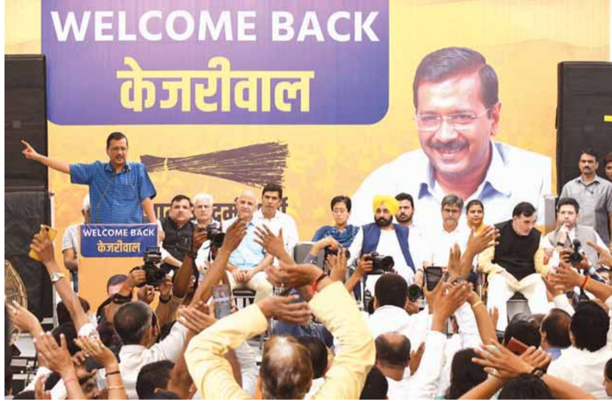
नई दिल्ली में पार्टी कार्यकर्ताओं की बैठक के दौरान दिल्ली के मुख्यमंत्री अरविंद केजरीवाल और आप के अन्य नेता कार्यकर्ताओं का अभिवादन करते हुए।

आम आदमी पार्टी के मुख्यालय में पार्टी कार्यकर्ताओं को संबोधित करने अरविंद केजरीवाल ने मांग की कि दिल्ली विधानसभा के चुनाव महाराष्ट्र के साथ फरवरी 2025 के बजाय नवंबर 2024 में कराए जाएं। उन्होंने बड़ा ऐलान करते हुए कहा कि आज से दो दिन बाद वह मुख्यमंत्री पद से इस्तीफा देने जा रहा हूँ और तब तक सीएम की कुर्सी पर नहीं बैठेंगे जब तक जनता मुझे इमानदारी का प्रमाण पत्र नहीं दे देती। जेल से बाहर आने के बाद अग्निपरीक्षा देना चाहते हैं। उन्होंने सभी राज्य के मुख्यमंत्रियों से अनुरोध किया कि वे किसी भी स्थिति में इस्तीफा न दें और जेल से ही सरकार चलाएँ। सूत्रों का कहना है कि उनके इस्तीफे ने कई लोगों को चौंका दिया, लेकिन यह फैसला उतना अप्रत्याशित नहीं हो सकता जितना लगता है क्योंकि सुप्रीम कोर्ट ने उन्हें गत शुक्रवार को जमानत दे दी, लेकिन कई शर्तों के साथ, जो उपराज्यपाल को अधिक अधिकार देती हैं। इनमें सबसे महत्वपूर्ण प्रतिबंध उनके मुख्यमंत्री कार्यालय जाने पर प्रतिबंध, आधिकारिक फायलों पर हस्ताक्षर नहीं करना। अगर जरूरी है हस्ताक्षर करना तो उपराज्यपाल की मंजूरी लेना होगा। उन्हें दिल्ली सचिवालय में प्रवेश करने से भी रोक दिया गया है। इस आश्चर्यजनक फैसले ने सभी को हैरान कर दिया है कि दिल्ली का