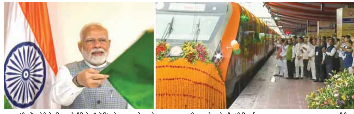
प्रधानमंत्री नरेंद्र मोदी ने रविवार को वीडियो कॉन्फ्रेंसिंग के द्वारा जमशेदपुर में टाटानगर-घटना वंदे भारत ट्रेन को हरी झंडी दिखाई।