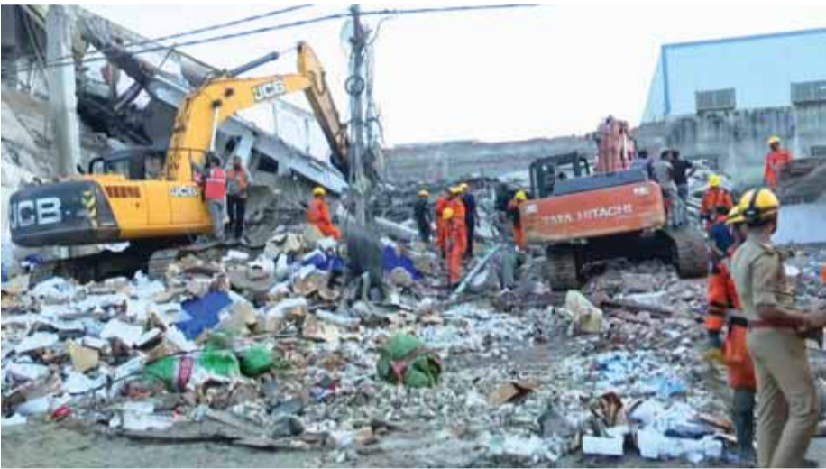
धराशायी इमारत का मलबा हटाने हुए राहतकर्मी

लखनऊ। मुख्यमंत्री योगी आदित्यनाथ ने सरोजनीनगर हादसे की जांच के लिए रविवार को तीन सदस्यीय समिति का गठन किया। इसमें गृह सचिव को अध्यक्ष नियुक्त किया गया है।