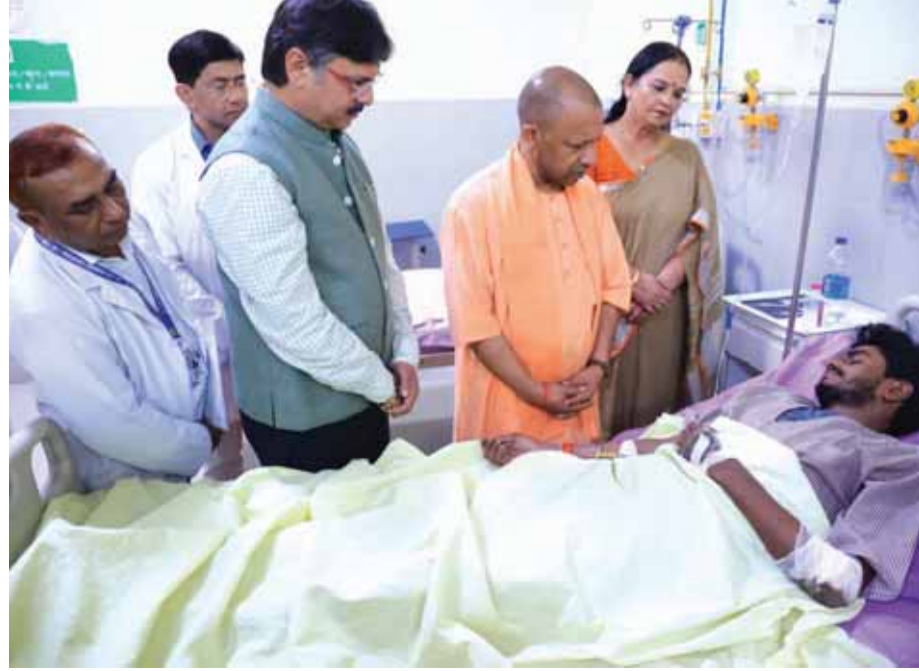
लखनऊ के ट्रान्सपोर्ट नगर हाटसे गैंग वाला व्यक्ति का अस्पताल जाकर हालचाल लेते मुख्यमंत्री योगी आदित्यनाथ समाचार पृष्ठ 3

मुख्यमंत्री योगी आदित्यनाथ ने कहा कि सरकार चलाने के लिए दिल, दिमाग और जज्बा चाहिए होता है। सत्ता विरासत में मिल सकती है, लेकिन बुद्धि विरासत में नहीं मिलती है। जो लोग सत्ता को अपनी बंपौती मानते थे, उन्हें भी पता चल गया है कि अब वो उत्तर प्रदेश में वापस नहीं आ पाएंगे, इसलिए षड्यंत्र रच रहे हैं। सीएम योगी ने प्रदेश के युवाओं का आह्वान करते हुए कहा कि सरकारी नौकरियों की तैयारी शुरू कर दीजिए,