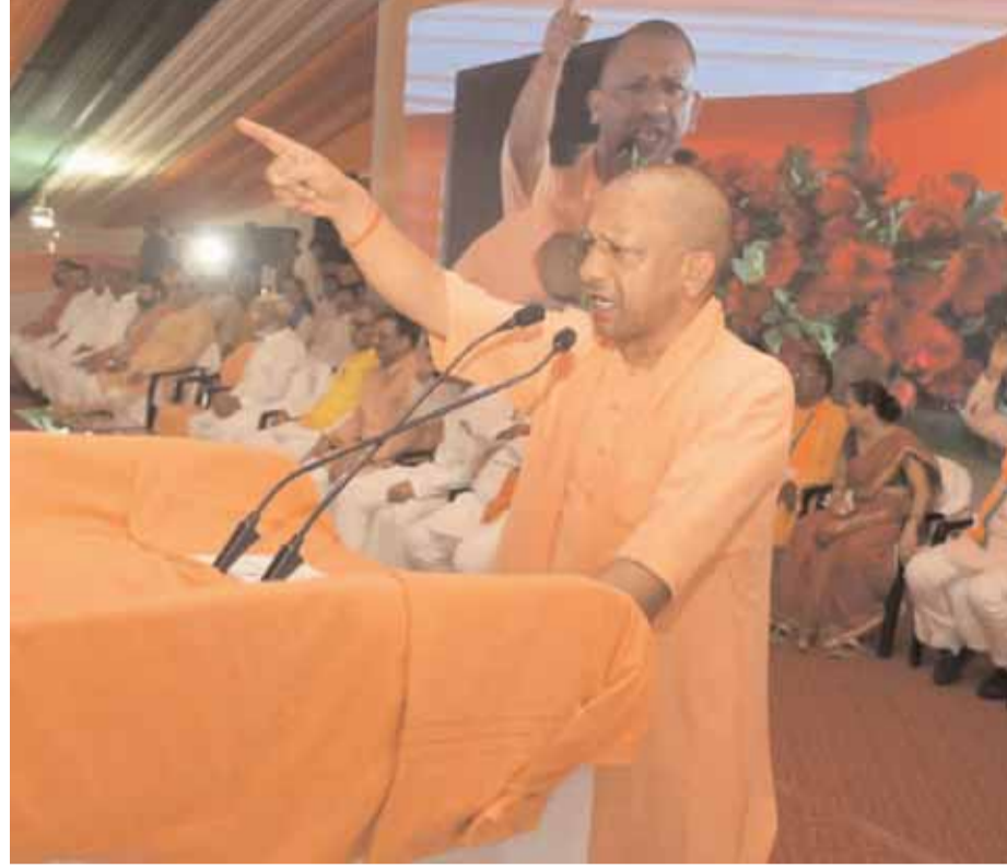
सीएम योगी ने कहा कि प्रदेश के युवा अपना उद्योग लगाएं हमारी सरकार पहले चरण में पांच लाख तो दूसरे चरण में 10 लाख रुपये का

उत्तर प्रदेश में राशन की सुविधा का लाभ मिल रहा है। 56 लाख गरीबों को मकान मिला है। 10 करोड़ लोगों को आयुष्मान भारत योजना के अंतर्गत मुफ्त इलाज की सुविधा दी