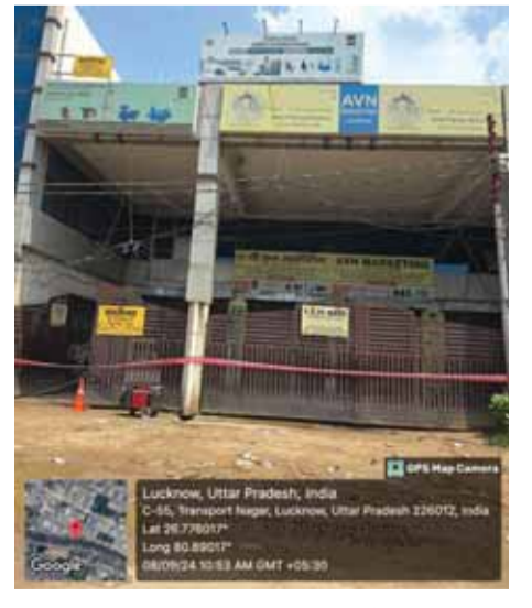
थाना सरोजनी नगर पुलिस ने मुकदमा दर्ज कर मामले की जांच में जुट गई है। ट्रांसपोर्ट नगर चौकी इंचार्ज के अनुसार सी.54 नियर पीतान्बर डायनोस्टिक सेंटर ट्रांसपोर्ट नगर कानपुर रोड लखनऊ स्थित एक व्यावसायिक बिल्डिंग अचानक गिर गई।