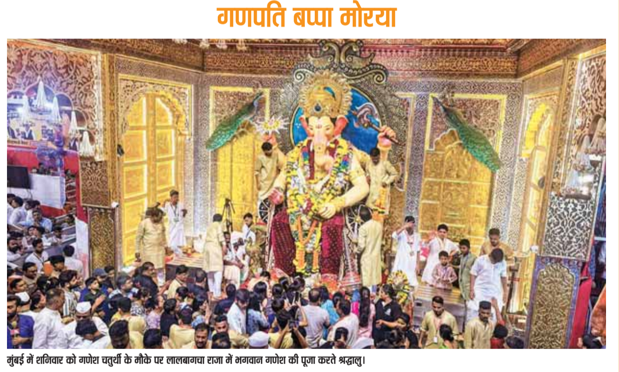
मुंबई में शनिवार को गणेश चतुर्थी के मौके पर लालबाबाया राजा में भगवान गणेश की पूजा करते श्रद्धालु।

अधिकारी ने कहा कि हत्या के बाद, जिला प्रशासन मुख्यालय से लगभग सात किमी दूर पहाड़ियों में संघर्षी समुदायों के लोगों के बीच भारी गोलीबारी हुई, जिसमें तीन पहाड़ी आतंकवादियों सहित चार सशस्त्र व्यक्तियों की मौत हो गई। इस सप्ताह की शुरुआत में जिरिबाम जिले में ताजा आगजनी हुई जब संदिग्ध 'ग्राम स्वयंसेवकों' ने बोरोबेकरा पुलिस स्टेशन क्षेत्र के जंकराधोर में एक सेवानिवृत्त पुलिस अधिकारी के तीन कमरों के परिव्यक्त घर को जला दिया। जनजातीय निकाय डॉइजिनल ट्राइब्स एडवोकेसी कमिटी (फेरजॉल और जिरिबाम) ने घटना में किसी भी तरह की संलिप्तता से इनकार किया है। (शेष पृष्ठ 9)