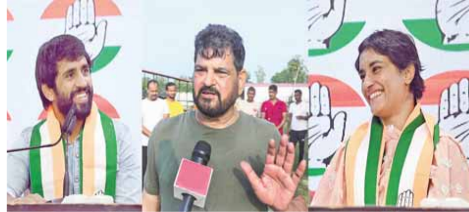
(बाएं से दाएं) बजरंग पुनिया, बृजभूषण सिंह और विनेश फोगाट