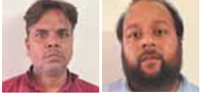
एवं उनके खाते से लगभग 2 करोड़ से अधिक का पैसा विभिन्न खातों में ट्रांसफर कर लिया गया। जब इनको इस बात का एहसास हुआ कि भरे साथ टगी की घटना हो गयी है तब इनके द्वारा थाना साइबर क्राइम, लखनऊ में अभियोग पंजीकृत कराया गया।