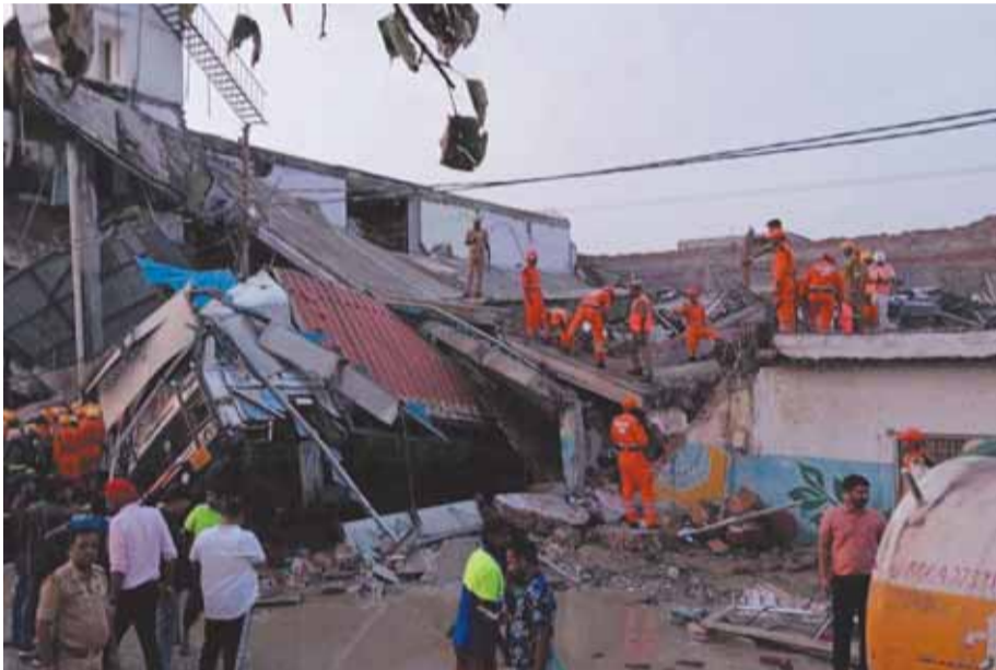
तीन मंजिला भवन गिरने के बाद राहत और बचाव कार्य में लगे पुलिस और एनडीआरएफ के कर्मी

राजधानी लखनऊ में शनिवार की शाम उस वक्त बड़ा हादसा हो गया जब सरोजनीनगर थाना क्षेत्र के ट्रांसपोर्ट नगर में एक तीन मंजिला बिल्डिंग अचानक भरभरा कर गिर गई। बिल्डिंग गिरते ही पूरी तरह मलबे में तब्दील हो गई। इस बिल्डिंग में कई दवा कंपनियों के गोदाम थे। हादसे के दौरान कई मजदूर गोदाम में मौजूद थे, जो मलबे में दब गए। इस दर्दनाक हादसे में पांच लोगों की मौत हो गई जबकि करीब दो दर्जन घायल हुए हैं। घटना की जानकारी होते ही पुलिस-प्रशासन में हड़कंप मच गया। मुख्यमंत्री योगी आदित्यनाथ ने घटना का संज्ञान लिया और उनके निर्देश पर आनन-फानन आनन-फानन में आला पुलिस अधिकारी और एनडीआरएफ मौके पर पहुंची। घायल लोगों का रेस्क्यू प्रारंभ किया गया। अब तक 28 लोगों को निकाला जा चुका है, जिसमें से पांच लोगों की मौत हो चुकी है। बाकी घायलों को लोकबन्धु अस्पताल और केजीएमयू में भर्ती कराया गया है। जानकारी के अनुसार शहीद पथ से चंद कदम दूर स्थित ट्रांसपोर्ट नगर