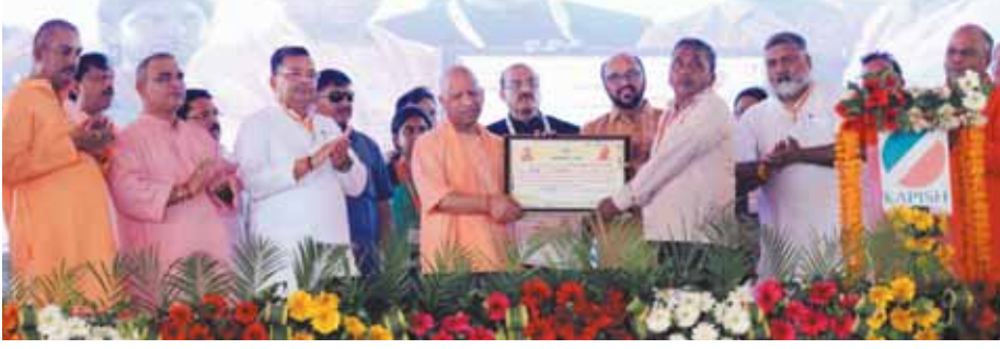
● कहा: अराजकता और गुंडागर्दी सपाइयों के डीएनए में है, इनका मॉडल विकास का नहीं बल्कि लूट का

मैनपुरी के करहल विधानसभा क्षेत्र में मंगलवार को आयोजित पौने चार सौ करोड़ रुपए की परियोजनाओं का लोकार्पण व शिलान्यास कार्यक्रम में सीएम योगी समाजवादी पार्टी पर जमकर हमलावर रुख अपनाते हुए दिखे। कार्यक्रम में युवाओं को मोबाइल व लैपटॉप देने, महिला स्वयं सेवी समूहों को चेक देने के साथ ही उन्होंने मैनपुरी की जनता से जात पात की राजनीति को भुलाकर राष्ट्र निर्माण व विकास कार्यों को बढ़ावा देने में आगे आने का आह्वान किया। समाजवादी पार्टी के खिलाफ सख्त रुख अपनाते हुए सीएम योगी ने कहा कि मैं पूछना चाहता हूँ कि मैनपुरी जो कभी वीवीआईपी जनपद माना जाता था फिर भी विकास के कार्य में क्यों पिछड़ गया। उन्होंने कहा कि मैनपुरी तो मयन, मार्कण्डेय, च्यवन जैसे हमारे महान ऋषियों की धरती रही है।