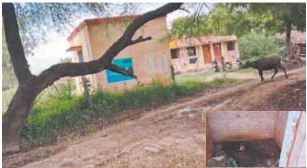
ककराली गांव का सुलभ शौचालय बंद अवस्था में झूलते हैं शौचालय के अंदर का दृश्य

संडौला (हरदोई)। केन्द्र और प्रदेश सरकार की स्वच्छ भारत मिशन योजना के अंतर्गत ग्रामीण क्षेत्रों में सफाई और स्वच्छता के लिए खर्च किए गए लाखों रुपयों के बावजूद लगातार इसकी ध्वजियां उड़ाने का काम चल रहा है। नबावए गए सुलभ शौचालय पशुओं के आश्रय स्थल बन गए हैं। एक उदाहरण ग्राम सभा ककराली में लाखों रुपए खर्च करके निर्मित किया गया सुलभ शौचालय निष्प्रयोज्य हालत में पड़ा है। इस तक जाने के लिए बना मार्ग काफी टूटा पूरा तथा कीचड़ और कड़े पानी से भरा हुआ है और जहां कहीं वह मार्ग चलने लायक है वहां जानवर बंधे हुए हैं। अंतर जाने पर इस सुलभ शौचालय की दैनिय स्थिति दिखाई देती है। चारों तरफ भीषण गंदगी का अन्वार है। सीटें टूट फूट चुकी हैं। गंदगी देखकर ऐसा लगता है कि वर्षों