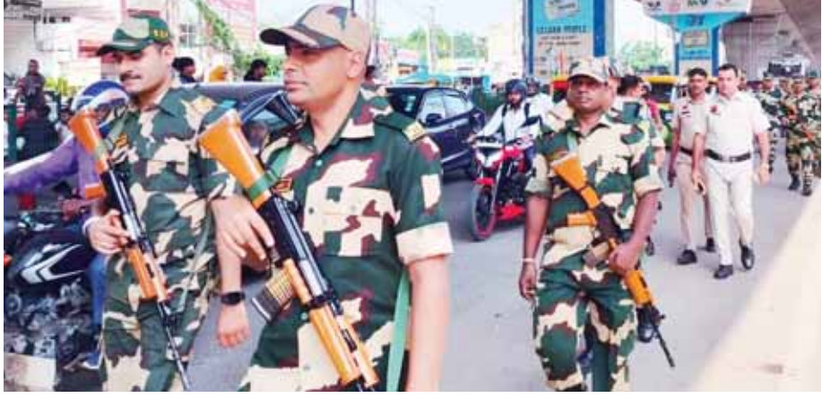
गुरुग्राम में विधानसभा चुनाव के मद्देनजर मार्च करते सेना व पुलिस के जवान।

गुरुग्राम के दक्षिण पुलिस जोन के एरिया में गुरुग्राम पुलिस व बीएसएफ की टुकड़ियों द्वारा सुरक्षा सम्बन्धी व समन्वय स्थापित करने के लिए डोमिनेशन और इन्फोसमेंट एक्सरसाइज की गई। इस डोमिनेशन और इन्फोसमेंट एक्सरसाइज में शामिल हुई गुरुग्राम पुलिस व बीएसएफ की टुकड़ियों द्वारा पुलिस जोन दक्षिण में थाना बादशाहपुर के क्षेत्र में मुख्य बाजार बादशाहपुर, नूरपुर, अकलीमपुर, टिकली, गैतपुर बास, सकतपुर, पलड़ा से ट्यूलिप चौक, एसीपीआर रोड से फाजिलपुर पर डोमिनेशन और इन्फोसमेंट एक्सरसाइज की गई। इस एरिया डोमिनेशन और इन्फोसमेंट एक्सरसाइज में थाना बादशाहपुर की पुलिस टी बीएसएफ के विभिन्न अधिकारियों/कर्मचारियों ने हिस्सा लिया।