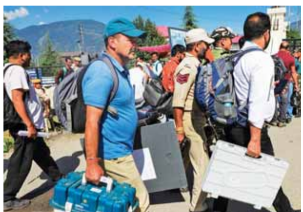
जम्मू-कश्मीर विधानसभा चुनाव के पहले चरण की पूर्व संख्याएं व मंगलवार को किरतवाड़ जिले में मतदान अधिकारी अपने-अपने मतदान केंद्रों के लिए रवाना हुए।