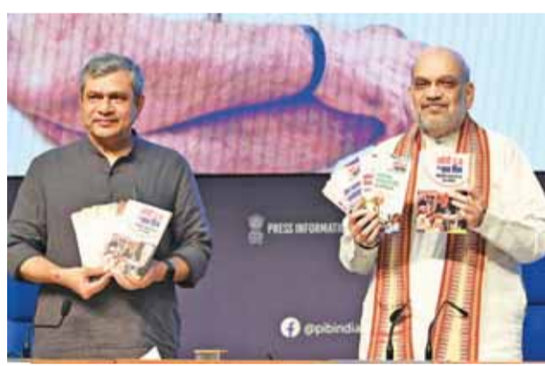
राष्ट्रीय राजधानी में मंगलवार को मोदी सरकार के तीसरे कार्यकाल के पहले 100 दिनों की उपलब्धियों पर केंद्रीय गृह मंत्री अमित शाह और देश मंत्री अश्विनी वैष्णव एक विशेष पुस्तिका का विमोचन करते हुए।

केंद्रीय गृह मंत्री अमित शाह ने मंगलवार को कहा कि सरकार मणिपुर में स्थायी शांति के लिए मेइती और कुकी दोनों समुदायों से बातचीत कर रही है और उसने घुसपैठ रोकने के लिए म्यांमा से लगती देश की सीमा पर बाड़ लगाया शुरू कर दिया है। उन्होंने यह भी कहा कि भाजपा के नेतृत्व वाली एनडीए सरकार अपने मौजूदा कार्यकाल में एक राष्ट्र, एक चुनाव को लागू करेगी। प्रधानमंत्री नरेंद्र मोदी के नेतृत्व वाली राष्ट्रीय जनतांत्रिक गठबंधन (राजग) सरकार के तीसरे कार्यकाल के 100 दिन पूरे होने पर आयोजित संवादादाता सम्मेलन में शाह ने कहा कि पिछले सप्ताह तीन दिनों की हिंसा को छोड़ दिया जाए तो मणिपुर में स्थिति कुल मिलाकर शांतिपूर्ण रही है और सरकार अशांत पूर्वोत्तर राज्य में शांति बहाल करने के लिए काम कर रही है। इस मौके पर शाह के साथ सूचना एवं प्रसारण मंत्री अश्विनी वैष्णव भी थे। शाह ने कहा कि तीन दिन की हिंसा के अलावा पिछले तीन महीने में कोई बड़ी घटना नहीं हुई। उन्होंने कहा, पिछले तीन दिन से शांति है और मुझे उम्मीद है कि हम स्थिति को नियंत्रित कर लेंगे। हम