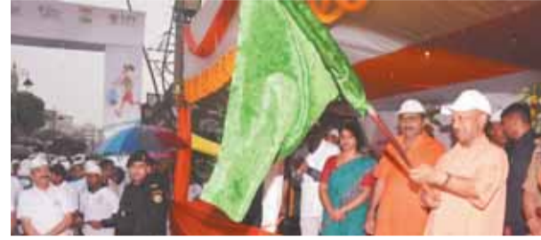
पायनियर समाचार सेवा। लखनऊ वाराणसी