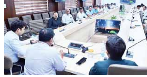
गुरुग्राम में अधिकारियों व राजनीतिक दलों के प्रतिनिधियों के साथ बैठक करते गुडगांव व बादशाहपुर विधानसभा क्षेत्र के लिए नियुक्त सामान्य पर्यवेक्षक।