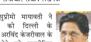
पायनियर समाचार सेवा। लखनऊ

बसपा सुप्रीमो मायावती ने मंगलवार को दिल्ली के मुख्यमंत्री अरविंद केजरीवाल के इस्तीफा देने को राजनीतिक पैंतरेबाजी करार दिया है। उन्होंने कहा कि केजरीवाल का यह फैसला जनहित और जनकल्याण से दूर एक चुनौती वाला है। उन्होंने कहा कि केजरीवाल के इतने लंबे समय तक जेल में रहने के कारण दिल्ली की जनता ने जो अनगिनत असुविधाएं व समस्याएं झेली हैं उसका क्या? उसका हिसाब कौन देगा? मायावती ने आगे लिखा कि सत्ता व विपक्ष के बीच राजनीतिक लड़ाई शत्रुता स्तर तक कटू नहीं हो तो बेहतर ताकि उससे देश व जनहित प्रभावित ना हो।