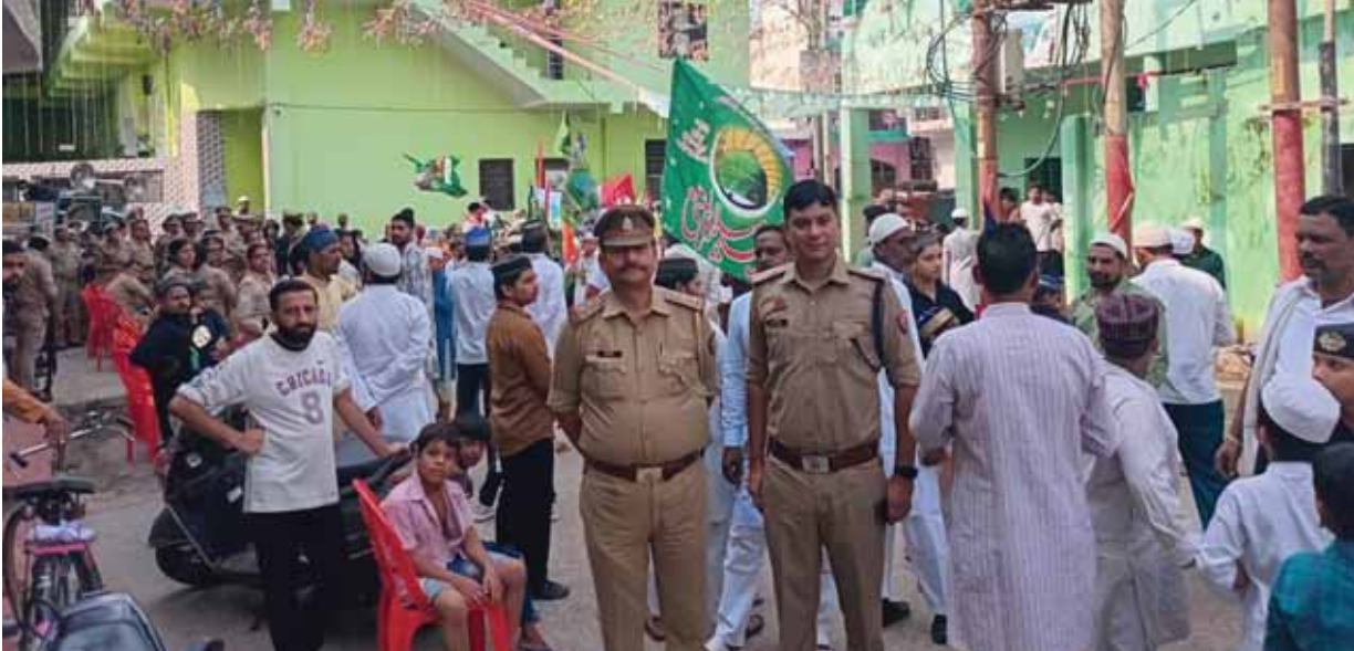
बावाफात जुलूस की सुरक्षा एवं शांति व्यवस्था बनाये रखने के लिए थाना सूरजपुर क्षेत्र के अंतर्गत गश्त करते पुलिस अधिकारी।