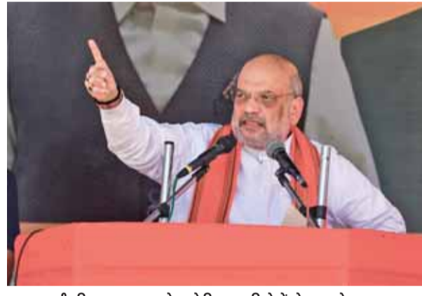
जम्मू-कश्मीर विधानसभा चुनाव से पहले किरतवाड़ जिले में सोमवार को एक जनसभा को संबोधित करते केंद्रीय गृह मंत्री अमित शाह।