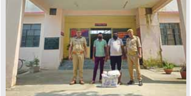
अवैध शराब तस्क़र गिरफ्तार, कब्जे से 81 पब्ले यूपी मार्का जब