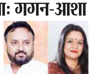
पायनियर समाचार सेवा। गुरुग्राम

● भाजपा से निष्कासित करने पर दोनों नेताओं ने दी प्रतिक्रिया