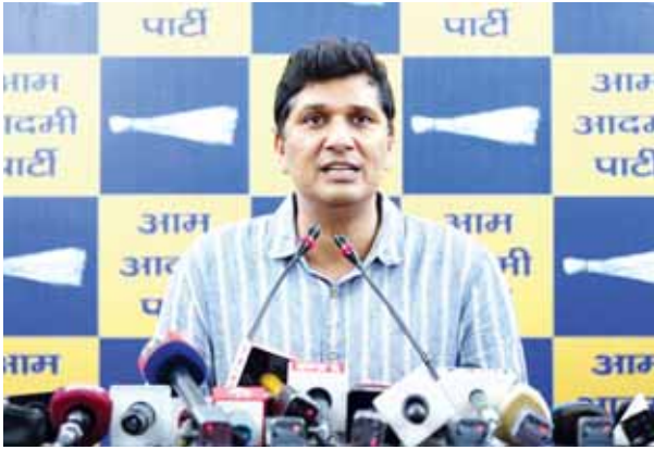
संवाददाताओं को जानकारी देते आम आदमी पार्टी के नेता सौरभ भारद्वाज।

मंत्री सौरभ भारद्वाज ने सोमवार को संवाददाता सम्मेलन में कहा कि केजरीवाल मंगलवार को मुख्यमंत्री पद से इस्तीफा दे देंगे और उसके बाद उनके स्थान पर नए चेहरे के चयन की प्रक्रिया शुरू होगी। 'आप' की पीएसी की बैठक में केजरीवाल ने नए मुख्यमंत्री पर एक-एक नेताओं से