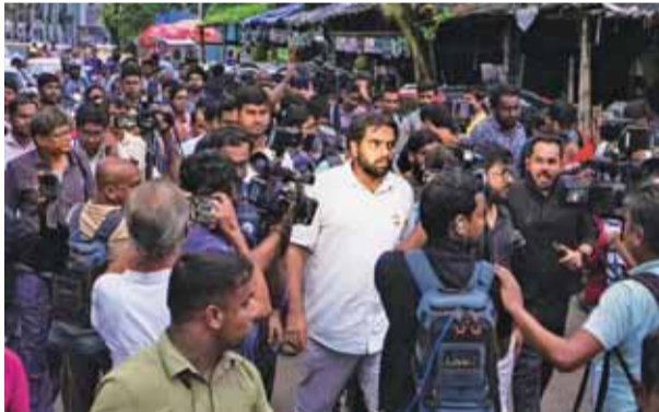
कोलकाता में सोमवार को जूनियर डॉक्टरों का एक प्रतिनिधिमंडल पश्चिम बंगाल की मुख्यमंत्री ममता बनर्जी से उनके कालीघाट स्थित आवास पर मिलाने के लिए स्वास्थ्य गवन के पास आगे धरना स्थल से बस में सवार होने के लिए आगे बढ़ता हुआ।

सरकारी पक्ष ने डॉक्टरों से कहा कि चूंकि वरिष्ठ अधिकारियों के खिलाफ प्रशासनिक कार्रवाई सहित कुछ निर्णय कुछ प्रक्रियाओं के बाद ही लिए जा सकते हैं, इसलिए ऐसे मुद्दों पर बाद में विचार किया जा सकता है। क्या डॉक्टर जो हड़ताल