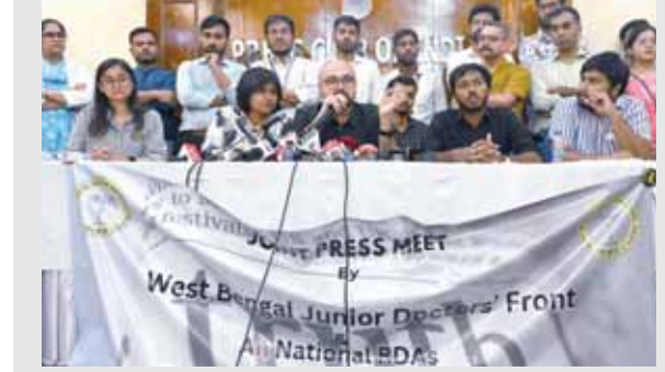
प्रेस क्लब में संवाददाता सम्मेलन को संबोधित करते चिकित्सक।