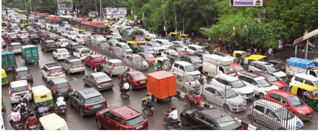
नई दिल्ली में इगनाइन बारिश और खानपुर मेट्रो के काम के चलते पंचशील से शेख सराय रोड तक लंबा जाम लग गया और यातायात प्रभावित रहा।

लोगों को अपने काम पर जाने में यातायात जाम का सामना करना पड़ा। साथ ही निचले इलाकों में जलभराव में भी फंसना पड़ा। बुधवार देर रात से हो रही मूसलाधार बारिश के अलावा, प्रमुख सड़कों पर बसों के खराब होने से गुरुवार को सुबह और शाम को व्यस्त समय में ट्रैफिक जाम की स्थिति बनी रही। खानपुर इलाके में चल रहे मेट्रो निर्माण कार्य के चलते स्थिति और खराब कर दिया है। वहीं प्रगति मैदान स्थित भारत मंडप में नागरिक विमानन पर दूसरे एशिया-प्रशांत मंत्रिस्तरीय सम्मेलन को संबोधित करेंगे। नई दिल्ली के प्रगति मैदान स्थित भारत मंडप में आयोजित सम्मेलन में प्रधानमंत्री नरेंद्र मोदी के दौरे के कारण लुटियंस दिल्ली के आसपास यातायात प्रभावित रहा। इस बीच कुछ रजिस्टर्ड वेलफेयर एसोसिएशन को स्थानीय लोगों से कॉलोनियों से बाहर निकलते समय सतर्क रहने की