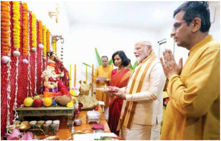
नई दिल्ली में सीजेआई डीवाई चंद्रचूड़ के आवास पर 'गणपति पूजन' में भाग लेते हुए प्रधानमंत्री नरेंद्र मोदी