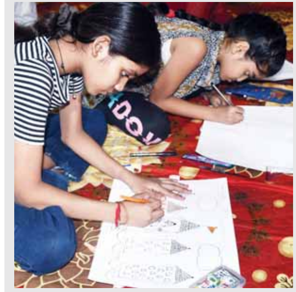
महाराष्ट्र मित्र मंडल द्वारा आयोजित चित्रकला प्रतियोगिता में भाग लेते बच्चे।