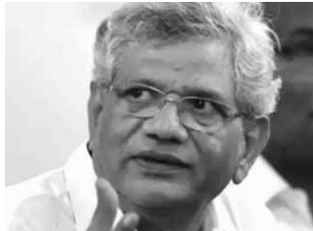
12 अगस्त 1952- 12 सितंबर 2024

उस समय असहज स्थिति में तब देखा गया था जब केरल में 2016 के विधानसभा चुनाव के तुरंत बाद माकपा द्वारा आयोजित प्रेस वार्ता की थी। जिसमें येचुरी ने दुखी भाव से घोषणा की थी कि पिनाराई विजयन राज्य के मुख्यमंत्री होंगे। हालांकि व्यापक रूप से यह माना जा रहा था कि वीएस अच्युतानंदन को मुख्यमंत्री बनाया जाएगा, लेकिन चेन्नई के एक प्रकाशन गृह के मालिक समेत पार्टी के बड़े लोगों के मन में कुछ और ही चल रहा था और उन्होंने विजयन की ताजपोशी सुनिश्चित की। पूरे चुनाव प्रचार के दौरान राज्य में कहीं भी विजयन के पोस्टर या तस्वीरें नहीं लगाई गईं। यह पूरी तरह से अच्युतानंदन का शो था, क्योंकि 93 वर्षीय वयोवृद्ध राजनेता ने अपने विशिष्ट भाषणों और कांग्रेस पर