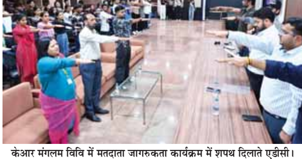
केआर मंगलम विवि में मतदाता जागरूकता कार्यक्रम में शपथ दिलाते एडीसी।