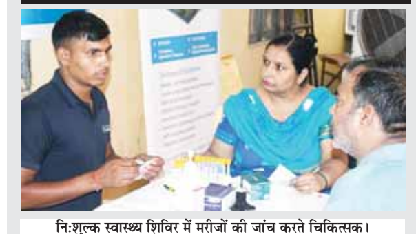
नि:शुल्क स्वास्थ्य शिविर में मरीजों की जांच करते चिकित्सक।