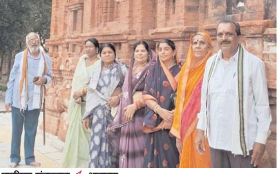
पायनियर संवाददाता < भाटापारा www.dailypioneer.com

इतिहास अपने आप में वह एहसास है जो सीधे हमें अतीत से जोड़ती है तथा यही जुड़ाव एक प्रेरणा के रूप में हमारे वर्तमान को प्रभावित करते हुए नयी दिशा प्रदान करती है, इसलिए हर व्यक्ति समाज एवं देश के लिए ऐतिहासिक तथ्य बहुत मायने रखते हैं तथा इनका संवर्धन संरक्षण एवं अध्ययन आवश्यक हो जाता है, भारत के गौरवशाली इतिहास को अपने में समेटे हुए विभिन्न ऐतिहासिक स्थल हमारी संस्कृति की भव्यता एवं दिव्यता का हर पल एहसास कराते है।