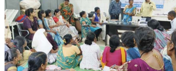
पायनियर संवाददाता < कोण्डागांव www.dailypioneer.com

जल जीवन मिशन से ग्रामीण क्षेत्रों में पेयजल की समस्या का समाधान करने के साथ-साथ महिलाओं को सशक्त बनाने का कार्य भी किया जा रहा है। इस मिशन का उद्देश्य हर घर हर घर में शुद्ध पेयजल उपलब्ध कराना है, लेकिन इसके साथ ही जल संरक्षण और जल परीक्षण में महिलाओं की भागीदारी को भी