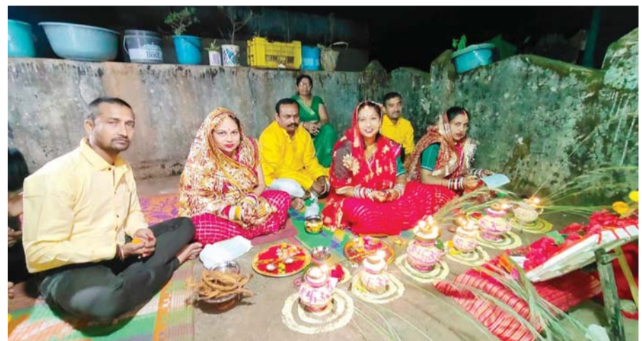
पायनियर संवाददाता < किरन्दुल www.dailypioneer.com

लौहगरी किरन्दुल में सुहागिनों ने पति की दीर्घायु के लिए रखा करवा चौथ व्रत। सुहागिनों के खास पर्व करवा चौथ पर कुंवारी लड़कियां भी मनचाहे पति के लिए करवा चौथ का व्रत रखती हैं। करवा चौथ पर सौभाग्य की कामना करते हुए निरजला व्रत रखने का विधान है। दो दिन पूर्व से ही करवा चौथ पर्व की तैयारी शुरू कर दी जाती है। करवा चौथ के दिन महिलाएं सूर्योदय से लेकर चंद्रोदय तक निरजला उपवास