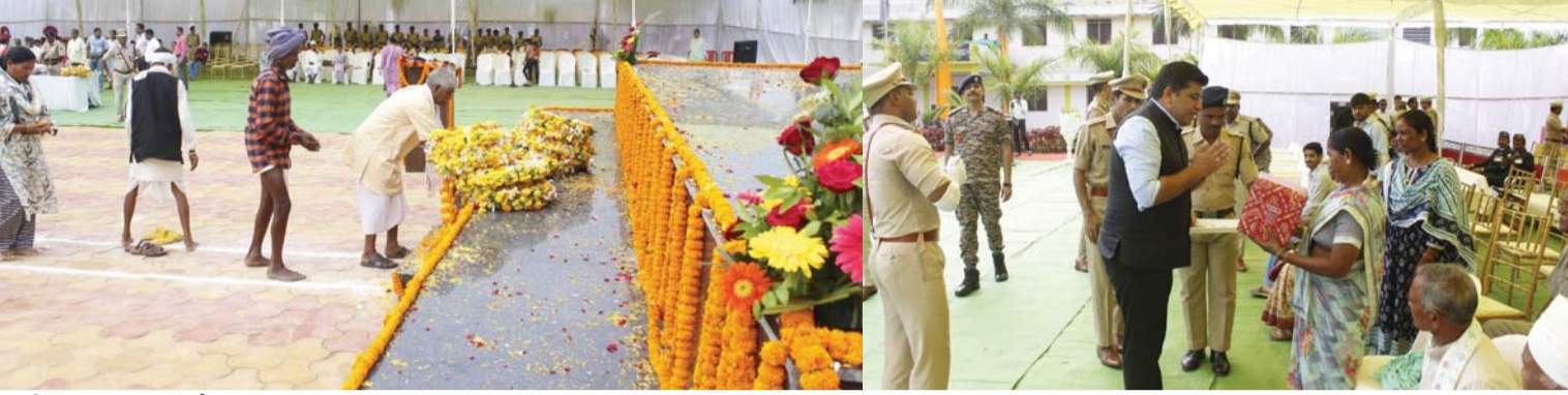
पायनियर संवाददाता < कोण्डागांव www.dailypioneer.com

55 वर्ष पहले 21 अक्टूबर 1959 को लिबत में चीन के साथ भारत की 2500 मील लंबी सीमा की सुरक्षा की जिम्मेदारी भारत के पुलिसकर्मियों की तीन बटालियन पर थी। पहले दो बटालियन अपनी गस्त पूरी करके वापस आ गए लेकिन तीसरी बटालियन गस्त से वापस नहीं लौटी। उत्तर-पूर्वी लद्दाख के हॉट स्पॉट इलाक़ों में तैनात इन पुलिस कर्मियों की टुकड़ी पर चीनी सेना ने घात लगाकर हमला कर दिया। इसमें हमारे