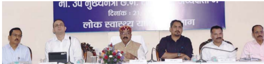
पायनियर संवाददाता < अंबिकापुर www.dailypioneer.com

उप मुख्यमंत्री ने पीएचई के कार्यों की समीक्षा की, अधिकारियों को एफएचटीसी कवरेज की समीक्षा और जांच कर लोगों से फीडबैक लेने कहा