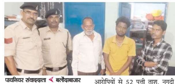
पायनियर संवाददाता < बलौदाबाजार www.dailypioneer.com

ऑपरेशन विश्वास के तहत थाना पलारी पुलिस द्वारा अवैध रूप से शराब बिक्री करने वाले असमाजिक तत्वों एवं जुआ, सट्टा जैसे अवैधधार्मिक कार्यों में लिप्त आरोपियों को धरपकड़ कार्यवाही जारी है। इसी क्रम में 16 अक्टूबर को थाना पलारी की पुलिस टीम द्वारा घेराबंदी कर पलारी नगर बस्ती में जुआ खेलते हुए 03 आरोपी जुआरियों को गिरफ्तार किया गया है।