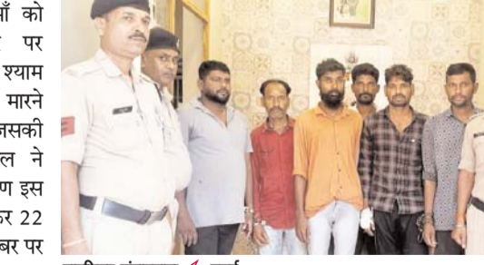
पायनियर संवाददाता < उतई www.dailypioneer.com

पुलिस ने एक बकरा चोर गिरोह का भंडाफेड कर 6 आरोपियों को गिरफ्तार किया है। आरोपियों के पास से चोरी की 12 बकरियां भी जब्त की गई है। उन्होंने पिछले कुछ दिनों में 27 से ज्यादा बकरियां चुराई थीं। 9 नगर पंचायत की फोटोयुक्त निर्वाचक नामावली का प्रारंभिक प्रकाशन में दावे-आपति हेतु अंतिम तिथि 23 अक्टूबर