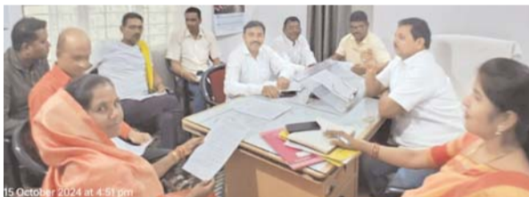
पायनियर संवाददाता < उतई www.dailypioneer.com

पीआईसी ने दी विभिन्न विकास कार्यों के लिए मंजूरी