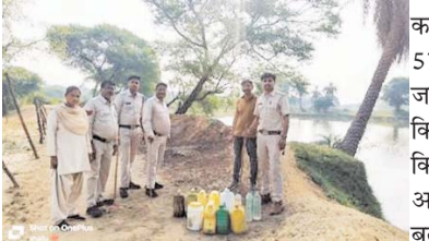
पायनियर संवाददाता < धमतरी www.dailypioneer.com

कलेक्टर नम्रता गांधी के निर्देश पर आबकारी अमला द्वारा जिले में अवैध शराब के विरुद्ध लगातार कार्यवाही की जा रही है। इसी कड़ी में भखारा के ग्राम कोपेडिही में