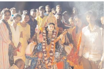
पायनियर संवाददाता < दल्हौलीराजहरा www.dailypioneer.com

वार्ड नंबर 4 एकलव्य नगर मां शारदा उत्सव समिति द्वारा पंचमी में मां सरस्वती की स्थापना की जाती है और 5 दिनों तक पूजा अर्चना के बाद माता की प्रतिमाओं और ज्योति जवारा का पूजा हवन कर विवर्जन किया जाता है। देवी जस गीतों के साथ माता को बिदाई दी जाती है बिदाई से श्रद्धालुओं के आंखों में आंसू के साथ माता के जाने का गम साफनजर आया। माता की भक्ति में लीन होकर सरस्वती माता के मूर्ति के सामने सामने झुमते नजर आए तालाब तक जा पहुंचे जहां उन्हें भी शांत कराया गया तालाब पहुंचकर पंडित के मंत्र उच्चारणों और आरती के बाद प्रतिमा का विवर्जन किया गया वार्ड क्रमांक 4 मां शारदा