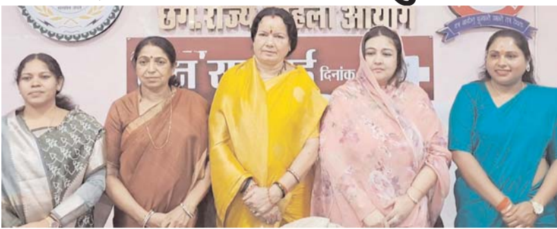
पायनियर संवाददाता < रायपुर www.dailypioneer.com

मुख्यमंत्री विष्णु देव साय की पहल पर राज्य के आधी आबादी महिलाओं को न्याय दिलाने के लिए गठित राज्य महिला आयोग में महिला सदस्यों की नियुक्ति छत्तीसगढ़ शासन द्वारा 26 सितम्बर 2024 को की गई। छत्तीसगढ़ राज्य महिला आयोग के रिक्त 05 पद पर सदस्यों की नियुक्ति की गई।