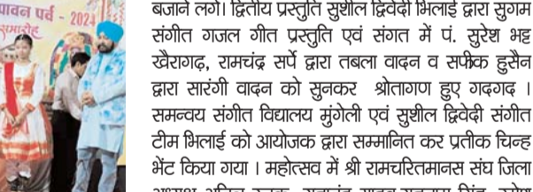
पायनियर संवाददाता < बेमेतरा www.dailypioneer.com