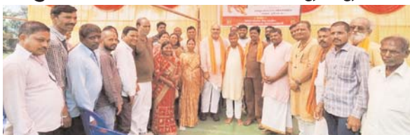
पायनियर संवाददाता < उतई