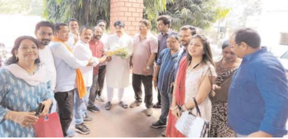
पायनियर संवाददाता < धमतरी www.dailypioneer.com

मुख्यमंत्री, उपमुख्यमंत्री एवं प्रदेश महामंत्री का नेता प्रतिपक्ष एवं भाजपा पार्षदगणों ने आभार जताया