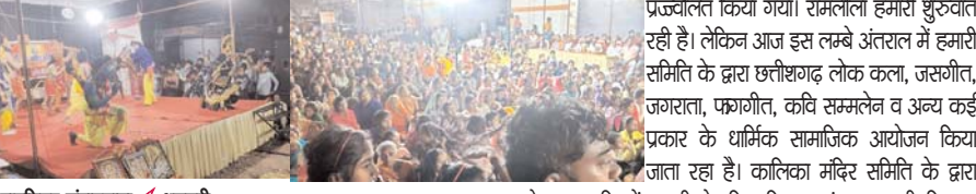
पायनियर संवाददाता < धमतरी www.dailypioneer.com