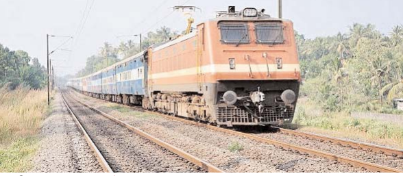
पायनियर संवाददाता < रायपुर www.dailypioneer.com

रेलवे प्रशासन द्वारा अधोसंरचना विकास के कार्य तेज गति से किए जा रहे हैं। इसी कड़ी में याई रीमाडलिंग हेतु उत्तर मध्य रेलवे के प्रयागराज मंडल के प्रयागराज स्टेशन में नॉन इंटरलॉकिंग का कार्य किया जाएगा। इसके फलस्वरूप मंडल से चलनेवाले वाली कुछ गाडियों परिवर्तित मार्ग से चलेगी। जो 17 से 20 अक्टूबर 2024 को दुर्ग से चलने वाली संख्या 15160 दुर्ग-छपरा सारनाथ एक्सप्रेस परिवर्तित मार्ग वाया मानिकपुर-प्रयागराज छिक्की-वाराणसी-जौनपुर-औडिहार मार्ग होकर चलेगी। इसी प्रकार 18 से 21 अक्टूबर 2024 को