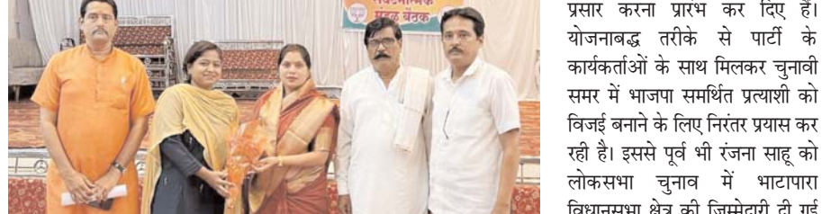
पायनियर संवाददाता < धमतरी www.dailypioneer.com

नांदेड़ दक्षिण विधानसभा का बनाई गई प्रभारी