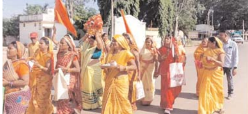
पायनियर संवाददाता < उतई

सेलूद की पवित्र धरती धार्मिक अनुष्ठान के माध्यम से इतिहास रचने वाली है : खेमिन साहू