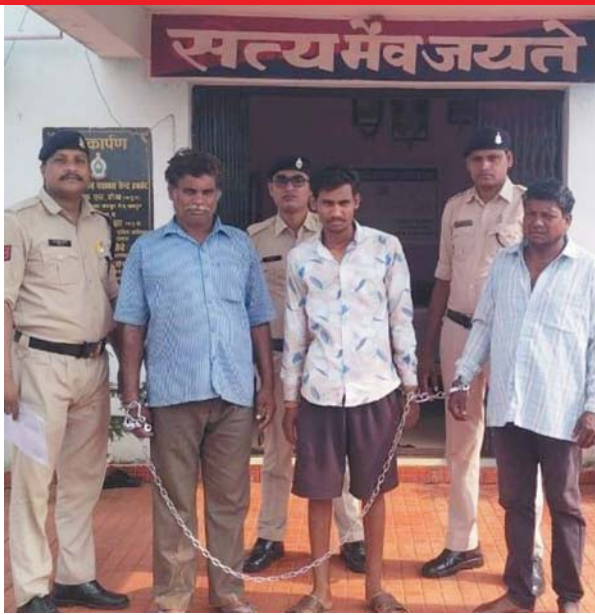
डंप किया गया है, जिसे दशहरा पर्व के बाद बिक्री करने के लिए आसपास इलाकों में सप्लाई भी कर

ऑपरेशन विश्वास के तहत पुलिस द्वारा अवैध रूप से शराब बिक्री करने वाले शराब कोचियों की धरपकड़ कार्यवाही लगातार जारी है। इसी क्रम में विश्वस्त सूत्रों से सूचना मिली कि अभी हाल ही में दशहरा पर्व के बाद आसपास इलाकों में सप्लाई करने के लिए जिले में कहीं भारी मात्रा में एमपी शराब डंप किया गया है। कि सूचना पर जिला बलौदाबाजार-भाटापारा पुलिस टीम द्वारा तकनीकी विश्लेषण एवं मुखबिर से प्राप्त आसूचनाओं के आधार पर भारी मात्रा में शराब डंप करने वाले आरोपियों का चिन्हांकन प्रारंभ किया गया। इसी बीच पुलिस टीम को पुख्ता सूचना मिली कि थाना हथबंद क्षेत्र अंतर्गत ग्राम केसदा में आरोपियों द्वारा एक फार्महाउस में भारी मात्रा में शराब