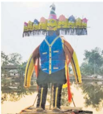
पायनियर संवाददाता < उर्दा www.dailypioneer.com

राक्षसों के जमीन अथवा आसमान में नहीं मरने जैसे चतुराई वाले वरदानों